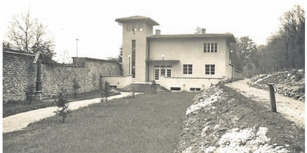
Schützenverein unter der Zinne.