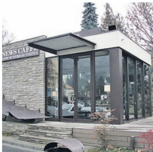
Das neue Informationszentrum für Touristen befindet sich in einem Cafe am Rand des Titulescu-Parks seitlich vom Gebäude der Stadtverwaltung. uk