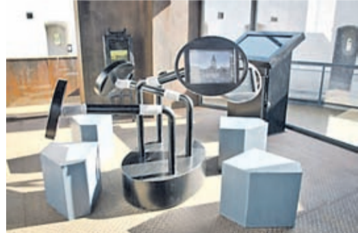
Virtuelle Reise durch Kronstadt.

An einem der Bildschirme werden die Menschen vorgestellt, die die Geschichte der Stadt gestaltet haben, die Orte, an denen wichtige Ereignisse stattgefunden haben sowie der Ereignisse, die dort statt-