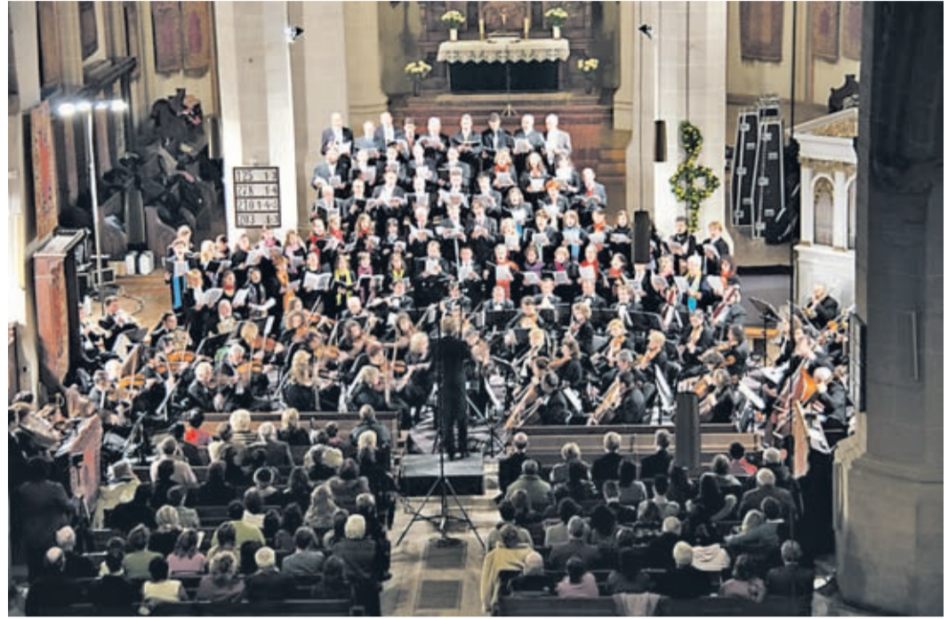
Abschlusskonzert von Musica Coronensis

facettenreichen Musikrepertoires an. Die runde und klare Akustik der ältesten gotischen Kirche unserer Stadt eignet sich besonders gut für Chordarbietungen, aber auch für kleinere Instrumentalensembles und Soloauftritte (Orgel). In diesem Jahr werden u. a. 3 Chorkonzerte in Bartholomä angeboten. Diese Reihe wurde im Jahr 2012 mit interessanten Kammermusikabenden junger Musiker im Pfarrhaus der Bartholomäer Kirchen-