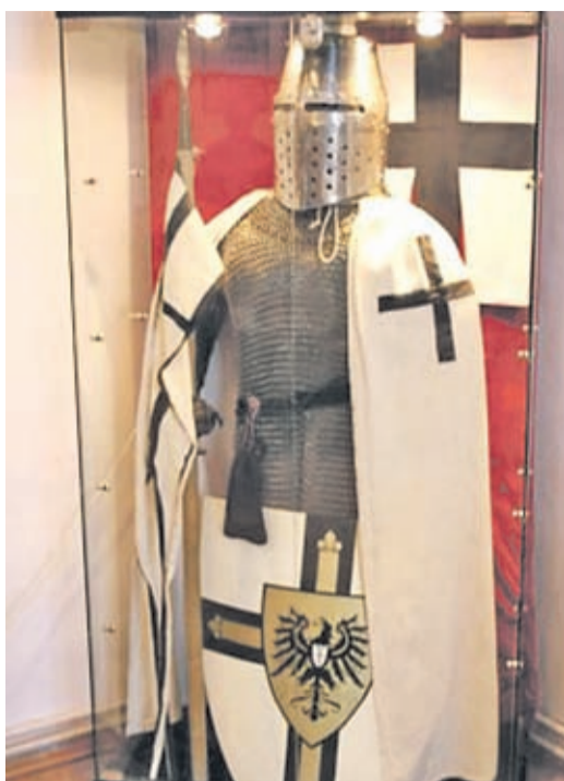
Ritterrüstung in der Domkirche zu Königsberg (heute Kaliningrad) wohin nach 1457 der Sitz des Hochmeisters aus Marienburg bei Danzig verlegt wurde.

Die Bilder von Marienburg im Burzenland dienen dazu, die Präsenz der deutschen Kolonisten vor dem Ritterorden zu dokumentieren. Mit Bildern von Artefakten aus Akkon, Montfort, Marienburg an der Nogat, von Skulpturen, Grabsteinen, Werkzeugen und Waffen bis zum transportablen Madonnen-schrein, dokumentierte der Vortrag auch den militärisch-religiösen Alltag der Ritter. An den Kriegszügen nahm „internationales“ Rittertum teil von England bis Polen, zu einer Zeit als die Ostsiedlung ihren Höhepunkt schon überschritten hatte (13. Jh.). Diese hatte im 12. Jh. begonnen, nachdem schon 1100 keine nennenswerten Rodungsgebiete in Westeuropa zur Verfügung standen. Begleitet war dieser durchaus europäische Prozess (Siedler waren auch Niederländer, Dänen, Wallonen und Schotten) vom Drang der deutschen Fürsten über die Weichsel bis nach Livland zu gelangen. Und ohne Hilfe der hanseatischen Flotte mit ihrem Zentrum in Lübeck und ihrem Städtenetz wäre die Ostsiedlung nicht so rasch verlaufen. Bilder belegen die wirtschaftliche