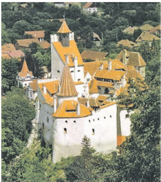
Im Südwesten des Burzenlandes wurde in den Jahren 1377-1382 von den Burzenländer Sachsen auf dem Dietrichstein die Törzburg errichtet.

Der Flugplatz „Piatra Craiului“ (Königstein) wurde gestern eröffnet. Ultraleichte Flugzeuge können von nun an nur ein paar Kilometer von der Törzburg oder von Zărnești entfernt landen. Die