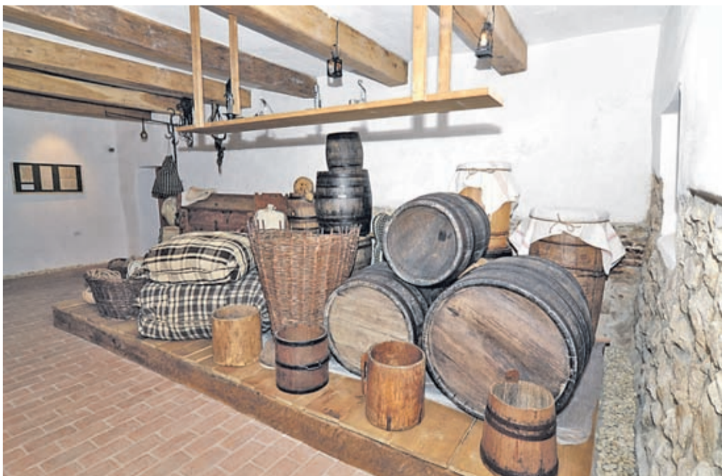
Lageraum im Untergeschoß mit für das Mittelalter typischen Transportverpackungen: Fässer, Körbe und Gebinde. In einem langer Gang im Erdgeschoß werden Waren gezeigt, die in Kronstadt gehandelt wurden.