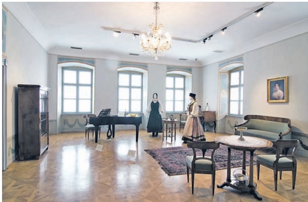
Das Patrizierzimmer im ersten Stock widerspiegelt das bürgerliche Leben in Kronstadt, welches Traditionen (symbolisiert durch Trachten) und moderne Einflüsse (wie beispielsweise Biedermeier-Möbel) vereint.