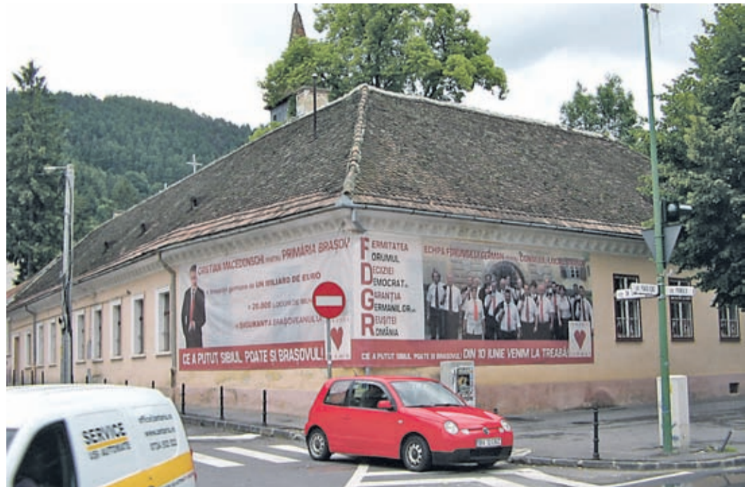
Der Sitz des Kronstädter Deutschen Forums mit Wahlwerbung für den Bürgermeisterkandidaten Christian Macedonschi sowie für die Forums-Stadtrat kandidaten.