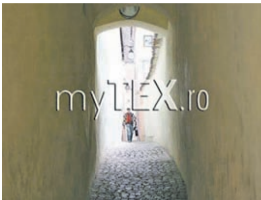
Das Schnurgässchen, beliebtes Fotomotiv von Touristen aus aller Welt.

Mit einer Breite von 111-135 cm ist das Schnurgässchen in Kronstadt die schmalste „Gasse“ in Osteuropa und wurde dadurch in den letzten Jahren immer mehr zu einem touristischen Anziehungspunkt. Die Besucher kommen aus allen Ecken der Welt, sei es aus historischen Gründen, sei es aus Neugier.