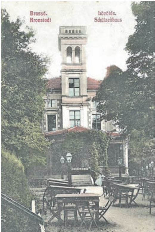
Schützenhaus in Kronstadt, alte Postkarte.