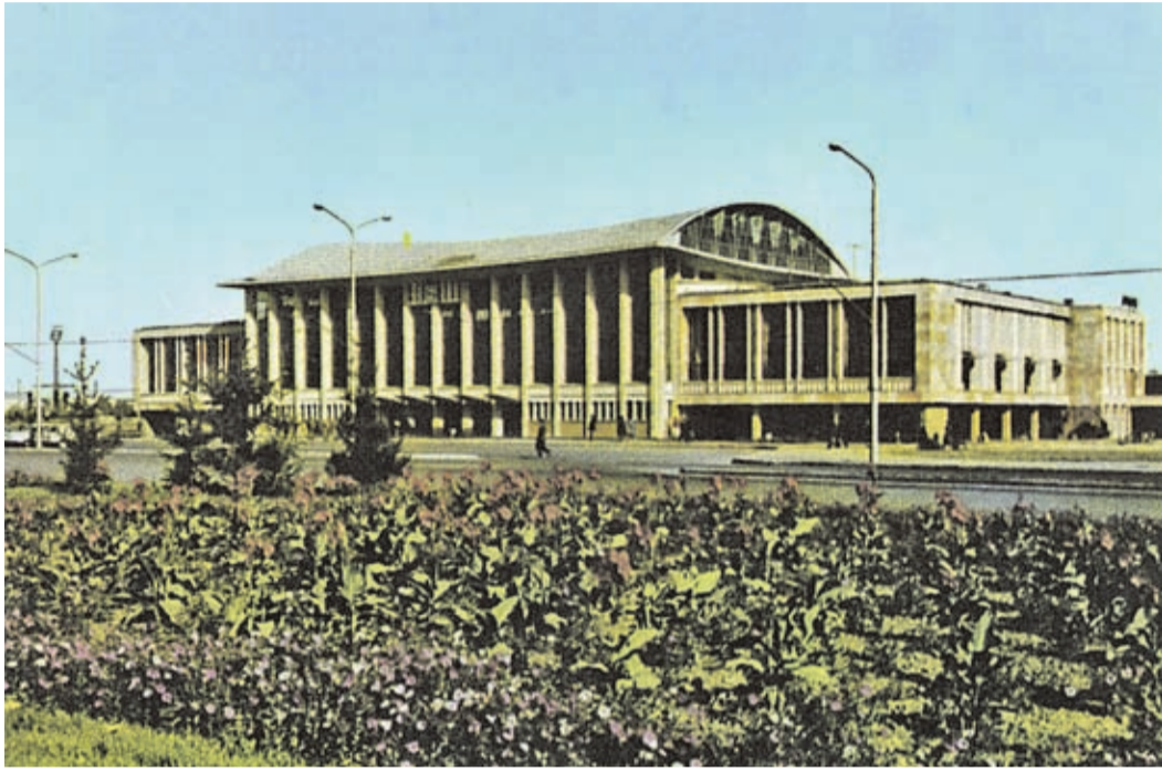
Kronstädter Hauptbahnhof aus den 1960er Jahren.

Dank unserer Versandfirma ist die Lesernummer nun auf dem Adressaufkleber eindeutiger zu finden. Sie befindet sich unten rechts, als sechsstellige Zahl. Bitte bei Schriftverkehr, vor allem bei Zahlungsvorgängen, nur diese Lesernummer zu verwenden, nicht die lange Zahlenreihe am oberen Ende des Adressetiketts. Ihre Abonnentenverwaltung