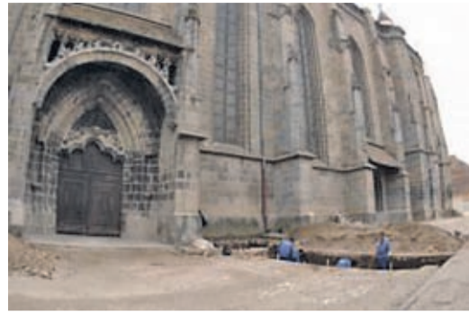
Ausgrabungen im Kirchhof der Schwarzen Kirche.

vermutet man weitere, möglicher Weise aus der Zeit vor 1200. Nach Aussage des leitenden Archäologen Daniel Marcu Istrate gingen die Fachleute schon vor Beginn der Arbeiten davon