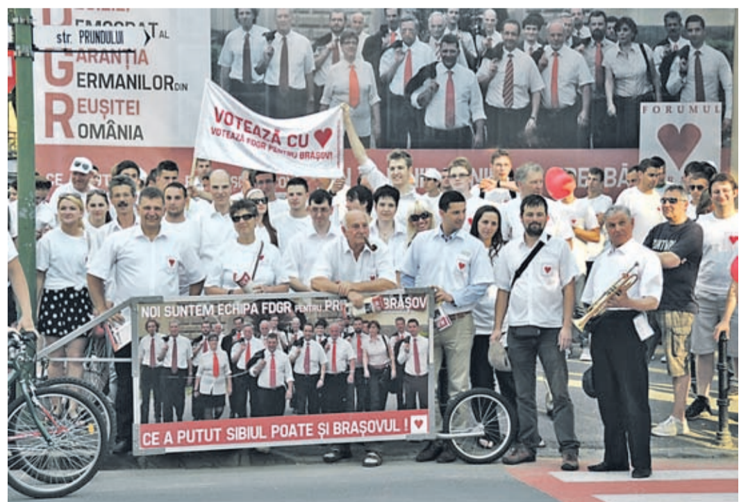
Wahlkampf als gemeinschaftsstiftendes Erlebnis: die Kandidaten des Forums inmitten der Helfer vor dem Kronstädter Forumssitz am Tag der Abschlusskundgebung.