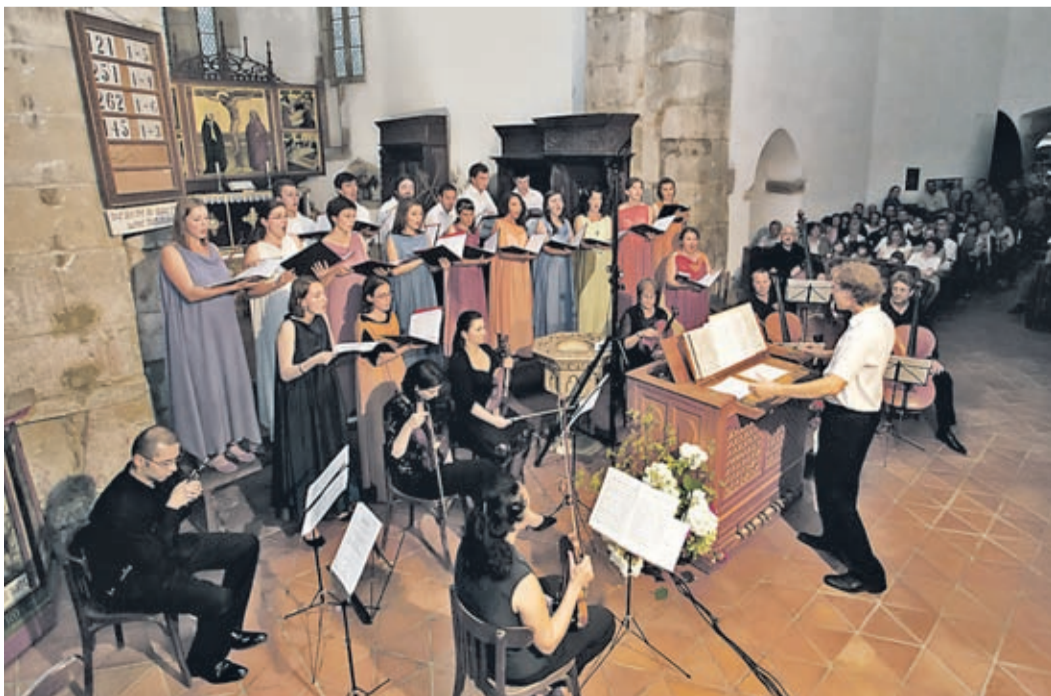
Jugendbachchor bei Diletto Musicale

Bitte schreiben Sie an die Redaktion, sollten Sie weitere Webcams in Kronstadt kennen. Wir werden diese Übersicht gelegentlich aktualisieren. uk