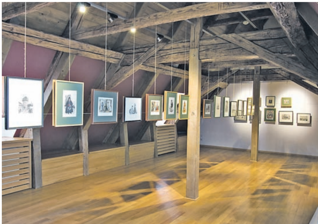
Raum für Wechselausstellungen im Dachgeschoß

Der Raum rechts des Eingangs beeindruckt durch die bemalte Decke. Das Blumenmuster stammt aus dem 18. Jahrhundert, war mehrfach übermalt und wurde erst bei den Restaurierungsarbeiten der letzten Jahre entdeckt. Der Ausstellungsraum stellt das Geschäftszimmer eines Kronstädter Händlers dar. Hier trafen sich die von weither angereisten Kaufleute, um Geschäftsabschlüsse zu tätigen, Nachrichten auszutauschen und die Marktentwicklung zu besprechen.