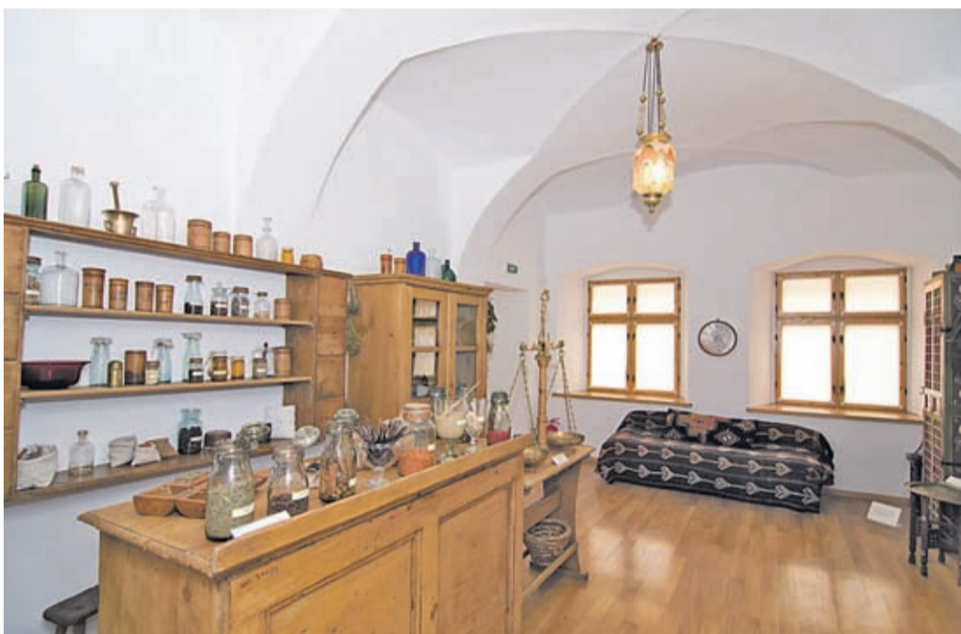
Medizin und Gewürze waren besonders häufig in Kronstadt gehandelte Waren. im 16. Jahrhundert soll der Gewürzhandel zwischen 20% und 40% des gesamten Handelsvolumens der Stadt betragen haben.