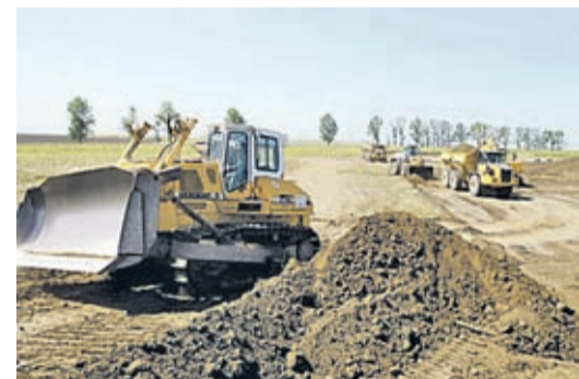
Die Autobahn bleibt ein unerfüllter Traum für die Kronstädter.

Der Staat hat zweimal versucht die Autobahn Kronstadt – Comarnic zu bauen. Den letzten Versuch gab es 2010, als der Gewinner der Ausschreibung, das Konsortium Vinci (Frankreich) – Aktor (Griechenland), auf den Vertrag verzichtete.