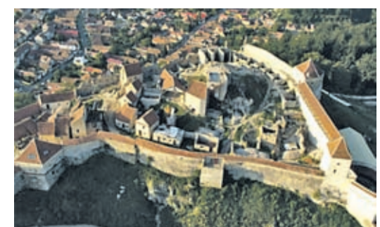
Die Rosenauer Burg, im Hintergrund das Stadtzentrum.

Aus: „ Braşovul Tău “, 4. April 2012, frei übertragen von Bernd Eichhorn