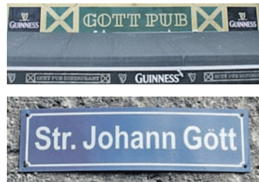
Lange Zeit war der Name „Johann Gott“ auf dem Straßenschild falsch geschrieben (siehe auch Folge 2 vom 5. Juli 2010, S. 9 dieser Zeitung), vor geraumer Zeit wurden korrekte Bezeichnungen angebracht. Das in der Straße gelegene Hotel Gott hat vor einigen Monaten eine Kneipe gegenüber der Redoute eröffnet – mit den Namen „Gott Pub“. Ob das Guinness hier wohl himmlisch schmeckt? uk