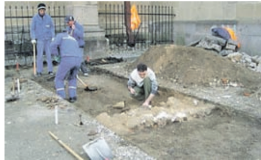
Autor: Mihaela Grădinariu, 12. April 2012

Noch weiß man nicht genau, wann der Friedhof angelegt wurde, da die Arbeiten erst die oberen Erdschichten freigelegt haben. Da man jedoch annimmt, dass dieser Teil Siebenbürgens um das Jahr 1200 besiedelt und um diese Zeit wohl hier auch eine Kirche errichtet wurde, muss es im Umfeld auch einen Friedhof gegeben haben. Die ersten Funde lassen sich den Jahren 1600-1700 zuordnen. Eine exakte Chronologie wird erst möglich sein, wenn die Gebeine gründlich untersucht wurden. Dazu wird jedes Skelett in der Lage fotografiert, in der es gefunden wurde. Dann wird es sorgfältig verpackt und mit der gesamten Dokumentation versehen zum Institut für Anthropologie der Rumänischen Akademie geschickt. Nach Abschluss der Forschungsarbeiten sollen die Gebeine wieder bestattet werden.