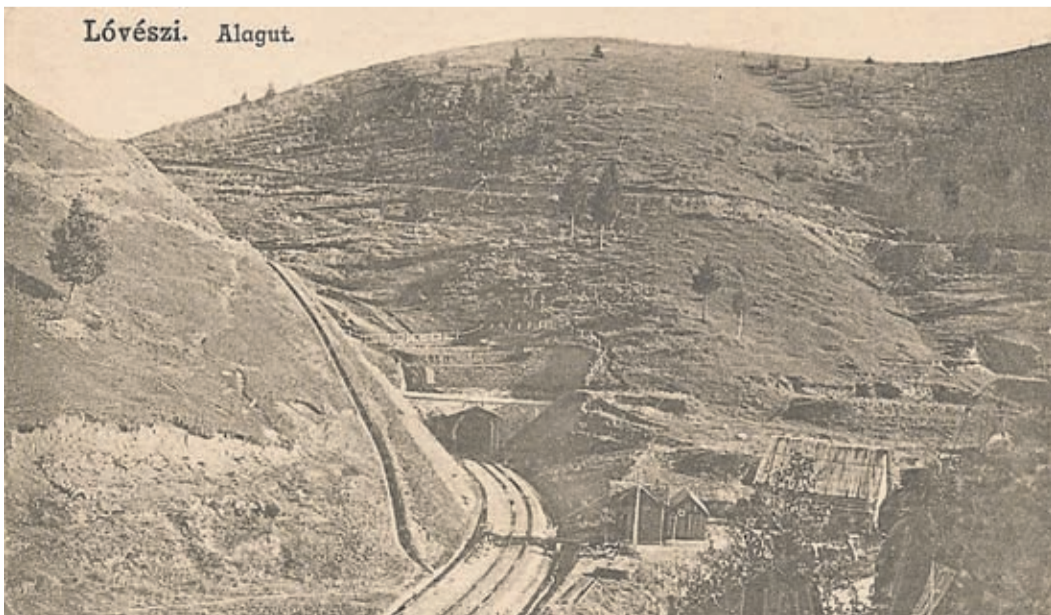
Militärische Schießstätte, Kronstadt, alte Postkarte.

Schützenwesen in Kronstadt. Es war, wie auch andernorts, eine Notwendigkeit, geboren aus dem