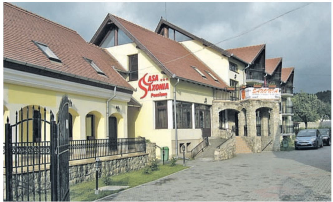
Das als „Sozialzentrum Rosenau“ bekanntgewordene Anwesen: Es umfasst eine große gemauerte Scheune, eine kleine Poliklinik, die den Patienten die Fahrt nach Kronstadt erspart, eine Werkstatt, in der bis vor kurzem Thermopan-Tischlerei betrieben wurde und eine dreistöckige Pension.