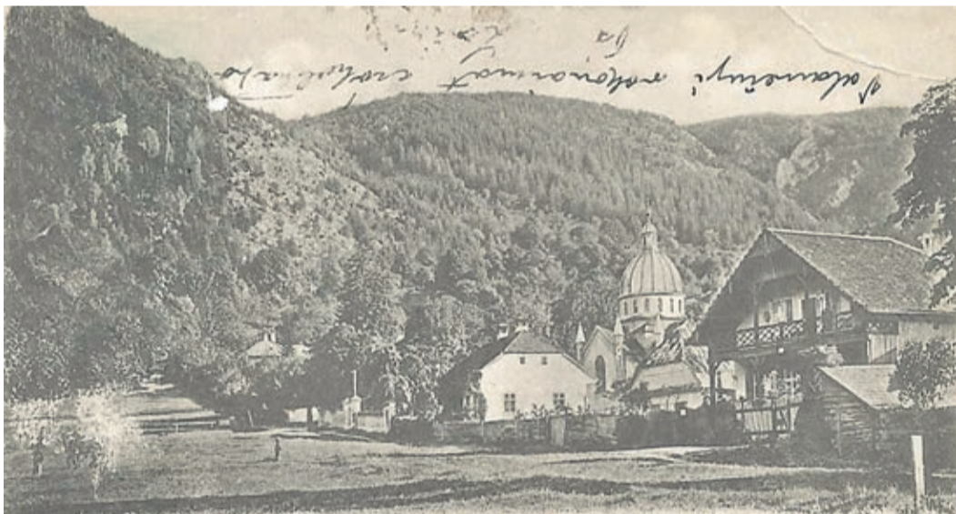
Schützenwiese in Kronstadt, alte Postkarte.