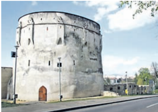
Tuchmacherbastei Kronstadt 2012.

In der Tuchmacherbastei wurde eine Ausstellung eröffnet, in der die Geschichte der wichtigsten Sehenswürdigkeiten Kronstadts virtuell nachvollzogen werden kann.