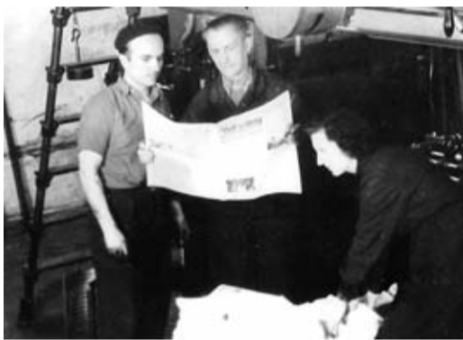
Der Vordruck der Nr. 1 der „Volkszeitung“ wird von den Maschinenmeistern begutachtet. Auf dieser Maschine wurde gut ein Jahrzehnt davor noch die „Kronstädter Zeitung“ gedruckt.

So wurden wir bei der Kollektivierung der Landwirtschaft, die Ende der 1950er, Anfang der 1960er Jahre durchgepeitscht wurde, eingesetzt. Sonntags wurden wir in einen Bus verfrachtet, und ab ging es ins Agnethler Land. Jeder von uns wurde in einem anderen Dorf abgesetzt. Da sollten wir die sächsischen Bauern überreden, in die Kollektivwirtschaft