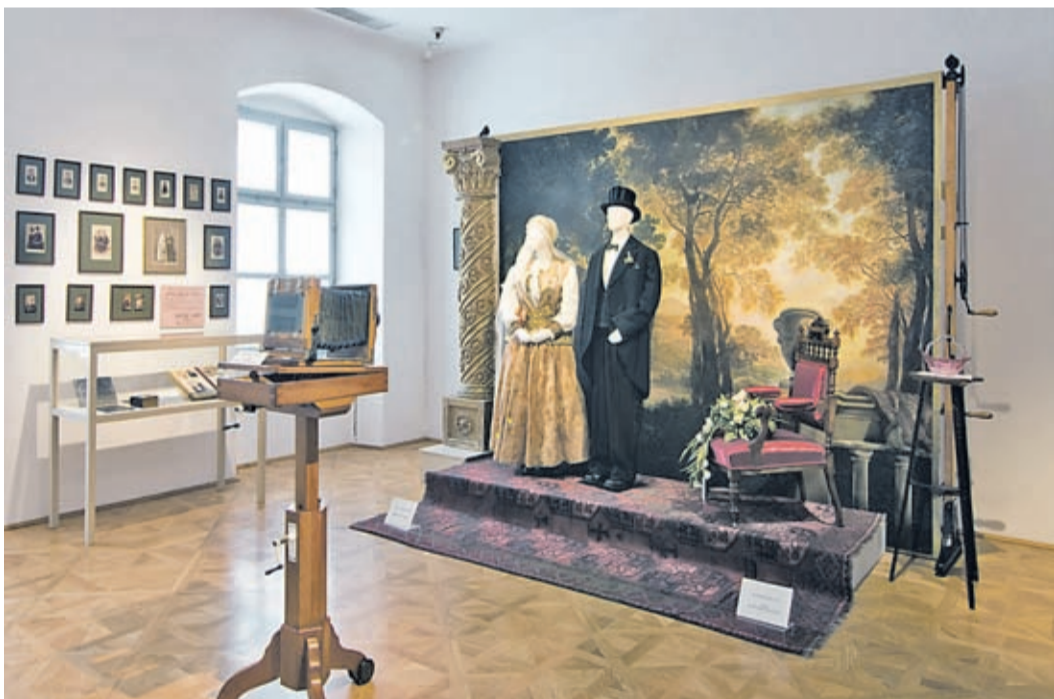
Einen hohen dokumentarischen Wert haben die von den frühen Fotografen (z. B. Leopold Adler und Carl Muschalek) gemachten Fotos. Diesem Handwerk ist ein eigener Raum gewidmet.