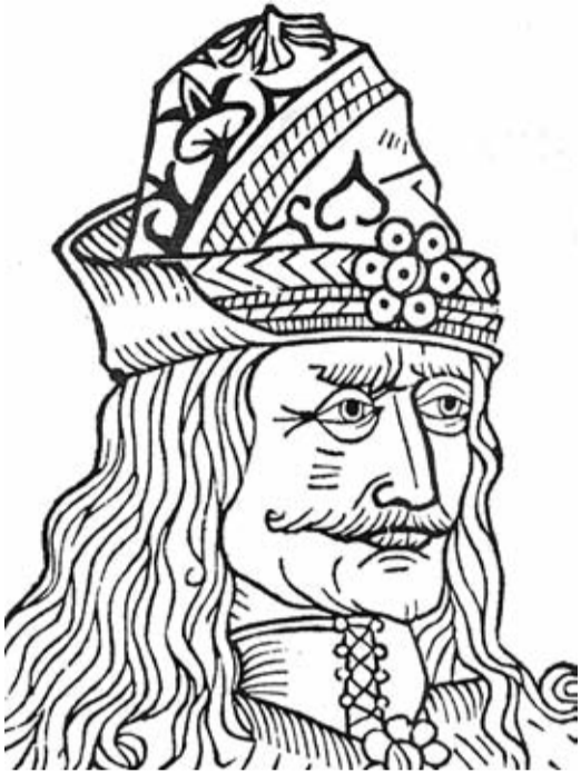
Vlad III., Tepeș (der Pfähler), Fürst der Walachei 1456-1462