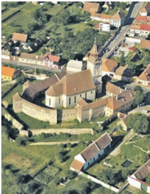
Die Kirchenburg von Petersberg.

Das Institut für Nationales Kulturerbe wird Anfang August eine Ausschreibung für die Vergabe umfassender Renovierungsarbeiten an der Petersberger Kirchenburg machen. Der Vertrag ist für vier Monate und eine Investition von 28,48 Millionen Lei angesetzt, so die constructiibursa.ro . Die evangelische Kirche aus Petersberg wurde im 14. Jahrhundert gebaut und diente dem Schutz vor Angriffen und anderen Gefahren (erst einmal aber dem Gottesdienst, Anm. des Übersetzers ).