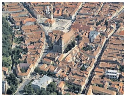
Luftansicht des Kronstädter Zentrums.

Die Virtuellen Touren erlauben es Burgen, Schlösser und Kirchenburgen des Kreises in Pa-