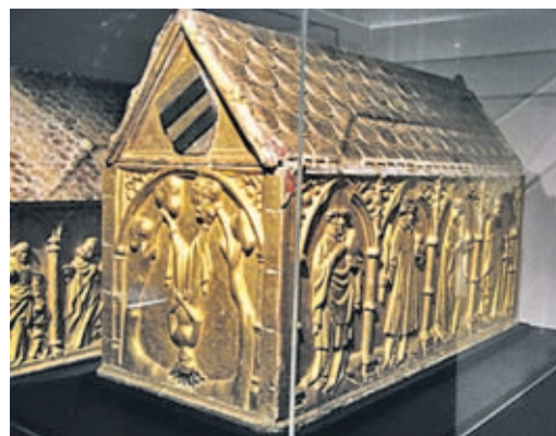
Corona-Reliquienschrein im Quedlinburger Dom.