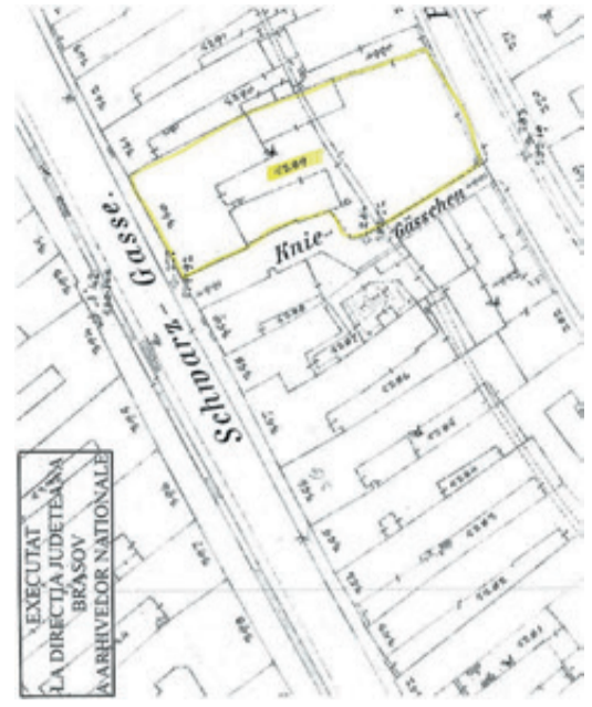
Lageplan mit der Schwarzgasse und Kniegasse um 1900.