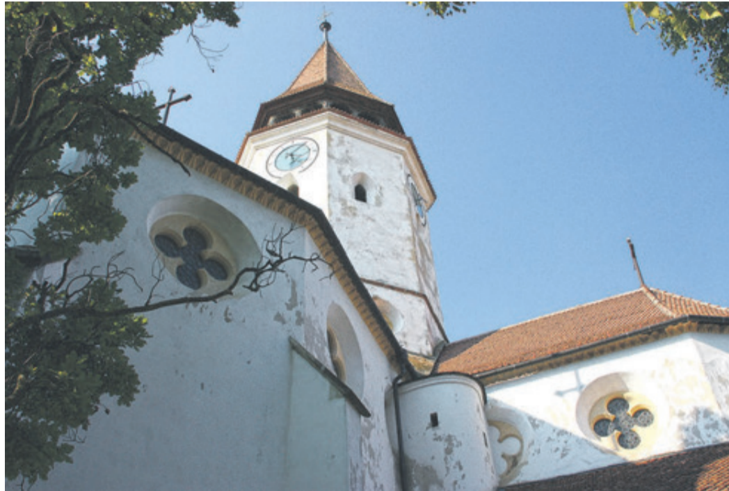
Tartlau – Ansicht der Kreuzkirche, 2011.