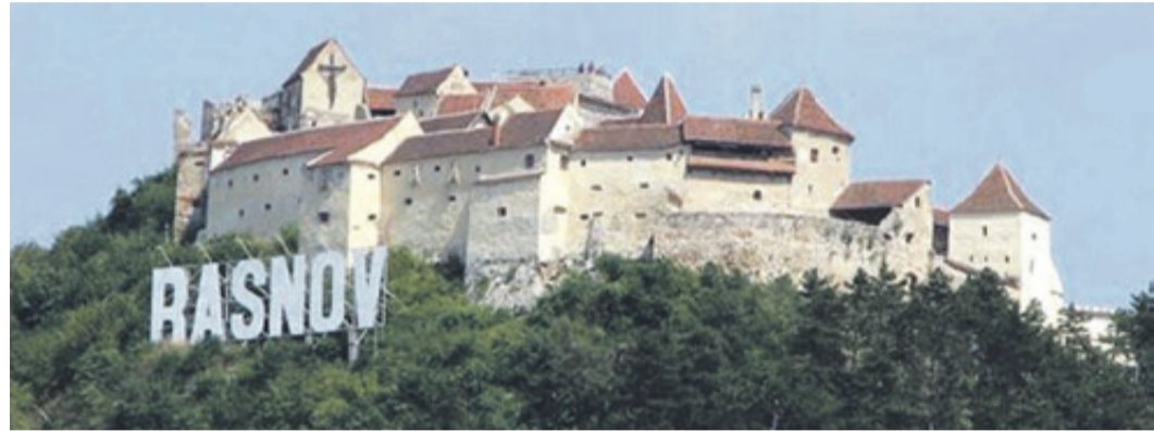
Die Rosenauer Burg.