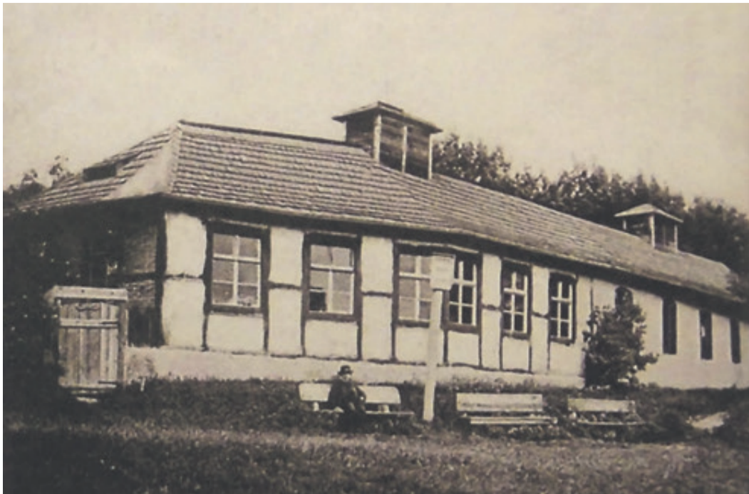
Das Restaurant Warthe, ca. 1910, nach dem Abriss entstand eine bescheidene Kneipe „Warte“.