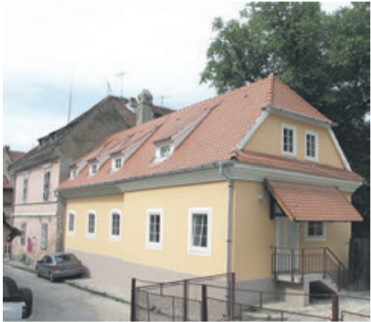
Der neue Anbau ...

Der Name der Schwarzgasse kommt von den dunklen Lederer-Abwässern, die in den offenen Kanal vor der Nordseite der Straße flossen. In der