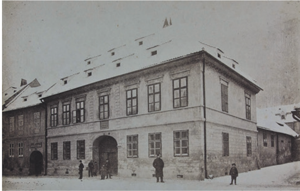
Das Geburtshaus von Johannes Honterus in der Schwarzgasse Ecke Kniegasse, 1896.

„Da ich meine Liebe und Anhänglichkeit zu dem sächsischen Volke, welchem ich angehöre, und insbesondere zu der Kronstädter ev. Kirchengemeinde A. B., deren Mitglied ich bin und an deren Schulanstalten ich meine Ausbildung genossen habe, durch die Tat an den Tag legen wünsche, so bestimme ich, dass mein von meinen lieben Eltern geerbtes, in der unteren Schwarzgasse gelegenes Haus, in welchem unseres großen Reformators Honterus Wiege stand und welches mit einem hierauf bezüglichen Gedenkstein geschmückt ist, der Kronstädter innerstädtischen ev. sächsischen Kirchengemeinde A. B. als Vermächtnis zufallen soll“.