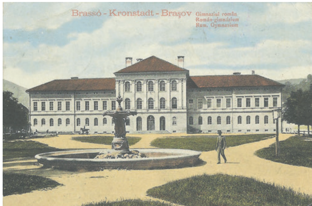
Ansichtskarte des Saguna-Gymnasiums