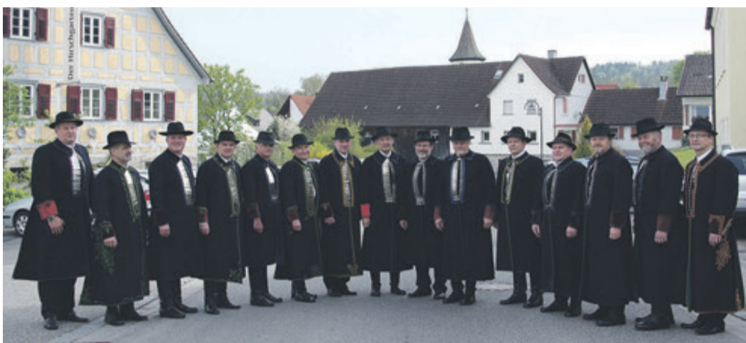
Gruppenbild der Ortsvertreter im blauen Burzenländer Kirchenmantel in Westgartshausen.

Muttersprache in der Form existentieller Bedrohung als letztes Überlebenspodest erlebt haben, um dies zu verstehen. Und vielleicht rührt meine instinktiv heftige Reaktion auf den grundlos zersetzenden Umgang mit der deutschen Sprache daher. „Es ist die Gedankenlosigkeit des Umgangs mit sich selbst. O ja“, sagte Walter [Sch.], „wir erfuhren es in der Fremde, weil wir unsere Persönlichkeit nicht preisgeben wollten. Davon hat man in diesem Land wenig Ahnung ...“