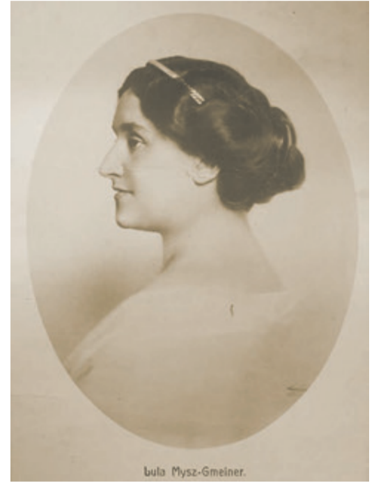
Lula Mysz-Gmeiner Theaterwissenschaftliches Institut Hamburg

Insgesamt handelt es sich bei Lula Mysz-Gmeiner somit um eine außergewöhnliche Künstlerin, die aufgrund ihrer sängerischen Leistungen aus der Masse der zeitgenössischen Sängerinnen herausragte. Zudem sorgte sie noch zu Lebzeiten für die Tradierung ihrer künstlerischen Auffassungen: Nicht nur durch das Unterrichten von unter anderem