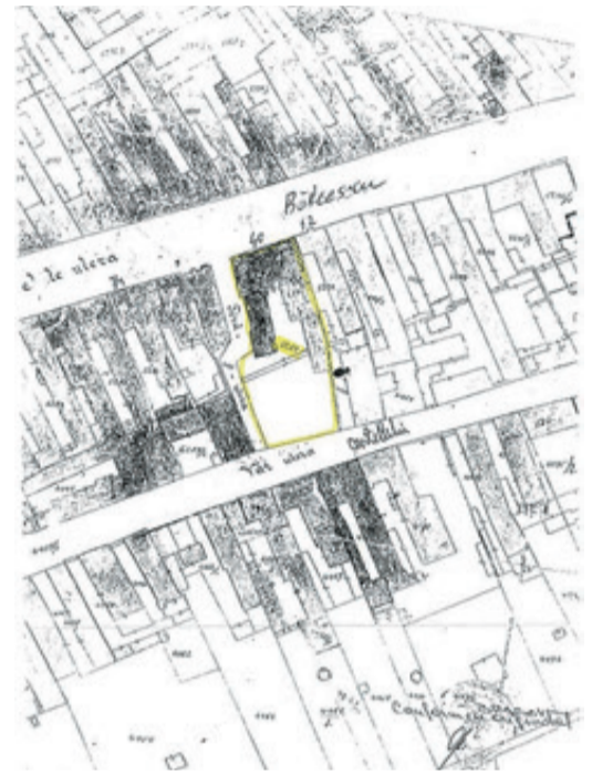
Skizze des Stadtplans der Schwarzgasse und Kniegasse um 1900.