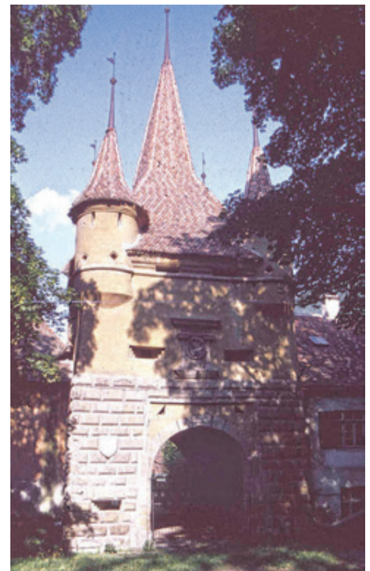
Das Kronstädter Katharinentor, 1994.