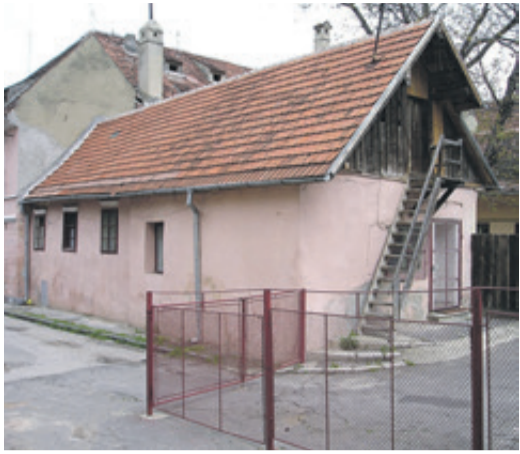
Der alte Anbau ...

Im Jahre 1902 kam durch die Schenkung des Rotgerbermeisters Friedrich Wolf auch das Nachbarhaus Schwarzgasse Nr. 42 in das Eigentum der Honterusgemeinde, die damit das gesamte Areal zwischen der Schwarzgasse und der Burggasse östlich des Kniegässchens erwarb, wo heute drei Häuser stehen.