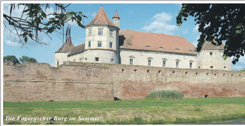
Die Fogarascher Burg im Sommer.

Der Winter war zum Glück nicht hart, es gab kaum Schnee und so konnte ich auch mit mangelhafter Bekleidung meine vom Arzt verordneten Spaziergänge unternehmen. Allerdings gab es nun auch immer öfter Fliegeralarm und so ging ich immer nur so weit, dass ich zwischen Voralarm und Alarm zu Hause sein konnte. So geschah es auch am 9. Februar 1945, einem strahlend schönen Sonntag, dass ich kurz vor dem Hauptalarm zu Hause ankam und direkt in den Keller ging, wo alle schon versammelt waren. Ich stand noch auf der Kellertreppe, die zum Garten führte, als Alarm gegeben wurde und wir auch schon Motorbrummen hörten und die Silbervögel aus Rich-