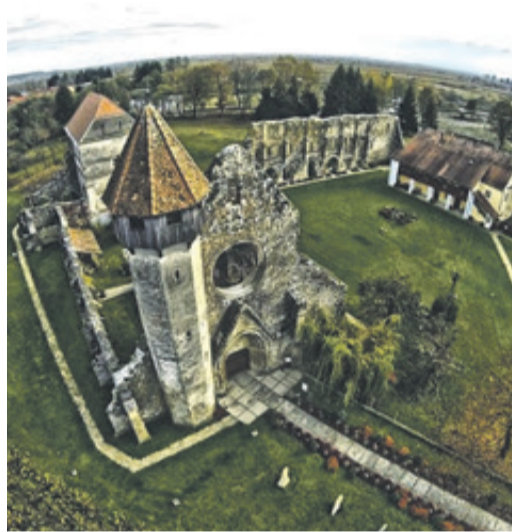
Die Abtei von Kerz, noch immer ein großer Anziehungspunkt.