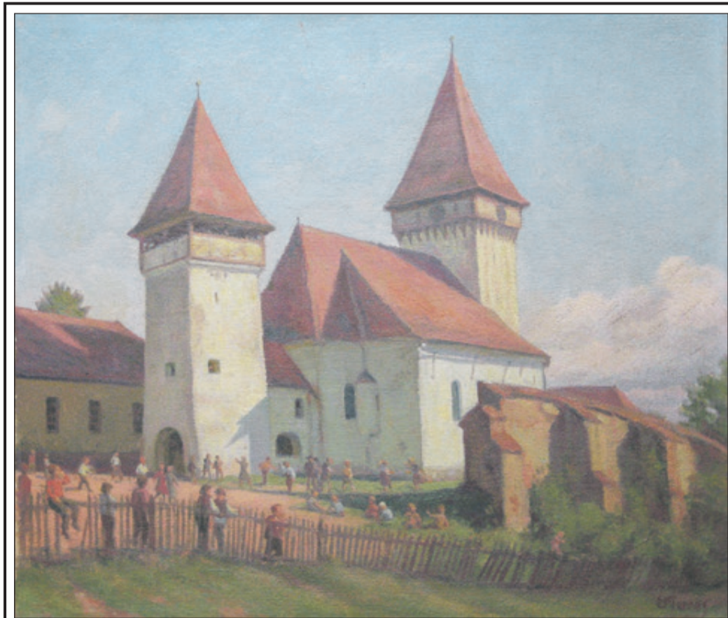
Eduard Morres: Schulpause in Zied (Öl, 1935/39). Dieses Ölgemälde entstand ca. 1935 und ist heute ein künstlerisches „Zeitdokument“. Es vermittelt ein Bild aus einer Zeit, die es so nicht mehr gibt: Eine Szene aus einer Schulpause mit etwa 35 Schülern auf dem Hof der ehemaligen deutschen Schule in Zied. – Damals und auch einige Jahre später, nach dem Zweiten Weltkrieg, stellten die Sachsen in diesem Dorf im Harbachtaler Hochland die Mehrheitsbevölkerung. Im Jahr 2002 lebten dann in Zied (rum. Veseud) nur noch 4 Sachsen und mehrheitlich Rumänen und Roma. Das Bild wird dominiert von der ev. Kirche, einer romanischen Basilika aus dem 13. Jh. – links der Glockenturm, rechts der Wehrturm der Kirchenburg, von der noch Teile der Ringmauer stehen. Auch hier ist Eduard Morres seiner vom französischen Pleinairstil geprägten Malweise treu geblieben – die Licht-Schatten-Effekte zeigen, dass diese „Momentaufnahme“ an einem Nachmittag entstanden ist. B.St.

Die heute nicht mehr vorstellbare Heftigkeit der innersächsischen Auseinandersetzung um „Bleiben oder Gehen?“ kam hinzu. Bergel formulierte als erster die konträren Positionen eindeutig und wurde zum Wortführer des „Gehens“. Denn, sagte er, es gehe nicht mehr um Beharrung auf dem Existenzanspruch der ethnischen Minderheit in Siebenbü-