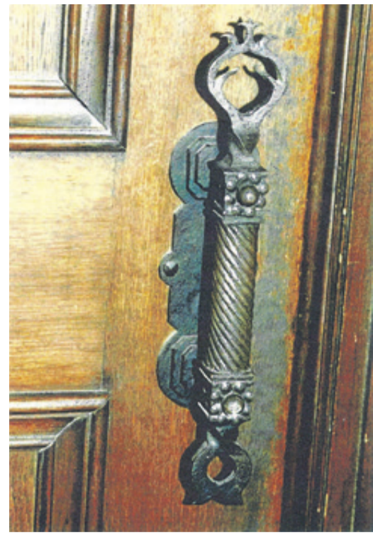
Türklinke der Schwarzen Kirche.

Da wird ein jeder von Ihnen bekannte Gesichter finden, auch wenn sie heute etwas anders aussehen