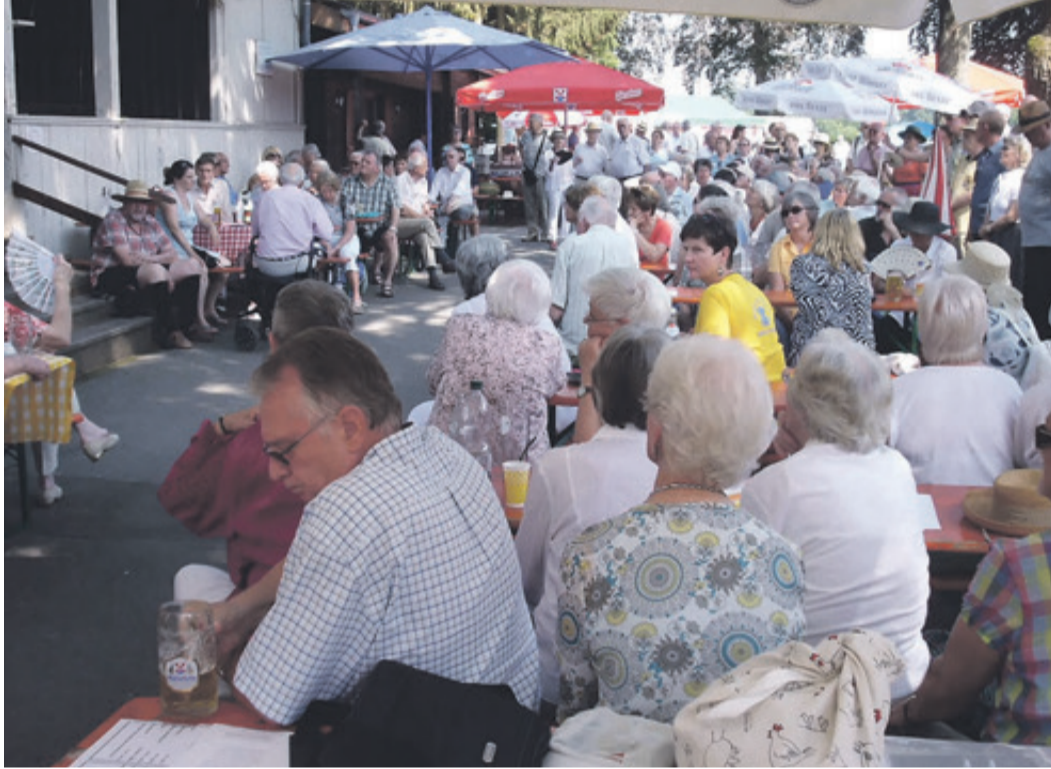
Die Besucher des Honterusfestes lauschen der Quellenrede zu.

Das Honterusfest ist das Heimattreffen aller Kronstädter und damit auch aller sich für die Zinnenstadt engagierenden sächsischen Vereine