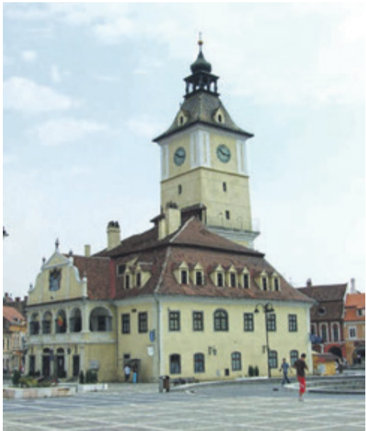
Altes Rathaus mit Turmuhr am Kronstädter Marktplatz.

Die Mechanik der Turmuhr ist am besten verständlich, wenn man sich eine Pendeluhr mit Zuggewichten in einem vergrößerten Maßstab vorstellt. Das Uhrwerk ist im Wesentlichen gleich: Auch im Turm befinden sich meistens zwei Gewichte, eines für das Uhrwerk und eines für das Läutwerk, ein Anker, ein Pendel und meistens auch ein Zifferblatt, allerdings nur um den Zeitstand, ohne nach außen gehen zu müssen, überprüfen zu können. Zusätzlich haben Turmuhrwerke, wenn sie modernisiert wurden, manchmal ein Aufzugsystem mit Elektromotoren, die das Anheben der Zuggewichte automatisch machen. Die Gewichte erzeugen dann, indem sie