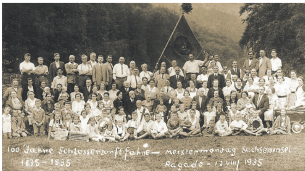
Gruppenbild der Schlosserzunft mit Fahne 1935 im Ragadotal.

brachen viele Handwerksbetriebe wegen der Einfuhr billiger Industriewaren aus Österreich zusammen. Durch das Gewerbegesetz von 1872 wurden die Zünfte aufgehoben und das Handwerk verlor seine besonders hohe gesellschaftliche und wirtschaftliche Stellung. Nur einzelne Handwerker hatten noch den Mut zur fabrikmäßigen Produktion überzugehen, z. B. die Firmen Scherg und Schiel in Kronstadt. So viel als Einleitung zu den Zünften.