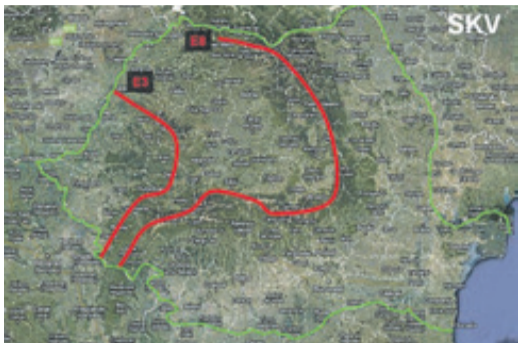
Die beiden europäischen Wanderwege E3 und E8 „Via carpatica“.

Der Anteil von 10 % des Siebenbürgischen Karpatenvereins wird zur Hälfte durch freiwillige Einsätze der Mitglieder und zum Anderen vom Kreisrat Kronstadt erbracht (etwa 14 000 Euro). Am Projektstart waren auch zwei Schweizer Berater vom Verein Schweizer Wanderwege beteiligt, der alle Wanderwege der Schweiz plant und instandhält. Der Verein ist Partner im Projekt und wird mit seinem Wissen beratend tätig sein.