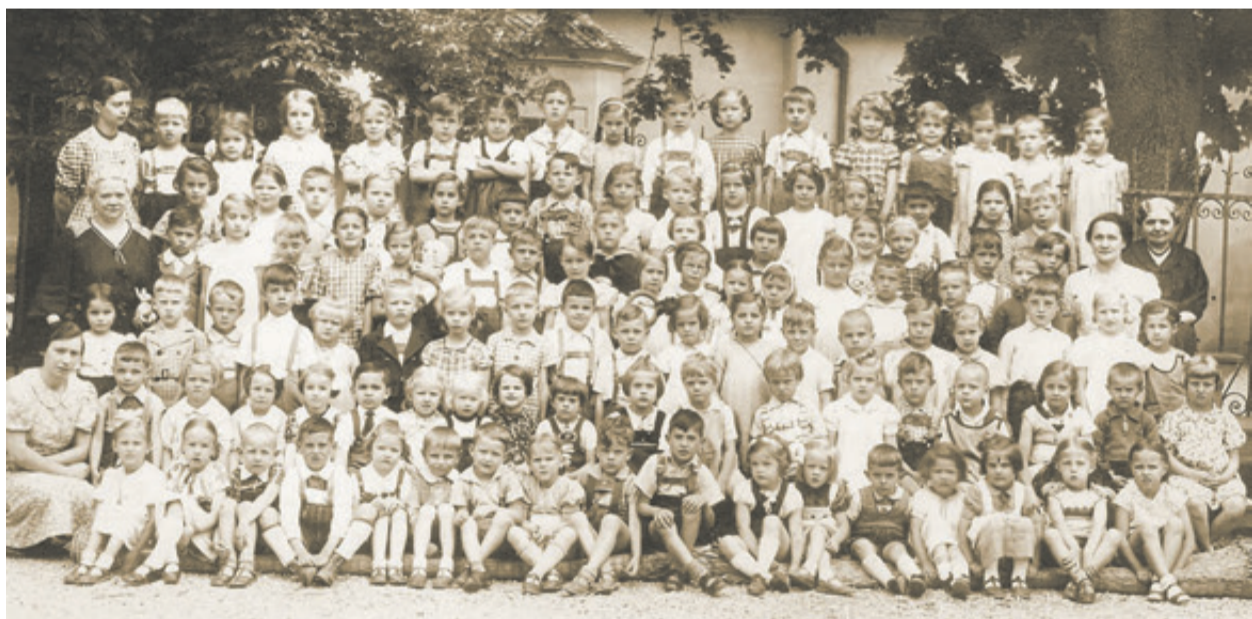
Kindergartenbild der Kinder aus den Jahren 1938-1940.

Unter meinen Unterlagen habe ich herausgesucht, wie viele