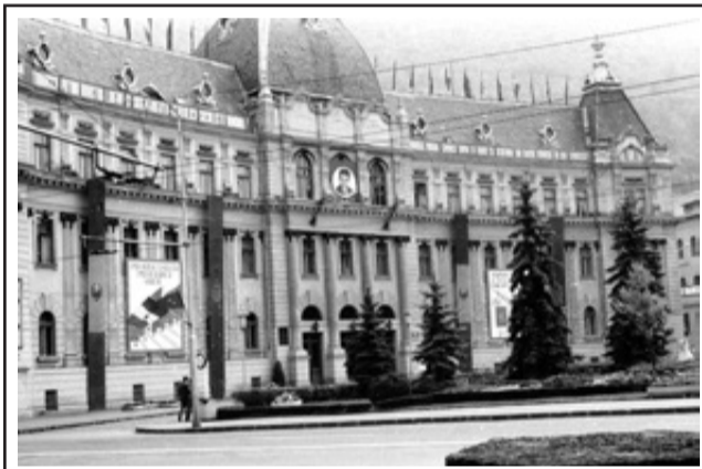
Kronstadt, geschmückt, vor 26 Jahren zu Ehren des „23. August (Libertate ne-a adus)“ 1989.

Abschließen möchte ich mit einer Formulierung aus dem Babylonischen Talmud: „Verurteile deinen Nächsten nicht, bevor du nicht in der gleichen Lage warst.“ Peter Paspas, Schopfheim. 2015