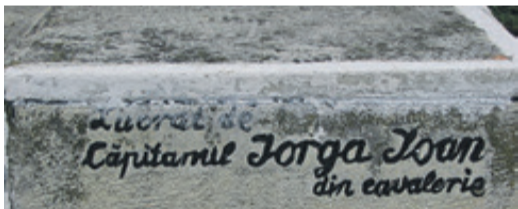
Die neue Inschrift.

Aus dem Bemühen heraus, als geschichtlicher Laie den Versuch zu unternehmen, Geschichte zu verstehen, stoßen wir wiederholt auf eine Konstante, die uns in unserem Bemühen immer wieder aufs Neue begegnet. Die, wie auch immer eingefärbte Darstellung geschichtswürdiger Ereignisse durch den jeweiligen Schreiber. Unzweifelhaft unterliegen wir hier einer Fehleinschätzung. Dem Glauben, es gäbe eine, die richtige Geschichte. Den Ausführungen aus-