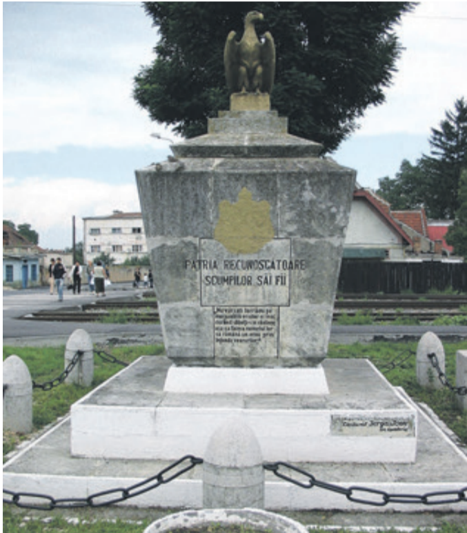
Denkmal am Heldenfriedhof in Bartholomae.