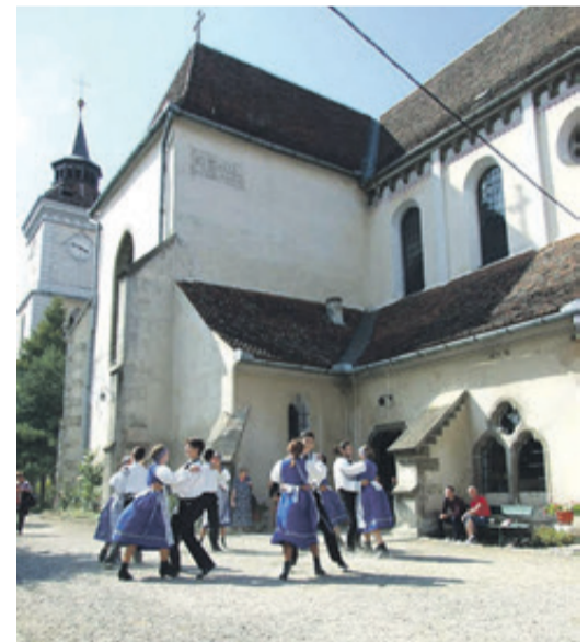
Die Zeidner Tanzgruppe bei ihrem Auftritt.