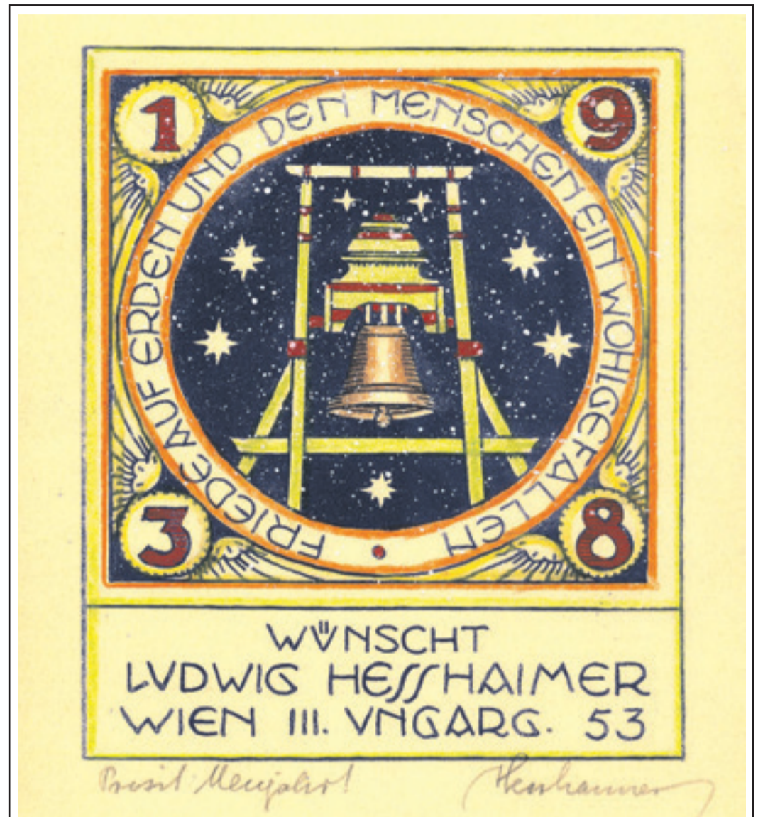
„Friede auf Erden und den Menschen ein Wohlgefallen.“ (Lk. 2, 14). Handkolorierte Neujahrskarte, die Ludwig Hesshaimer seinen Freunden zum Jahreswechsel 1937/38 schickte (darunter mit Bleistift die Signatur des Künstlers).

Welche Quelle nun im Recht ist, mögen Andere später mal untersuchen. Entscheidend war und ist, daß Praeses Immer die Anfragen und Bitten, die ihn aus Siebenbürgen erreichten, nicht weitergereicht oder auf die lange Bank geschoben oder sich ihnen