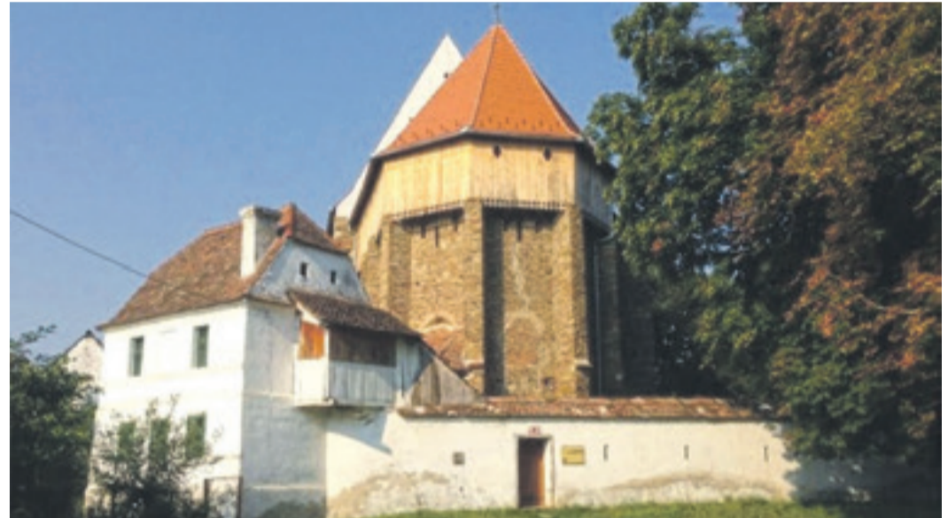
Halb Gotteshaus, halb Burg: Die Andreaskirche in Henndorf konnte wehrhaft sein.