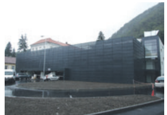
Das neue Kronstädter Parkhaus wurde auf dem ehemaligen Parkplatz zwischen Militärspital und Star-Kaufhaus errichtet.

Das erste Kronstädter Parkhaus, das im Stadtzentrum neben dem Militärspital und dem Star-Kaufhaus errichtet wurde, steht kurz vor seiner Eröffnung. Anwohner hatten sich vor Baubeginn durch Eingaben an das Bürgermeisteramt und auch Protestaktionen gegen das Projekt geäußert. Gründe dafür waren, dass den Häusern aus dem Umfeld die Sicht auf die Stadt genommen wird und dass die Gefahr möglicher Erdrutsche besteht, was die gesamte bebaute Umgebung betrifft. Trotzdem wurde dieses Projekt durchgeführt, wobei einige der Beanstandungen der Anwohner teilweise doch berücksichtigt wurden, besonderes was die Konsolidierung des Geländes betrifft. Es bleibt nur zu hoffen, dass keine unvorhergesehenen negativen Einwirkungen mit der Zeit doch auftauchen werden.