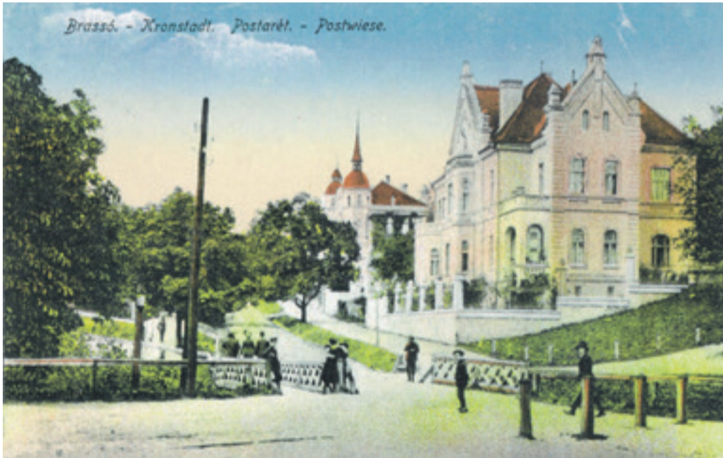
Postwiese mit den herrschaftlichen Villen, Postkarte um die Jahrhundertwende.

Im Norden der Postwiese liegt der große katholische Friedhof von Kronstadt (es gibt auch noch kleinere) und der jüdische Friedhof (eigentlich sind es wegen der Glaubensrichtungen zwei).