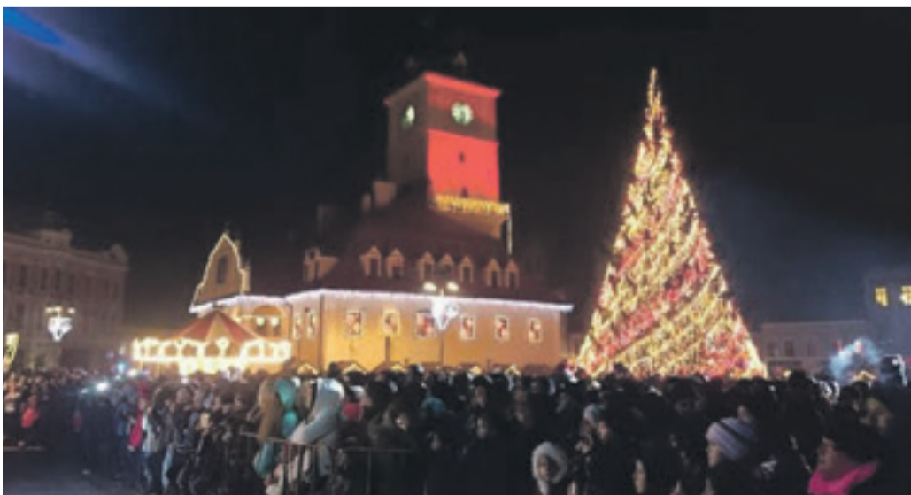
Zahlreiche Besucher aus Nah und Fern bestaunten die festliche Beleuchtung.