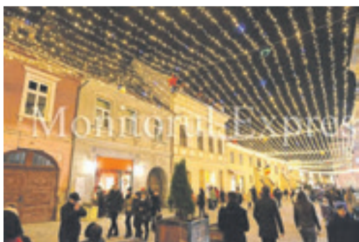
Die beleuchtete Michael-Weiss-Gasse.