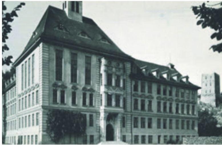
Das deutsche Honterusgymnasium wurde 1913 eingeweiht, im Hintergrund der Schwarze Turm.