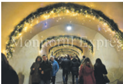
Im Dunklen Gang.