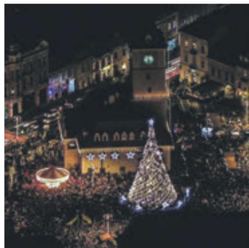
Marktplatz mit beleuchtetem Rathaus.