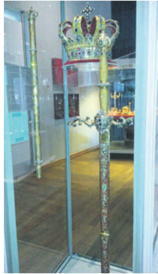
Die Kroninsignien mit dem Zepter (links).