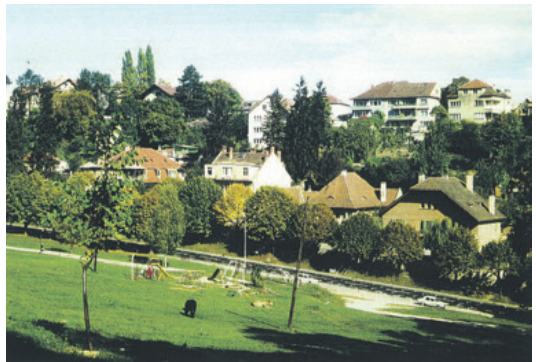
Die heutige Postwiese.

Nach der Zufahrt zur Villa Stirbei führte ein Hohlweg zum Gespreng, wohin das Denkmal des sowjetischen Soldaten aus dem Park nach der Wende von 1989 verlegt worden ist. Kurz vor der Zufahrt beginnt die Schützgasse und von dieser zweigt die Cloșca Gasse nach links ab. Die Schützgassen erhielten nach 1918 die Namen der Führer vom Bauernaufstand Horia, Cloșca und Crișan. Die Graft, floss aus der Vorstadt kommend „Hinter der Graft“ und entlang des ungarischen Gymnasiums und der Wiesenzeile in die Langgasse und, bis etwa 1920-30