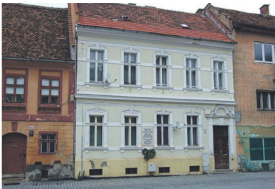
An diesem Haus am Rosenanger (Piața Enescu) Nr. 8 wurde die Gedenktafel für Valentin Greff Bakfark enthüllt.