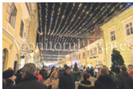
Die weihnachtliche Purzengasse 2015.

Bilder aus dem winterlich-verschneiten Kronstadt, aufgenommen am Nikolaustag 2015. Die Festbeleuchtung lässt die Innenstadt Kronstadts im Lichtermeer erstrahlen.