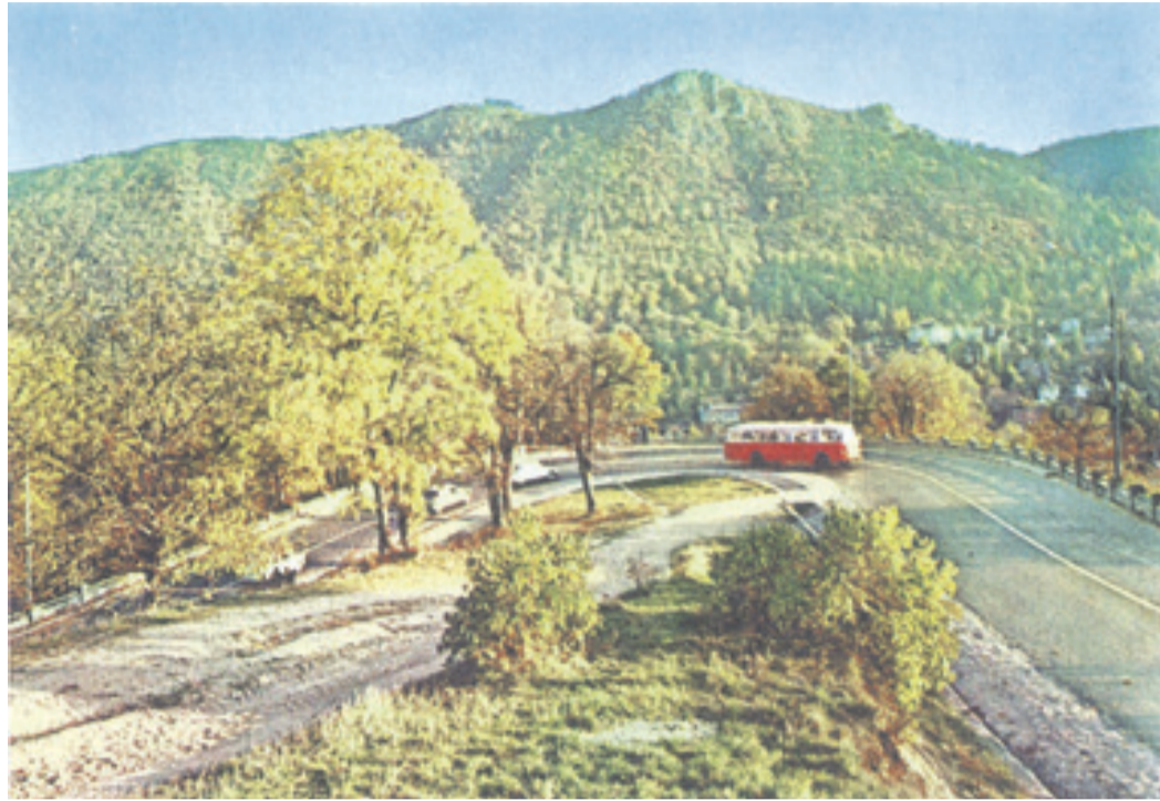
Der Bus fuhr ab den 60er Jahren den Weg über die Postwiese in die Schulerau.

das aus Holz geschnitzte Denkmal eines ungarischen Honvedsoldaten im Beisein des ungarischen Königs und seiner Frau Zita „benagelt“ werden. Dazu kam es aber nicht mehr, denn im Dezember