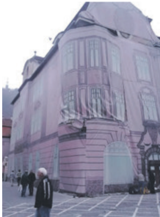
Noch ist das Gebäude durch eine Bau-Kulissenplane bedeckt.

Das Schloss das Bürgermeisteramt Kronstadts. Das Gebäude zählt zu den wenigen Bauten dieses Stils in ganz Siebenbürgen. Geplant ist vorläufig die Instandsetzung des Daches und der Vorderfront. Das Gebäude diente bis 1929 als Sitz der Sächsi-