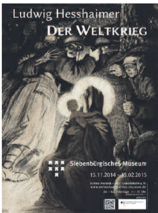
Plakat zur Ausstellung über den „Totentanz“ von Ludwig Hesshaimer im Siebenbürgischen Museum Gundersheim.

Ludwig Hesshaimer , geb. 1872 (Kronstadt) gest. 1956 (Rio de Janeiro), der Künstler im Soldatenrock, war der produktivste unter den siebenbürgischen Darstellern des Ersten Weltkriegs, an dem er von Anfang bis Ende teilnahm. Er habe den Krieg