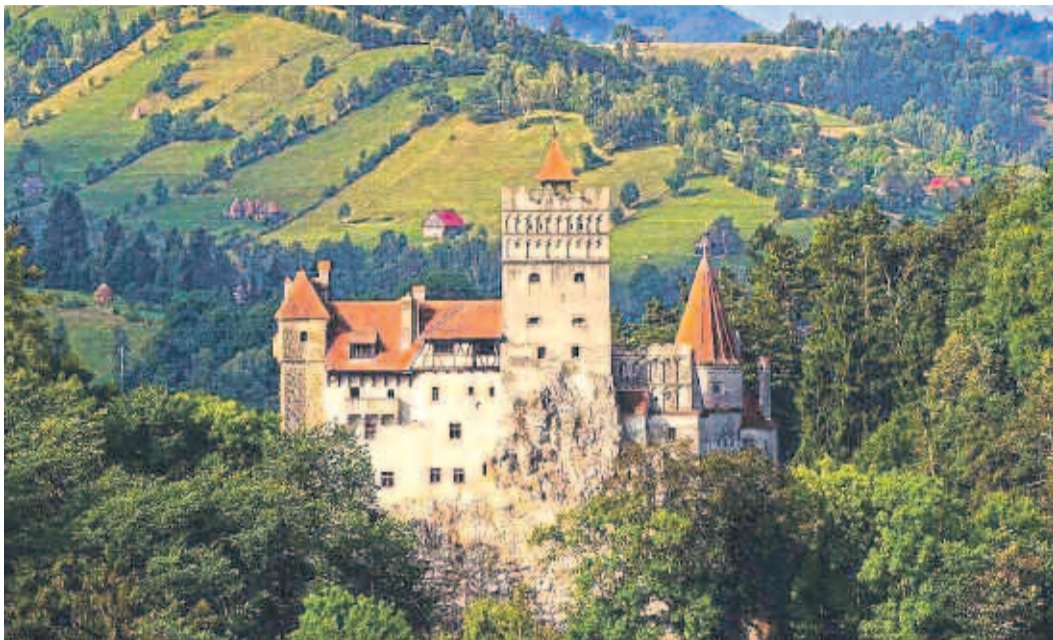
Blick auf die Törzburg, 2016, anlässlich des Besuches von Dominic von Habsburg-Lothringen. Erschienen in „Buna ziua Braşov“ vom 23. Mai 2016.