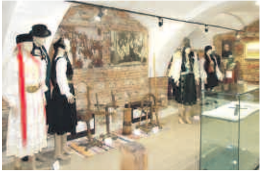
Blick in einen der Museumräume. Im Vordergrund in der Glasvitrine das Schwert aus dem 13. Jahrhundert.

Freitag, der 13. Mai 2016, ist ein Tag, der sicher auch in die Jahrhunderte alte Geschichte von Zeiden eingehen wird. Denn dieses ist der Stichtag für die Geburt eines städtischen Museums in dieser Ortschaft, deren urkundliche Erwähnung auf das Jahr 1377 als Cidinis fällt, und danach u. a. unter Benennungen wie Cydinium, Zidinium, Zeidinium, Czeyden in Urkunden anzutreffen ist. Eben diese Geschichte, das Zusammenleben von Sachsen, Rumänen, Ungarn in dieser Ortschaft, die gute Gemeindeverwaltung in den verflochtenen Jahrhunderten, Persönlichkeiten, sollen im an diesem Festtag eröffneten