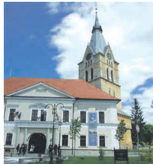
Das Museum der Zeidner Traditionen ist neuer Anziehungspunkt der Stadt.

Nachdem das Band zwischen Eingang und dem bis zum Zeitpunkt eingerichteten sächsischen Teil