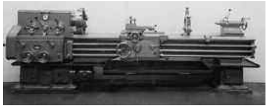
Die in der Maschinenfabrik Schiel erzeugten Werkzeugmaschinen waren gefragt. Die hier gebauten Schiel-Drehbänke, ein Serienprodukt, wurden laufend dem technischen Fortschritt angepasst. Auf dem Bild das letzte Modell einer Schiel-Drehbank für Werkstücke bis 2 000 mm Länge.