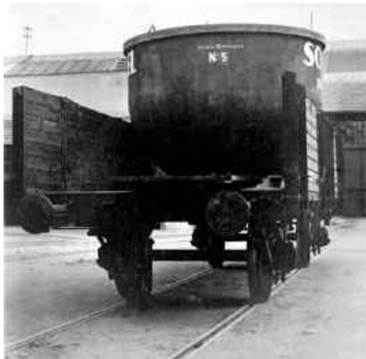
Ein Spezial-Grauguss-Kessel für die Solvay Soda-fabrik, von 2,6 m Durchmesser und etwa 15 Tonnen Gewicht, ist bereit zum Abtransport aus der Maschinenfabrik.

Maschinenfabrik Schiel hervorhoben. So fehlte der Begleittext zu den beiden Bildern unten: