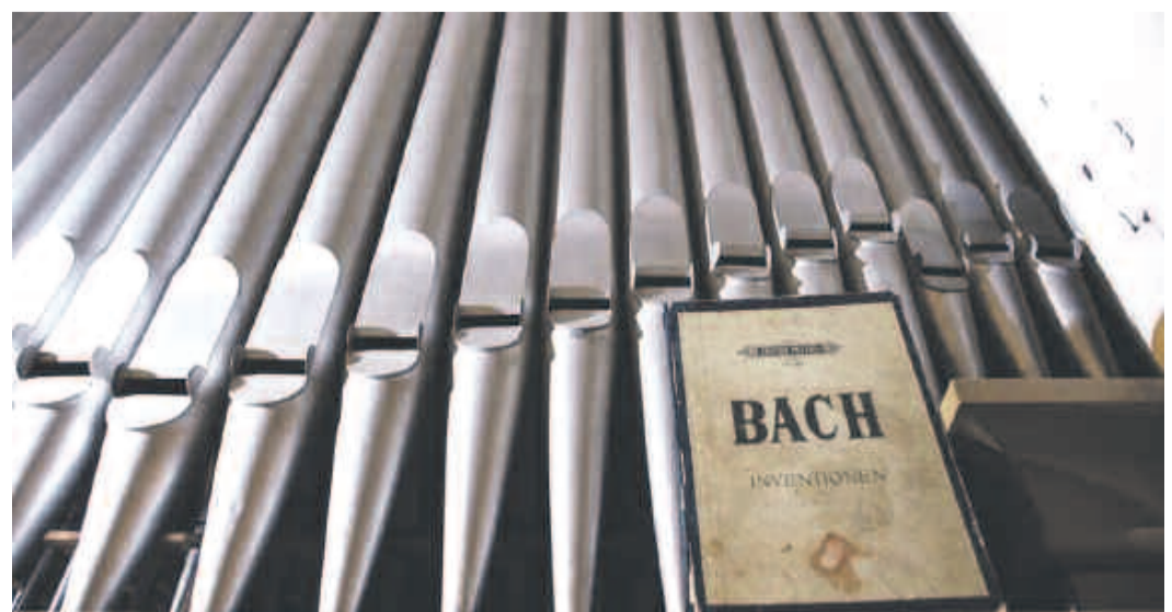
Eine der von Karl Einschenk gebauten Orgeln befindet sich in der Blumenauer Kirche in Kronstadt in sehr gutem Zustand.

http://revistasinteza.ro/einschenk-umple-tran-silvania-de-sunet-de-120-de-ani-neintrerupt/