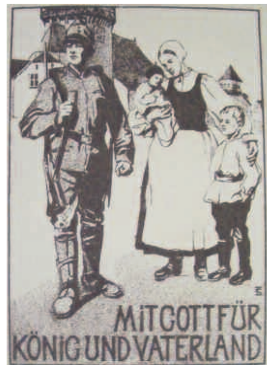
Trude Schullerus: Trennung

Die einen schilderten unmittelbar Erlebtes, während die anderen Werke zum Verkauf schufen, aus deren Erlös Kriegswitwen und -waisen unterstützt wurden (wie beispielsweise die Postkarten von Trude Schullerus und Margarete Depner ). Auch nach Ende des Krieges lebte dieses große Thema in der Seele der Künstler weiter.