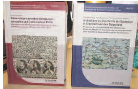
Die beiden Forschungsbände können in Bibliotheken und den beiden Archiven eingesehen werden.