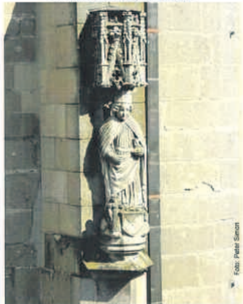
Kronstadt - Ostern 2016 Nr. 31