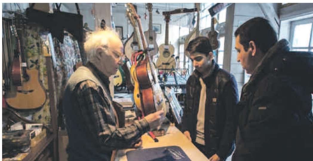
Ich bin hier geblieben, wo es viele Menschen gibt, die mich brauchen

angekommen, in dem die Familie gezwungen wurde in die Handwerksgenossenschaft einzutreten. „Aus der Wohnung hatte man uns hinausgeworfen und wir