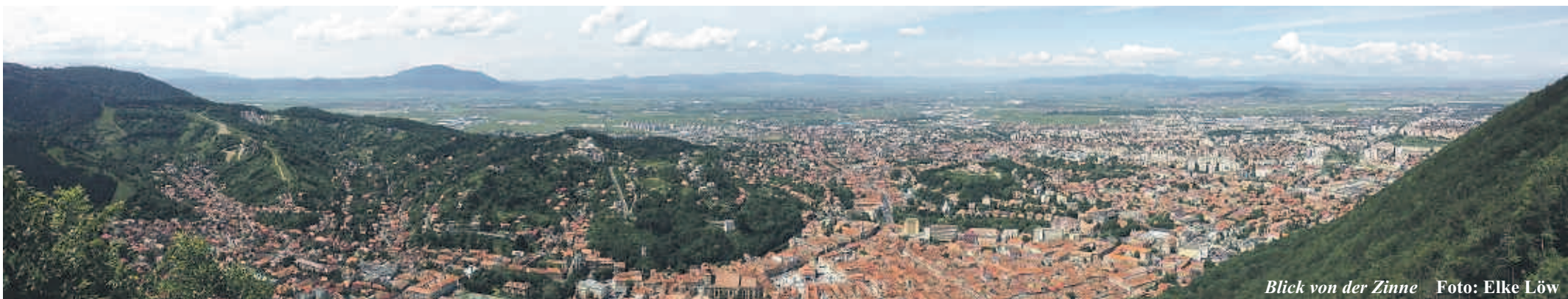
Blick von der Zinne