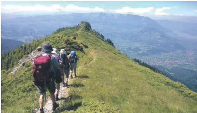
Auf dem Clincea-Kamm, Blick über Bran und Măgura zum Königstein.

Direkt am Waschplatz der Hütte beginnt der zunächst dreifach markierte Weg zur Șaua Crăpăturii (gelb, roter Punkt, blauer Punkt) als netter Zickzackweg durch den Fichtenwald. Ab der aussichtsreichen Șaua folgen wir dem roten Punkt hinauf zum Turnu-Gipfel. Aus unserem gemütlichen Wanderpfad wird bald ein ausgewachsener, ausgesetzter, mit Drahtseilen gesicherter Klettersteig, nur für absolut schwindelfreie, trittsichere und kräftige Wanderer geeignet, weniger für Normaltouristen oder „Trekker“ mit schwerem Rucksack. An einer Stelle gibt es kaum einen Tritt, man muss sich am Drahtseil hochziehen! Die Belohnung auf dem Gipfel besteht in einer umfassenden Rundschau ins Burzenbachtal, ins Burzenland und auf alle Gebirgsgruppen im Kronstädter Gebiet. Der Weiter-