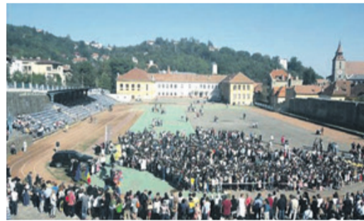
Feierliche Eröffnung in der Arena.