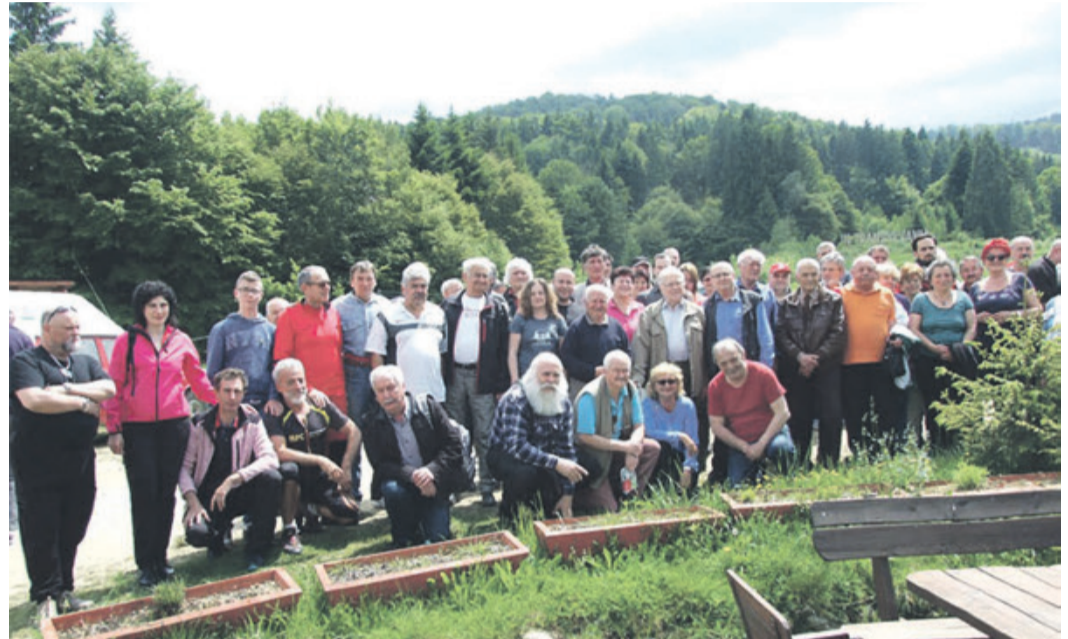
Rund 60 Teilnehmer kamen in Drăgăș zur SKV-Vollversammlung.

Um die Vereinstätigkeit zu erleichtern, um Fördergelder mit mehr Erfolgsaussichten zu beantragen,