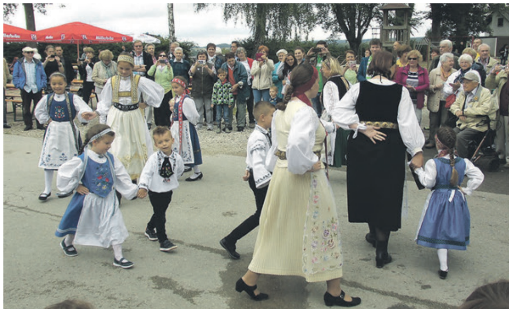
Die Jugendtanzgruppe Ingolstadt/Manching erfreute die Besucher des Honterusfestes.

Postvertriebsstück – Gebühr bezahlt Verlag Neue Kronstädter Zeitung, Alfonsstr. 2, 85551 Kirchheim Adressänderungen, die unregelmäßige Zustellung zur Folge haben können, bitten wir dem Verlag mitzuteilen.