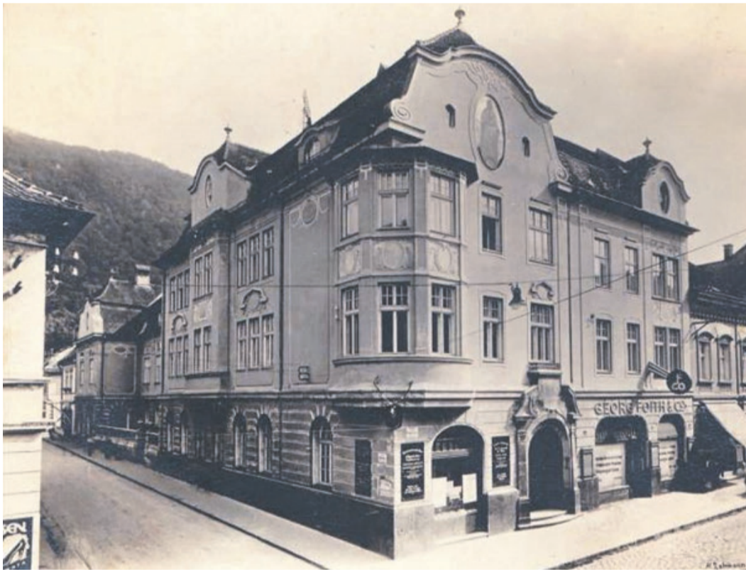
Ansicht der Sächsischen Bank vor dem 2. Weltkrieg.

Aus: „BIZ BRASOV“, vom 21. August 2017 von Ionuț Dincă, gekürzt und übertragen von Bernd Eichhorn.