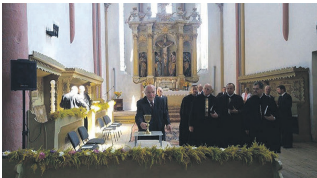
Der Kelch gehört nun wieder der Bartholomäer Gemeinde.