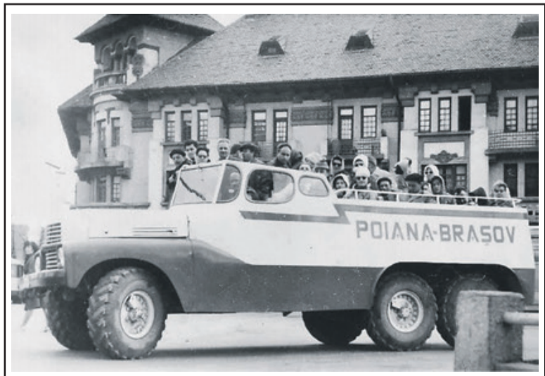
Mit diesem Fahrzeug fuhr man viele Jahre den „Alten Weg“ in die Schulerau hoch. Aus heutiger Sicht ein sehr abenteuerliches Unterfangen.

So wie wir bei der Ausreise die Gräber unserer Vorfahren zurücklassen mussten, geschah das auch zwangsweise mit unserem schönen Kronstadt und seiner wunderbaren Umgebung, an die ich hiermit erinnern wollte. Wir nahmen jedoch die Erinnerung nach Deutschland mit.