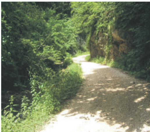
Eine Klamm, wo man sie eigentlich nicht erwartet hätte.

gegebene Markierung taucht erst später auf. Stellenweise ist die Markierung spärlich und man muss aufpassen, die letzte Strecke des Abstieges ins Tal