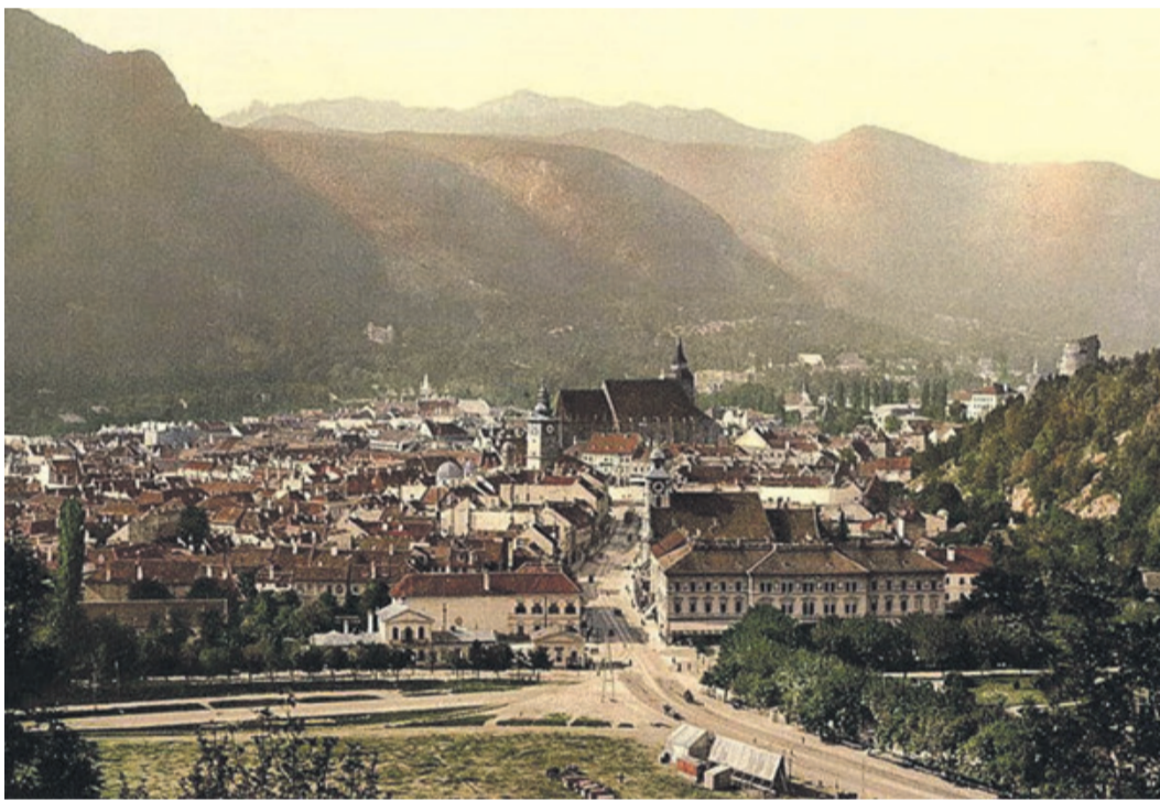
Kronstadt vom Schlossberg aus gesehen: von der Bildmitte aus führt die Strecke in Richtung Schwarze Kirche bis auf den Rossmarkt, rechts nach unten in die Langgasse bis nach Bartholomä und nach links, an der Baumreihe vorbei, entlang der „Promenade“ stadtauswärts bis nach Siebendorfer.