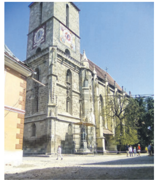
Der Zugang zur Schwarzen Kirche: Bei gutem Wetter eine Zier, bei schlechtem Wetter eine Qual.

Vor drei Jahren übernahm die Stadt den Kirchhof von der Evangelischen Kirchengemeinde, um eine Europäische Finanzierung für die notwendigen Rehabilitierungsmaßnahmen zu beantragen. Als Geberländer für die veranschlagten 9,8 Millionen Euro waren Norwegen, Island und Liechtenstein vorgesehen.