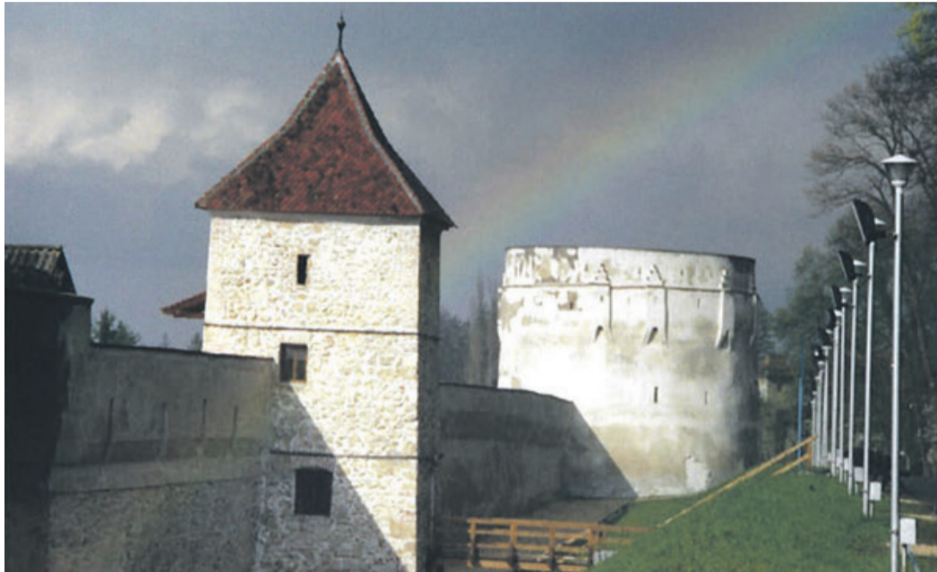
Kronstädter Wehranlagen unter dem Regenbogen.

Das Bürgermeisteramt sieht sich jedoch für die alten Stadtmauern, die Basteien und Wehrtürme nicht allein zuständig. Laut Sorin Toarcea, Pressesprecher der Institution, können die Lokalbehörden vorläufig nichts für die Wartung der Stadtmauern, Basteien und Wehrtürme unternehmen, weil diese in den Akten als zur öffentlichen Domäne des Kreises Kronstadt gehörend geführt werden. 2012 hatte