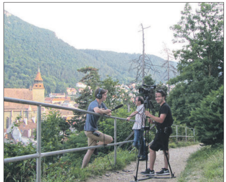
Die jungen Filmemacher drehen in der Nähe des Weißen Turmes.