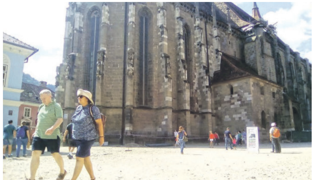
Der Kirchhof: unbefestigt wie im Mittelalter, hoffentlich kein Dauerzustand?