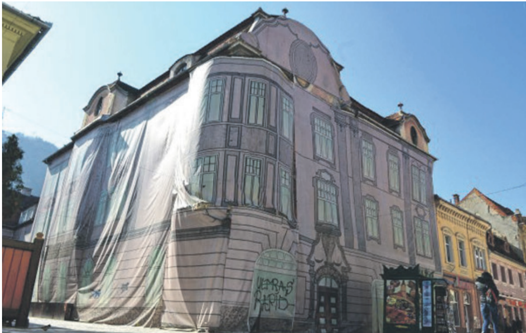
Seit Jahren bietet das Gebäude einen traurigen Anblick.

„Monitorul Expres“, vom 23. Juni 2017 von M.P. übertragen und zusammengefasst von Bernd Eichhorn.