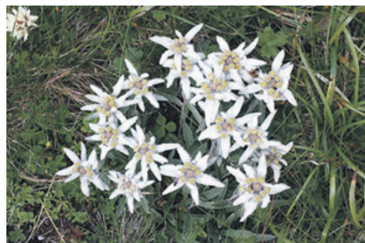
Edelweiß im Mălăiești-Tal