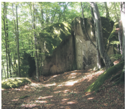
Massive Sandfelsen als „Götzentempel“.