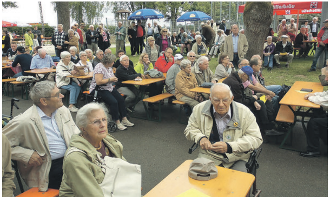
Die zahlreichen Besucher lauschen der Quellenrednerin zu.