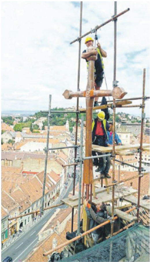
Unter großem Kraftaufwand wurde das neue Kreuz befestigt.