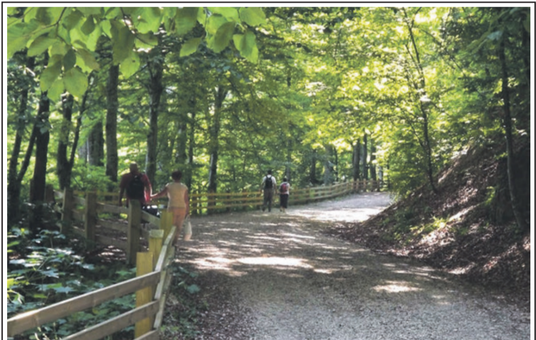
Der „Alte Weg“ in die Schulerau ist für jung und alt eine Möglichkeit dem Alltag der Stadt für ein paar Stunden zu entfliehen.