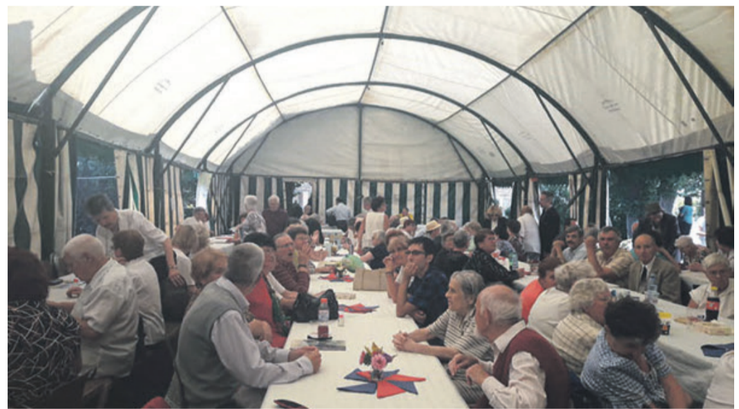
Gemeinsam wurde im Festzelt bis spät in den Nachmittag gefeiert.