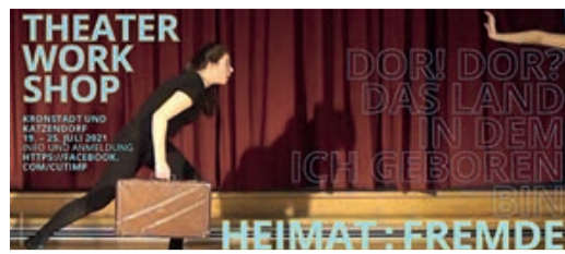
Bildungsprojekt – Theaterworkshop – Film

Aus: „ Transilvania Express “, vom 29. Juni 2021, von Raluca Olteanu, übersetzt und gekürzt von Uta Schullerus