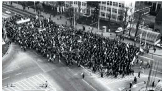
Historische Aufnahme der antikommunistischen Revolte in Kronstadt.

Am 22. Juli hat Präsident Klaus Johannis das Dekret zum Gesetz unterschrieben, nachdem der 15. November zum Tag der Antikommunistischen Revolte des Jahres 1987 erklärt wird.