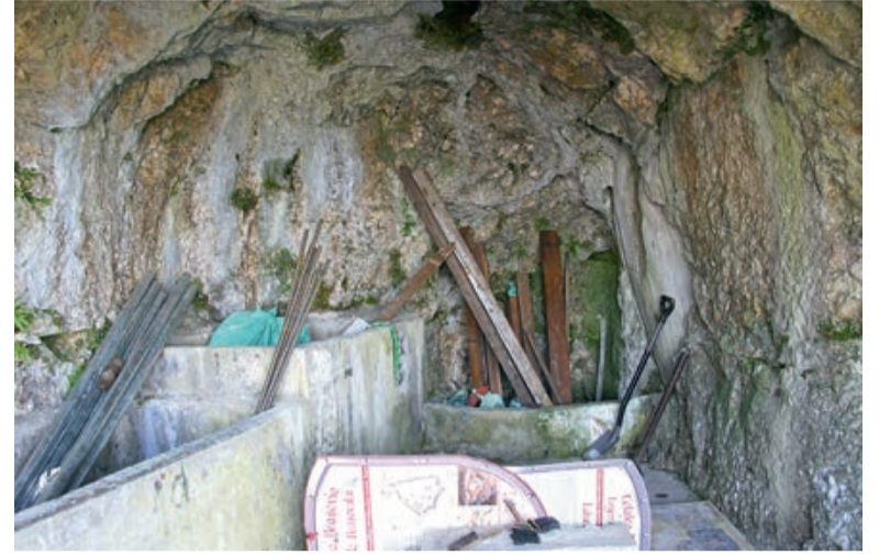
Die Bethlen-Grotte heute ...

Auch er machte sich auf und kam zu der Aus-