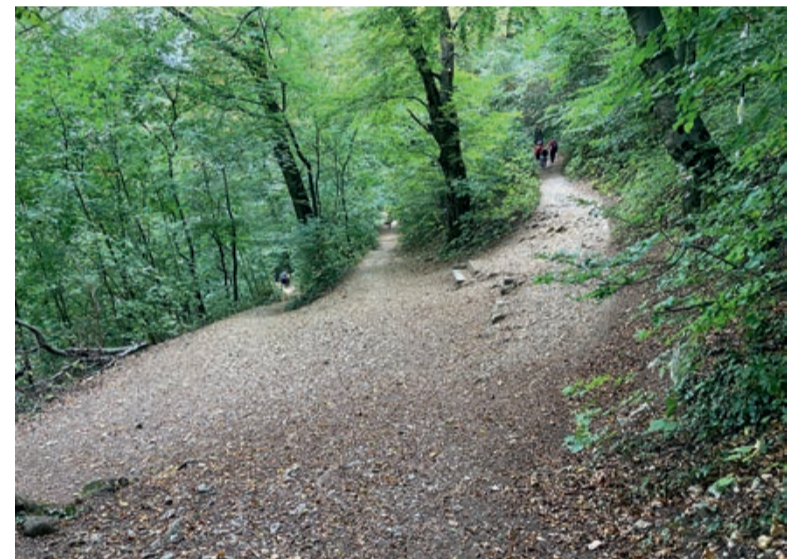
Der Anfang des Felsenweges.

F. hatte interessiert zugehört, ohne den Mann zu unterbrechen. Jetzt wollte er doch wissen, wie das im Einzelnen weiterging bis zur Revolution Ende