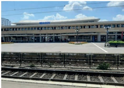
Der Kronstädter Bahnhof – einst der Stolz der Stadt.

Zur Zeit seiner Fertigstellung wurde dem Bahnhof attestiert, einer der schönsten in Rumänien zu sein,