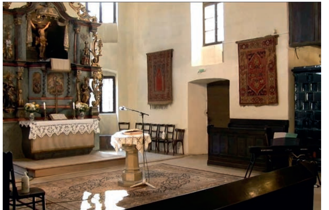
Was ist das Besondere an diesem Altar?