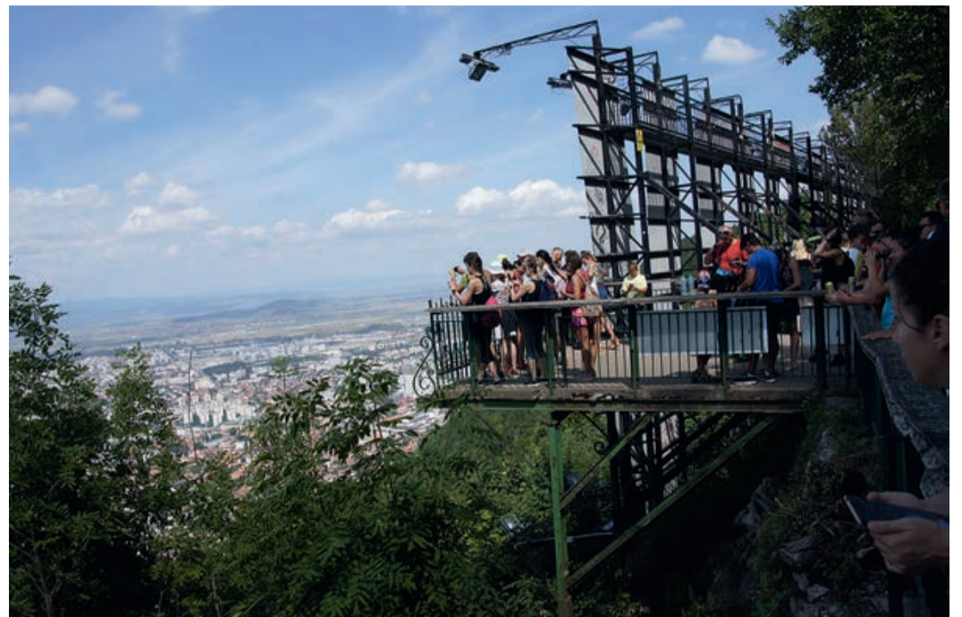
Aussichtsterrasse auf der Zinne.