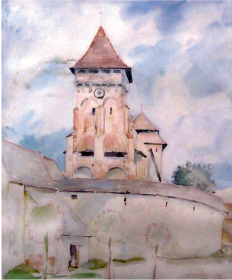
Helfried Weiß, Kirchenburg Wurmloch (Aquarell, 1955)