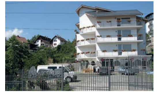
Die Pension „Warthe“.

2003 wurde sie von einem Tourismusenthusiasten als ein wohlverdienter Zufluchtsort angekündigt,