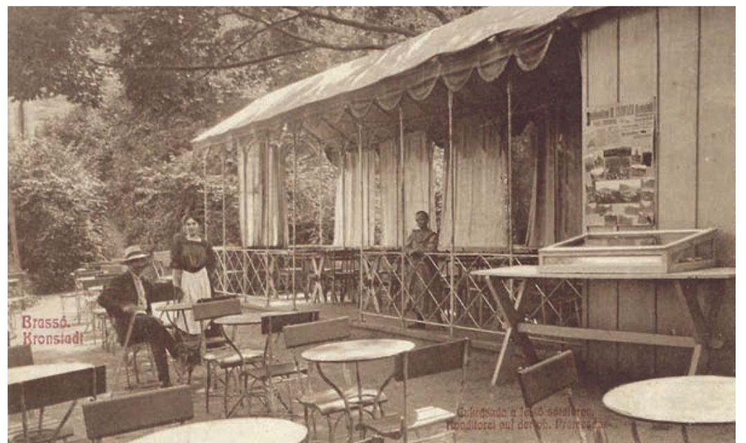
Kronstadt – Caffee an der Burgpromenade