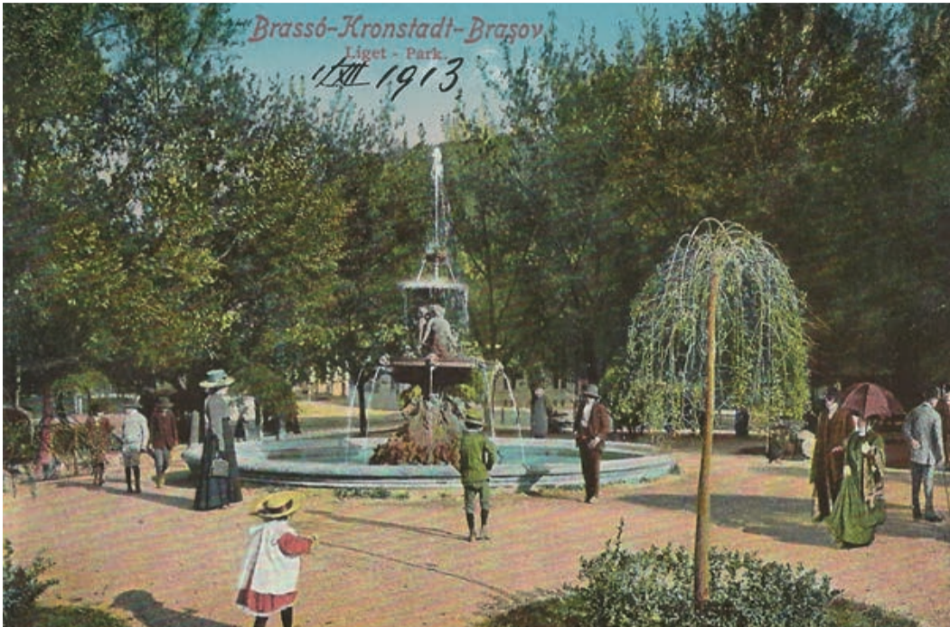
Kronstadt – Rudolphspark