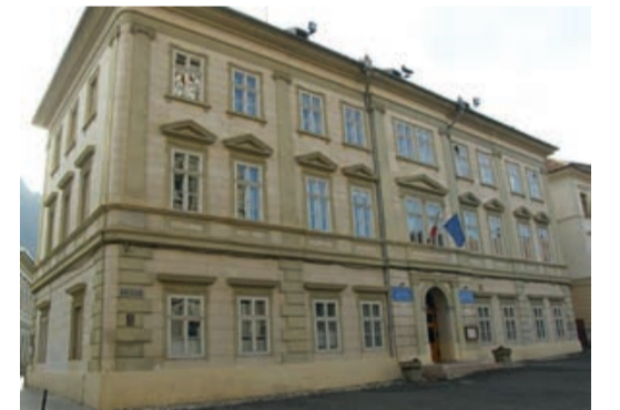
Das Honteruslyzeum in Kronstadt.