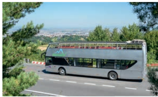
Ein Doppeldeckerbus fährt im Sommer in die Schulerau.

Ab 3. Juli setzt die Kronstädter Verkehrsregie RATBV ihren Doppeldeckerbus für Fahrten in die Schulerau ein. Der Bus fährt von 9.20 Uhr bis einschließlich 18.20 Uhr stündlich von der Postwiese in die Schulerau. Die Rückfahrten sind zwischen 9.50 Uhr und 18.50 Uhr vorgesehen. Der Busverkehr nur an den Wochenenden und an gesetzlichen Feiertagen und nur wenn günstige Wetterbedingungen herrschen. Für die Fahrt mit diesem Sonderbus sind die Fahrkarten zu 6 Lei/Person für den Linienbus 20, der auf derselben Strecke verkehrt, gültig.