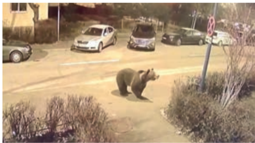
Ein Bär mitten im Wohngebiet von Kronstadt.

„Auf einer Fläche von 12 500 Hektar sollten wir 18 Bären haben. Leider gab es im Frühjahr, als wir die Volkszählung durchführten, bereits 87 Bären auf