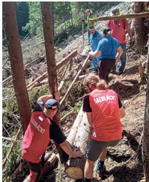
Die Bergretter bei einem Einsatz.

Die Genehmigung dieser Entscheidung ist notwendig, damit die Bergrettungstätigkeit des Dienstes durch den Nationalen Verband der Bergretter in Rumänien (ANSMR) zertifiziert werden kann.