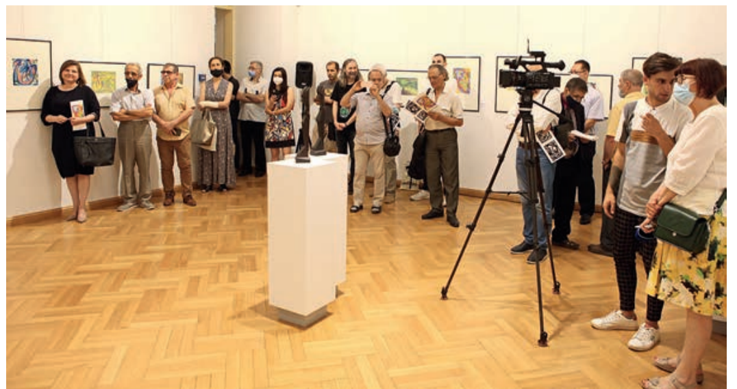
Bild unten: Das Interesse an der Ausstellung war groß, wie die – trotz Pandemie – gute Präsenz bei der Eröffnung zeigt.