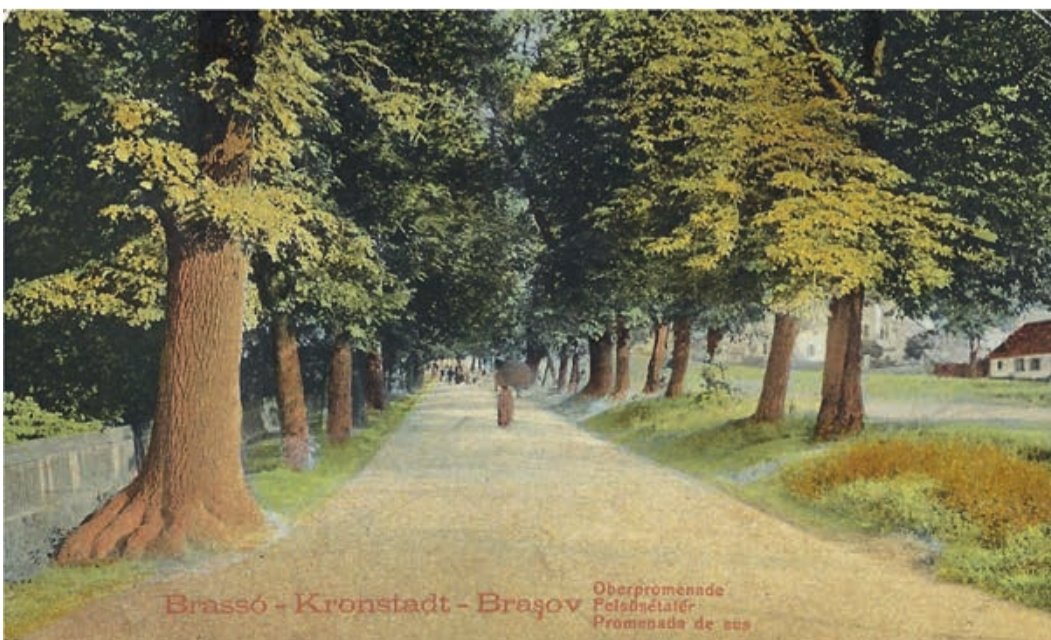
Kronstadt – Obere Promenade

Die Entstehung des Wasserwerks ist auch der Grund, dass der „Durchbruch“ in die Stadtmauer gelegt wurde. Er diente einem schnelleren Zugang aus der Stadt zu dem Wasserwerk. Eduard Gusbeth (1839-1921, Arzt, Medizinhistoriker und Heimatforscher) hat zu diesem Zweck sein an der Stelle befindliches Haus an die Stadt verkauft, damit der „Durch-