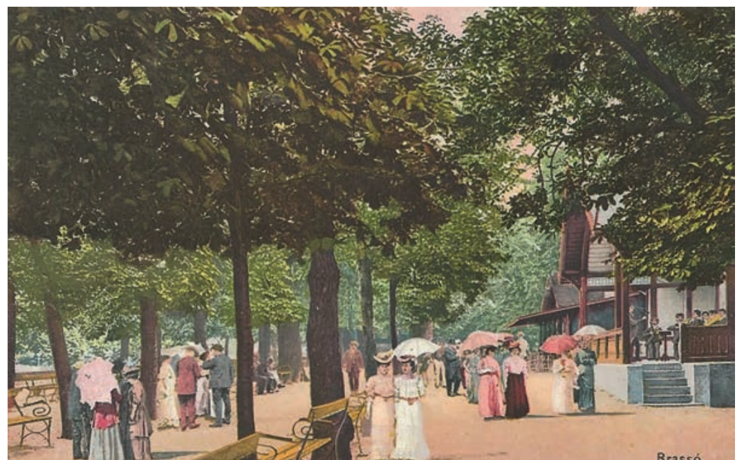
Kronstadt – Untere Promenade mit dem Musikpavillon und dem Caffee- und Erfrischungshaus.