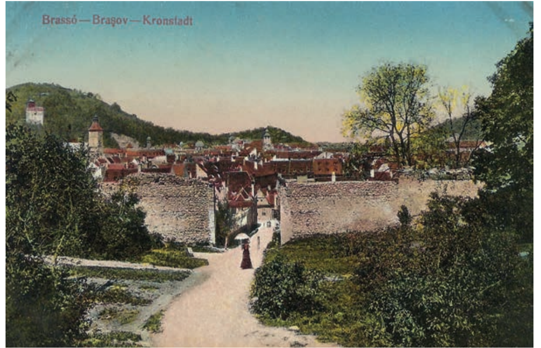
Kronstadt – Burgpromenade mit Durchbruch. Dadurch entstand der Burgsteig.

Knechten vorbehalten. Im Pavillon spielte das Stadt-Orchester oder die Militärmusik. Davor spazierten mit langsamen Schritten die blonden Sächsinen und brünetten Rumäninnen, die neben dem Pavillon stehenden Studenten, kaum eines Blickes würdigend, aufmerksam aber zu den Offizieren, in ihren neuen schmucken Uniformen, blickend (Sextil Pușcariu: Braşovul de altădată (Kronstadt einst), Klausenburg 1977. Aus dem Rumänischen in freier Übersetzung).