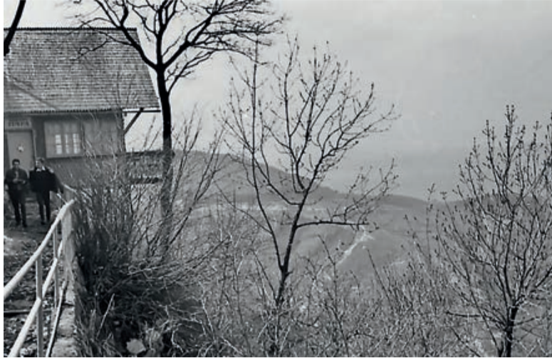
Die Bethlen-Grotte damals ...

werden, das brachte tausende auf die Straße und ab dann waren die Proteste nicht mehr zu bremsen. Am 21. Dezember wollte Ceaușescu eine große Kundgebung halten, um die Menschen zu beruhigen, was aber schiefging. Die Kundgebung wurde im Fernsehen übertragen und kurz nach zwölf hörte man aus der Menge Zwischenrufe, einige klangen wie „Ti-mi-șoa-ra“. Und es wurde immer lauter, so dass er nicht mehr weiterreden konnte und fast schon fle-