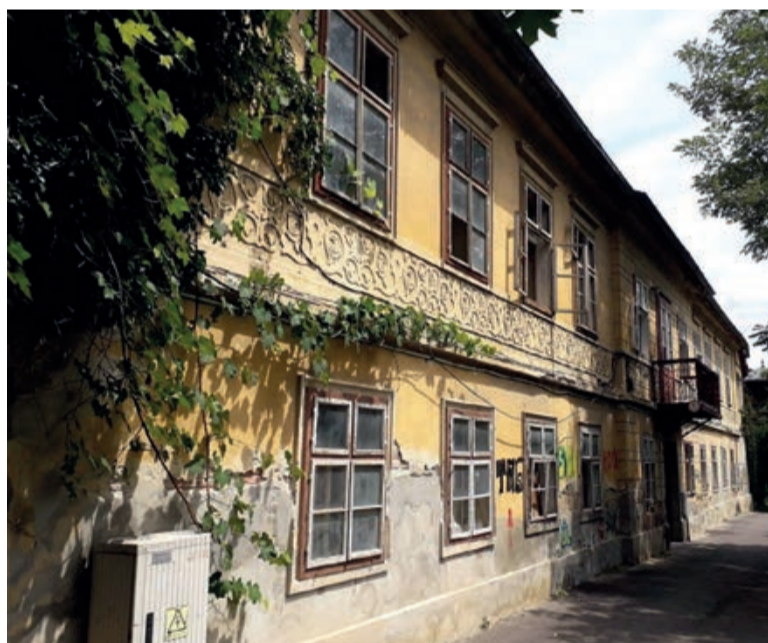
Der Kronstädter Industrielle Martin Copony ließ das Haus auf der Postwiesezeile 1887 erbauen, jetzt ist es eine Ruine. 2

15. Dieser Hinweis bezieht sich nicht auf das Haus Nr. 22, sondern offensichtlich auf die Herkunft des Namens „Postwiese“, auf der ursprünglich die Postkutschenpferde grasten, bevor die Allee zu einer Villenkolonie wurde.