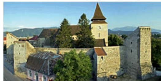
Ostseite der Kirchenburg.

Am folgenden Tag wurde Vater von der Präfektur in Kronstadt darüber informiert, dass er sich von seinem Amt als Bürgermeister Weidenbachs mit sofortiger Wirkung als entlassen zu betrachten habe. Das