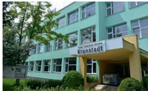
Die „Professionalschule Kronstadt“.

Seit neun Jahren gibt es nun schon diese Ausbildungsart auch in Kronstadt. Im Juli diesen Jahres bietet das Unternehmen Schaeffler 100 Plätze an