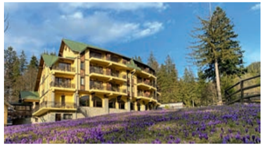
Das ehemalige Hotel „Casa Viorel“ in der Schulerau wurde zur Hotelfachschule.