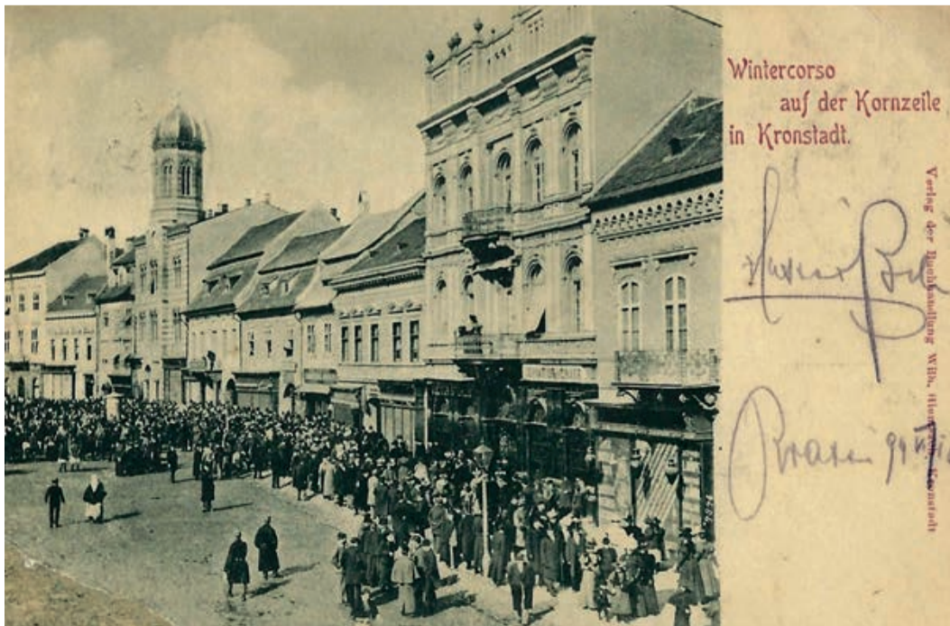
Kronstadt – Das Corso

(Alle hier gezeigten Ansichtskarten stammen aus dem Bildarchiv Sammlung Werner Halbweiss. Bei eingefügten Zitaten wurde die Originalorthografie beibehalten).