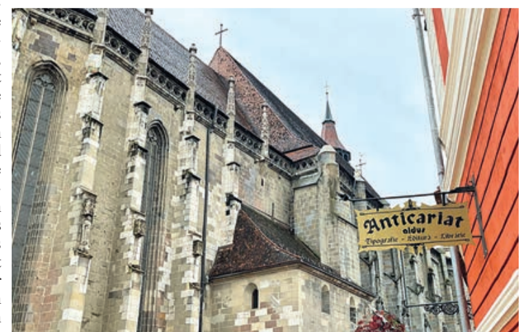
Nur einen Katzensprung von der Schwarzen Kirche entfernt.

Aus: „ADZ“, vom 20. Juni 2021, von Irina Radu