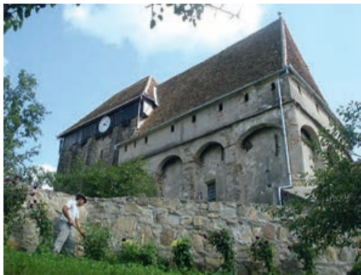
Die evangelische Kirche von Seligstadt.

Konservierungsmaßnahmen der Kirchenburg Großschenk sind 2,8 Millionen Lei zugesagt, von denen 2,6 Millionen nicht rückzuzahlen sind. Großschenk, eines der größten sächsischen Dörfer Rumäniens, wurde im 13. Jahrhundert gegründet (1265 urkundlich erwähnt). In der ersten Hälfte des 16. Jahrhunderts werden gotische Einflüsse sichtbar, im 18. Jahrhundert wurden im selben Stil Ergänzungen durchgeführt. Im Unterschied zu vielen anderen Kirchenburgen sind in dieser zwei Schutzheilige anzutreffen, die Jungfrau Maria und der Heilige Paulus.