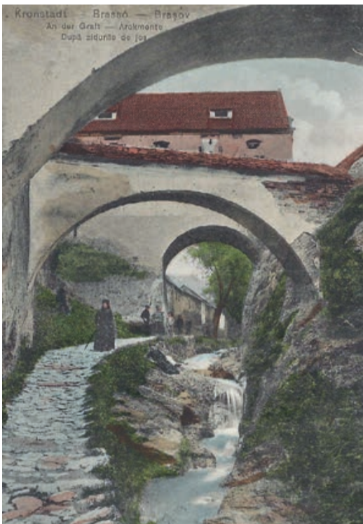
Kronstadt – An der Graft mit der Graftbastei