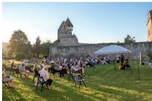
Konzerte bei Tag und bei Nacht.

In diesem Jahr kehrt die dritte Ausgabe des Festivals Musikland zu den Veranstaltungsorten der ersten Ausgabe zurück, es kommen aber auch neue