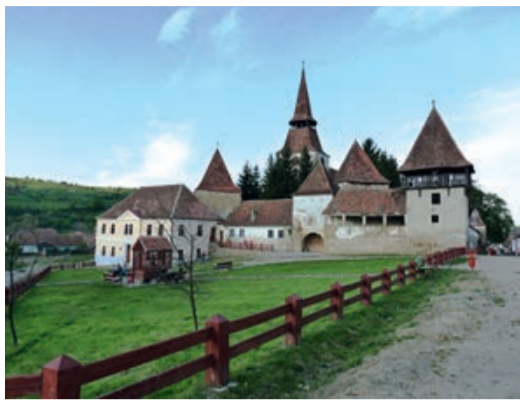
Die Kirchenburg von Großschenk.

Zwei der Kirchenburgen des Kreises Kronstadt, nämlich diejenigen von Großschenk und Seligstadt, sind in den Sanierungsplan des Operationsprogramms der EU aufgenommen. Die Finanzierung ist beschlossene Sache, für die Reparaturen und