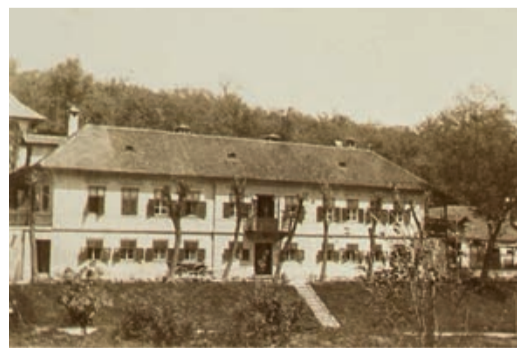
Das Haus Copony (ca. 1910).