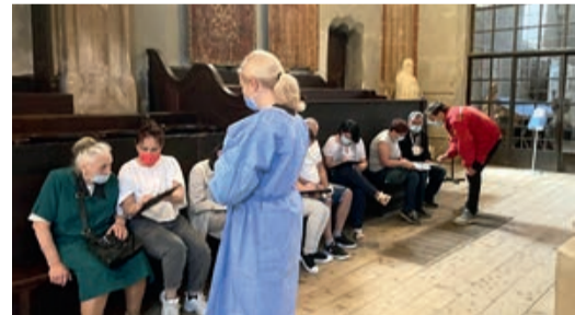
Behutsam werden die Leute auf die Impfung vorbereitet.

Die Sonderimpfaktion gegen das Coronavirus geht in der Stadt unter der Zinne weiter. Wenn bisher impfwillige Kronstädter sich unter anderem beim Theater, in einem Club, beim Schloss Törzburg oder beim neuen Terminal des Flughafens im-