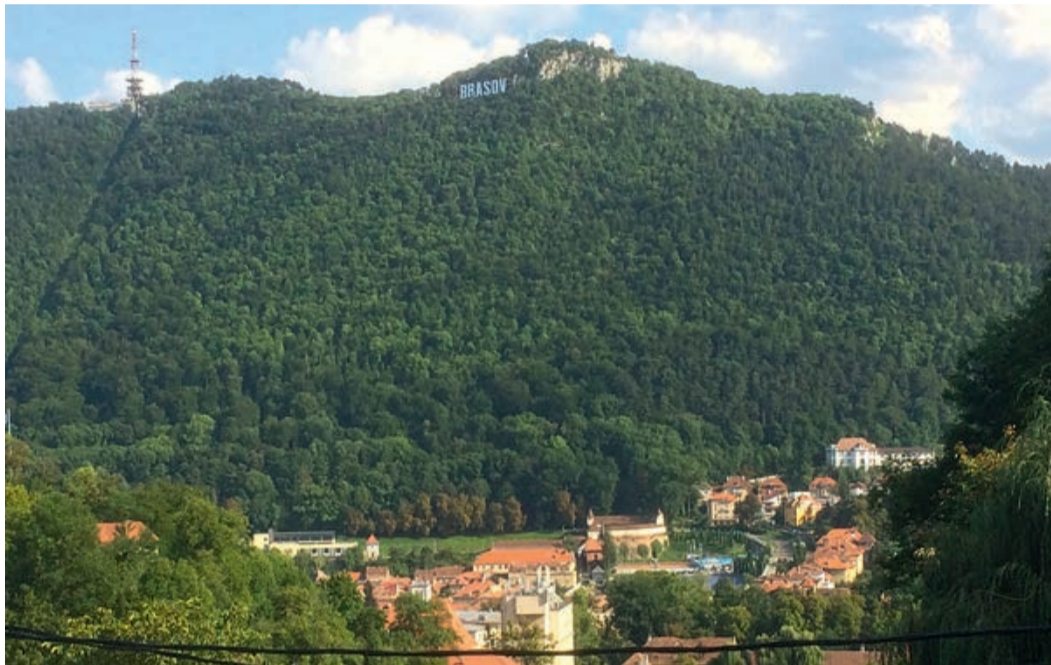
Blick vom Balkon auf die Zinne.