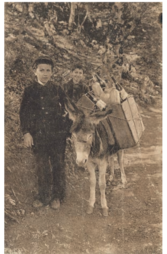
Die Logistik für die Versorgung der Gaststätte mit Lebensmitteln und Getränken.

gegen die Revolutionsarmee unter General Bem, auf der Zinne, um weithin sichtbar zu sein, ein in Form einer Pyramide gemauertes Denkmal, zur sichtbaren Erinnerung an die freundschaftlichen Beziehungen zwischen dem österreich-ungarischen Imperium und dem russischen Zarenreich. Durch Witterungseinflüsse im Laufe der Zeit zerstört, wurde durch die Communität 1869 der An-