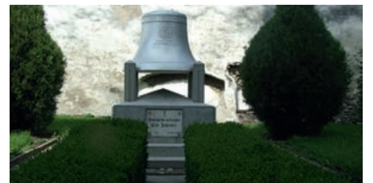
Denkmal für die Deportierten

Gleich nach dem Sturz des Kommunismus wurde am 8. Januar 1990 das Demokratische Forum der Deutschen im Kreis Kronstadt gegründet und folgte somit dem Aufruf des am 28. Dezember 1989 gegründeten Landesforums. Dabei wurde auch das provisorische Lenkungs-Komitee gewählt. Die ehemaligen Russlanddeportierten, Mitglieder des Forums ebenso wie Nichtmitglieder, wurden am 4. April 1990 zu einer Vollversammlung in die Aula der Honterusschule eingeladen, es wurde der Verband der Russlanddeportierten im Kreis Kronstadt gegründet. Als Vor-