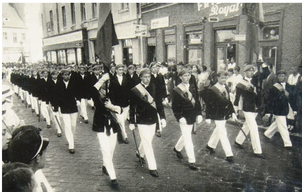
Honterusfest 1935: Der Coetus der Honterusschule in der traditionellen Festkleidung folgt im Festzug gleich nach der Gruppe der Würdenträger.

Je größere Ausmaße das Honterusfest im Laufe der Jahre annahm, je mehr es zu einer im Jahrestakt wiederholten eindrucksvollen Bekundung des Zusammenhalts der Kronstädter Sachsen wurde, desto mehr Misstrauen brachten die Behörden dieser Manifestation ethnischer Selbstbehauptung entgegen.