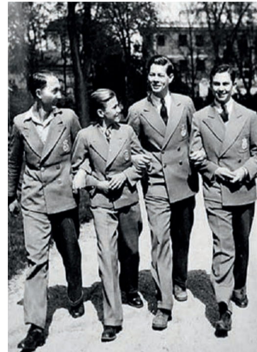
König Michael I. von Rumänien (3. von links) mit seinen Mitschülern am Sfântul Sava Kolleg in Bukarest.

Dafür nutzten sie die Sommerferien und knapp zwei Monate nach Schulbeginn. Hilfe bekamen sie auch von ihren Eltern und Lehrern.