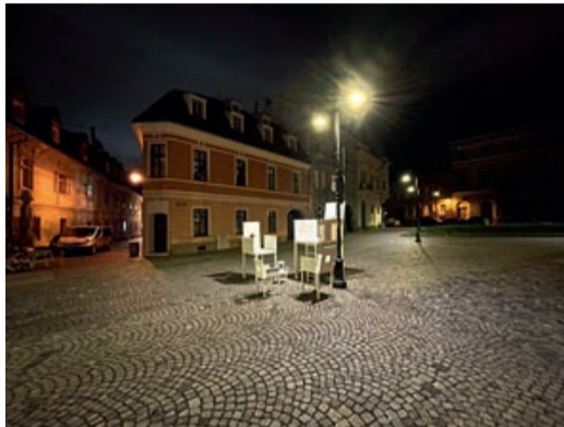
Die „Stadtmöbel“ in der Fußgängerzone.

Das urbane Mobiliar ist ein Projekt mehrerer Kronstädter Architekten unter der Leitung von Alexandru Belenyi und soll Fußgänger einladen, sich dort zu entspannen, aber auch an die Möglichkeiten der Verschönerung solcher Flächen, die hauptsächlich Passanten gewidmet sind, zu denken. Das Projekt soll ein Ausgangspunkt sein, die Aufmerksamkeit auf den urbanen Raum zu lenken, wie auf der Internetseite des Bürgermeisteramts, der das Ensemble bestellt, steht. Des Weiteren wird mitgeteilt, dass ein Stuhl für ein kleines Kind vielseitige Bedeutungen haben kann, von einer Anhöhe, die es besteigen will über eine Herberge, und eine Platt-