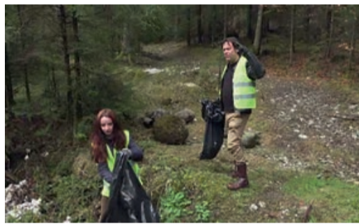
Helfer säubern die hinterlassenen Mülldeponien.

All dies erweckt bei Ausländern den Eindruck, dass die Rumänen sich selbst, ihre Landschaften