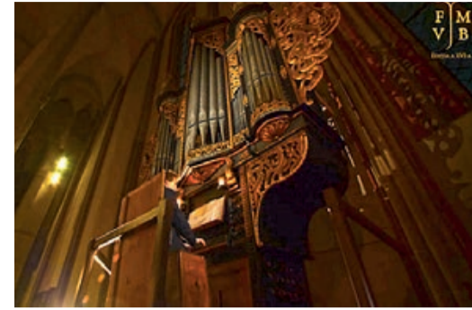
Die Orgel der Schwarzen Kirche.