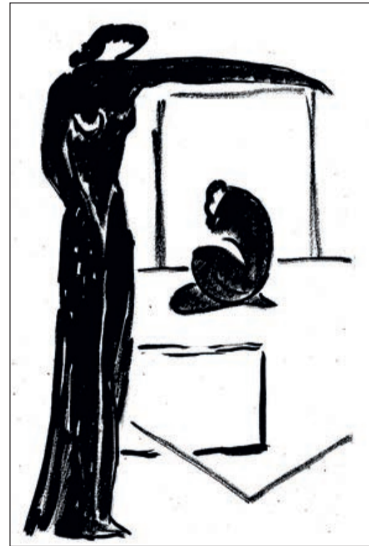
Hans Mattis-Teutsch, Komposition, Tusche

Neue E-Mail-Adresse: schadtafred@gmail.com