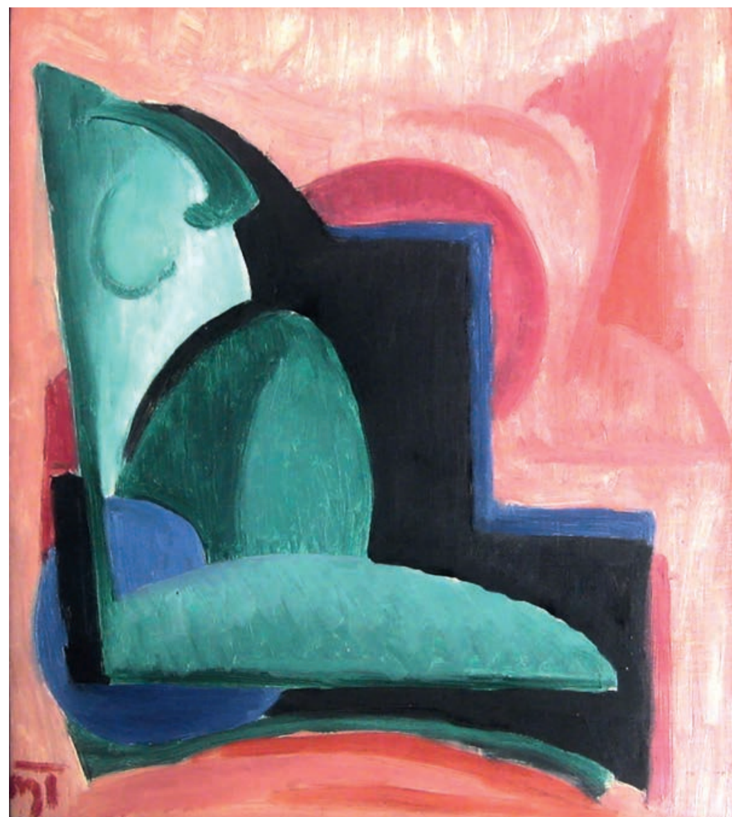
Hans Mattis-Teutsch, Grüner Akt, Ölgemälde