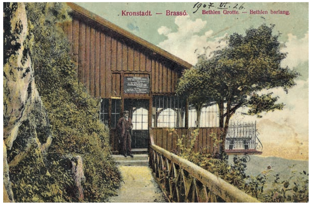
Die Bethlen-Grotte nach der Erweiterung 1905. Die Karte ist bereits am 26.06.1907 postalisch versendet worden.