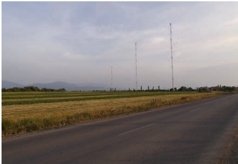
Die Sendeanlagen von der Straße von Brenndorf aus gesehen

Aus diesem Grunde war der Radiosender Brenndorf besonders geschützt d. h. militärisch bewacht, vor allem in der kommunistischen Zeit. Es gab aber noch eine Maßnahme, die ihn vor Missbrauch schützte: Es konnte nämlich von vor Ort nicht gesendet werden, da die Programme per Kabel aus Bukarest übermittelt wurden. Somit war die Besetzung durch die Legionäre im Januar 1941 vergeblich – von hier konnte zur Rebellion nicht aufgerufen werden.