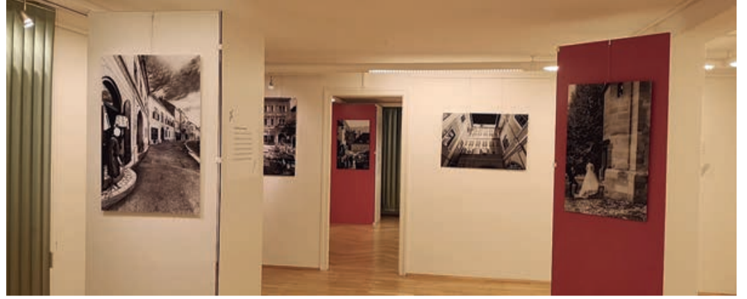
Die Fotoausstellung im HDO in München.

Öffnungszeiten: 19. Januar bis 8. April 2022, Montag bis Freitag (werktags) 10.00 bis 20.00 Uhr im Haus des Deutschen Ostens, München, Am Lilienberg 5. Informationen im Internet www.hdo.bayern.de