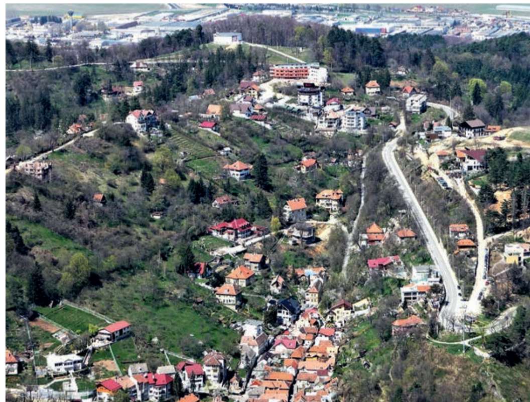
und heute – Kronstadt 2009 Stadtentwicklung, für die sich jeder Kommentar erübrigt. In der Zwischenzeit sind noch weitere Baumaßnahmen hinzugekommen. Werner Halbweiss