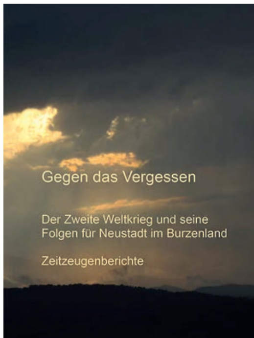
Gegen das Vergessen

Gegen das Vergessen, Der Zweite Weltkrieg und seine Folgen für Neustadt im Burzenland. Zeitzeugenberichte, hrsg. HOG Neustadt, Redaktion Beate Schramm, 2020, zu bestellen bei E-Mail: bea.schramm@gmx.de, € 10,00 inkl. Versand