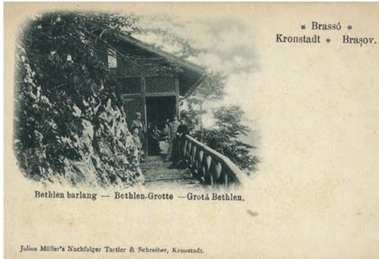
Der Drucktechnik nach zu urteilen, dürfte die vorliegende Karte nach 1896 gedruckt worden sein.

Unsere heutigen Ausführungen sind nicht einem Denkmal gewidmet, sondern einem bei Touristen und Einheimischen ehemals sehr beliebten Ausflugsziel, der Bethlen-Grotte unterhalb der Zinnenspitze.