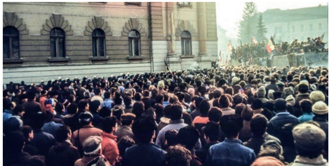
Eine unüberschaubare Menschenmenge hat sich zu den Protesten versammelt.