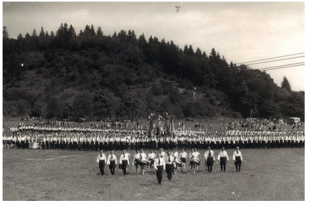
Honterusfest 1939: Aufmarsch auf der Honteruswiese

Nach dem Zweiten Weltkrieg hatten die Kronstädter Sachsen zunächst andere Sorgen (verursacht u. a. durch die Deportation der arbeitsfähigen rumänien-