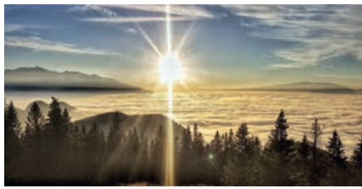
Abendbild von der Schulerhütte.