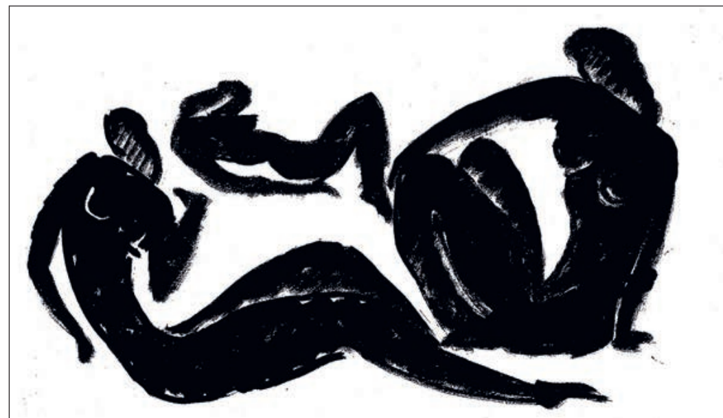
Hans Mattis-Teutsch, Drei Frauen im Gespräch, Tusche