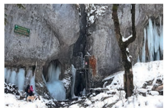
Aus: „Bună ziua Braşov“, vom 2. Februar 2022