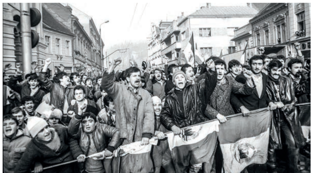
Proteste in der Klostergasse.