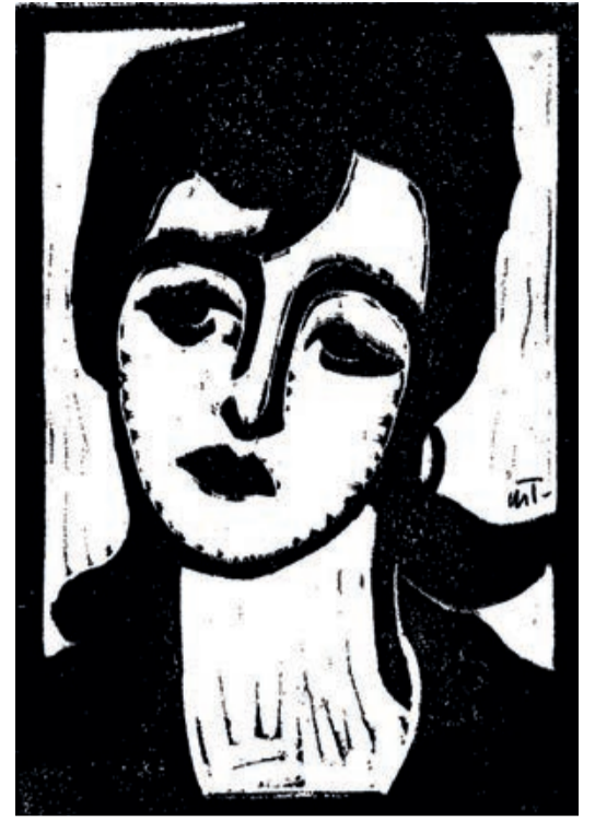
Hans Mattis-Teutsch, Bildnis, Linolschnitt