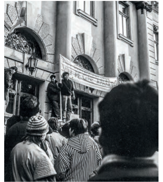
Proteste vor dem Gebäude des (damaligen) Kreispartei Komitees (früher: Justizpalast; heute: Kreisrat)

zeigt. Wir bedanken uns bei Florin Man, dass er eine Auswahl seiner Fotografien zum Abdruck in unserer Zeitung zur Verfügung gestellt hat. uk