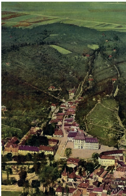
Gestern – Aufnahme aus dem Jahr 1913/14 ...