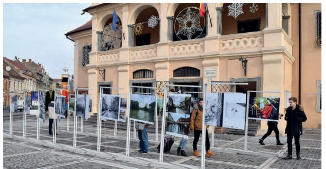
vor dem alten Rathaus