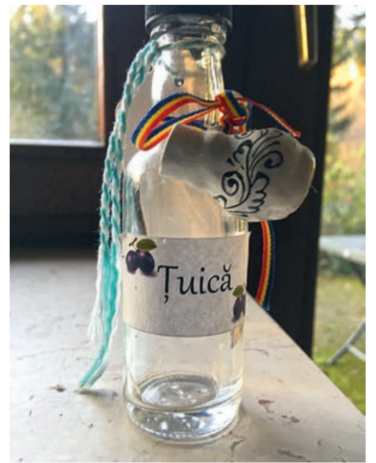
Eine Flasche Zuika

Zurück zum Bombardement: wenn Papa nicht mindestens eine halbe Stunde mit den Gendarmen bei einem Glas verweilt hätte um zu sagen, dass wir die Gemeinde Araci verlassen, dann hätte uns die Bombardierung genau vor dem Radiosender erwischet. Auf der Pferdeplattform waren wir exponiert, also ließen wir sie auf der Straße zwischen Brenndorf und Araci und liefen zum Ufer des Altes, wo wir uns unter Pappeln versteckten. Ich glaube auch heute noch, dass wir beschossen wurden, denn keine fünf Meter von uns entfernt rasselten die Maschinengewehrketten in den Bach. Wie auch im-