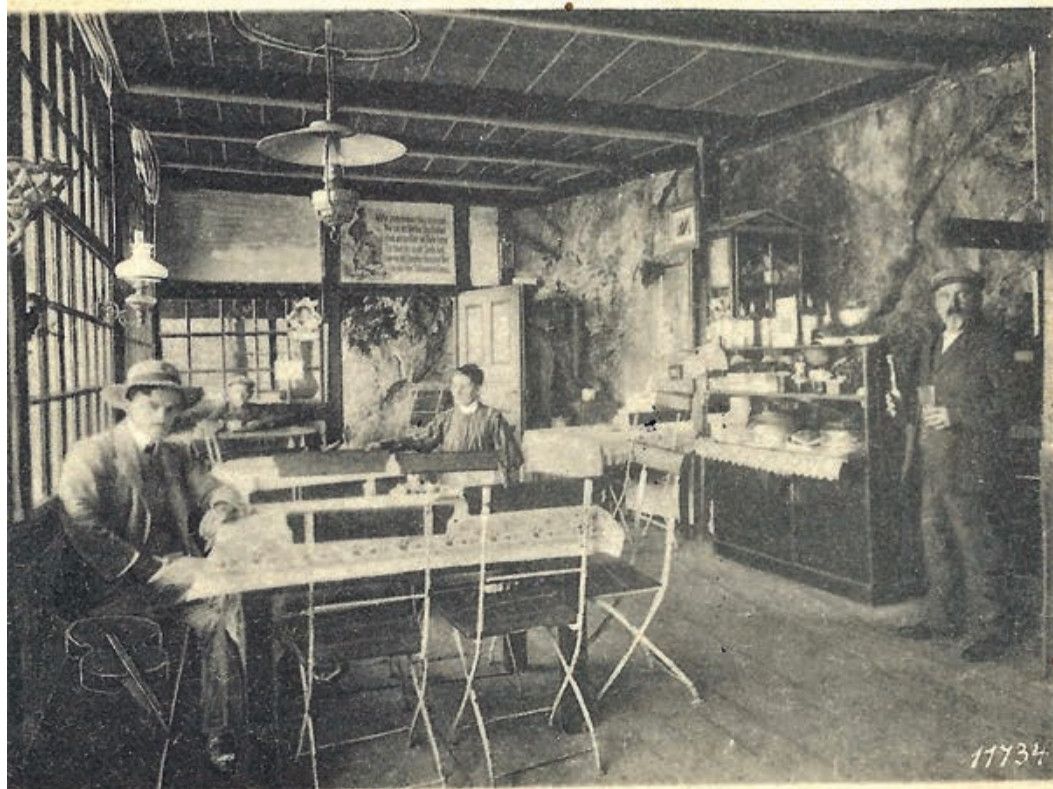
Gruss aus Bethlen Grotte Brassó Kronstadt 17734 Der Innenraum nach der Erweiterung 1905. Die Karte ist am 06.08.1909 postalisch gelaufen.

auf unsere aufmerksamen, treuen Leser, die uns schon häufig weitergeholfen haben und uns auch hier vielleicht weiterhelfen können.