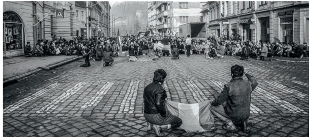
Demonstranten in der Klostergasse knien zum gemeinsamen Gebet.