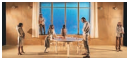
Szenen der Aufführung