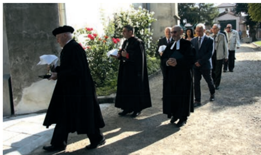
Das jährlich veranstaltete Bartholomäusfest ist auch der Begegnungsort von Pfarrern, Kuratoren, Kirchengliedern aus Burzenländer Kirchengemeinden.