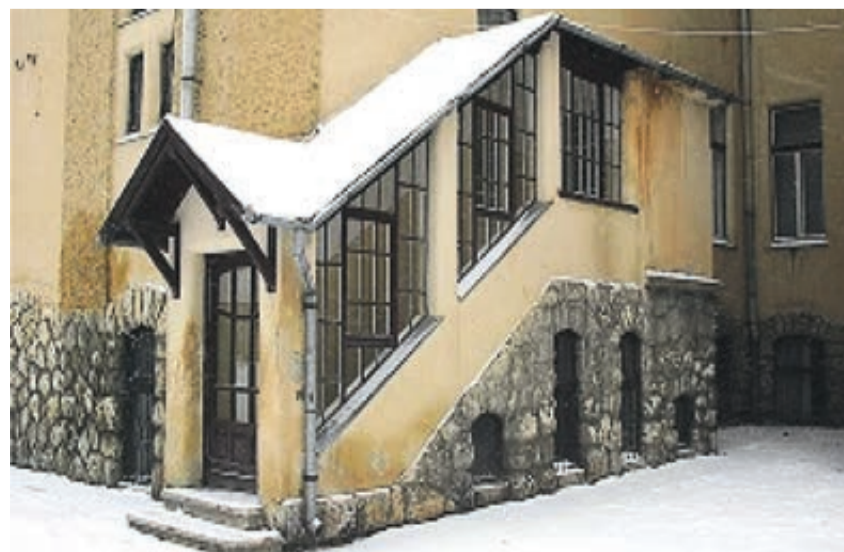
Hintereingang: War wohl nicht einfach, hineinzukommen.