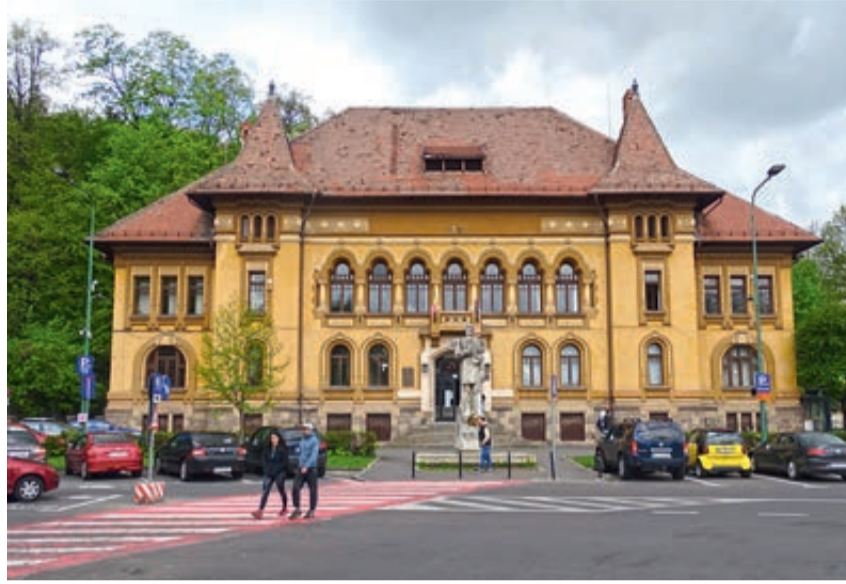
Die Industrie- und Handelskammer Kronstadt beruft sich auf ihre Gründung im Jahr 1850. Ende der 1920er Jahre bezog sie den am Fuße der Postwiese gelegenen, von neurumänischen Stilelementen geprägten prachtvollen Neubau.