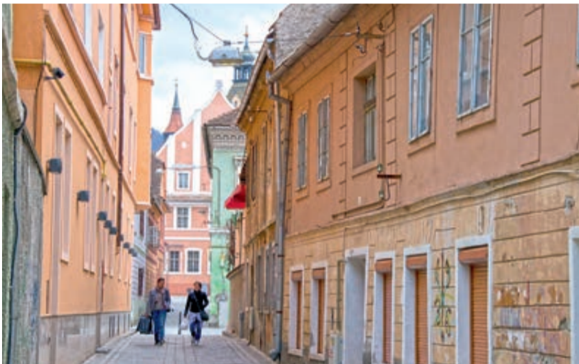
Die Valentin-Wagner-Gasse. Im Hintergrund die Fassade des Burzenländer Hofes.

Nur wenige von den neuen Straßennamen haben eine direkte Beziehung zur Stadtgeschichte. So gehen wir in unseren folgenden Ausführungen von den heute üblichen Straßennamen aus, und blenden in die Vergangenheit zurück.