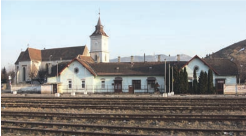
Erweiterungen des Bahnhofs erfolgten 1908, als die Verbindung zu Fogarasch hergestellt wurde, und Ende der 30er Jahre. 1967 wurde das neue, moderne Bahnhofsgebäude eingeweiht, das alte Gebäude ist jedoch bis heute erhalten und wurde als Dienstwohnung verkauft, wird aber als Gewerbefläche genutzt.

rei und einer Papierfabrik in Zernescht, dem ältesten Unternehmen mit rumänischem Kapital in Siebenbürgen, und der Zuckerfabrik in Brenndorf führte. Den Rohstofftransport konnten die Wagen nicht mehr bewältigen. Und die Kaufleute hatten die verstopften Straßen