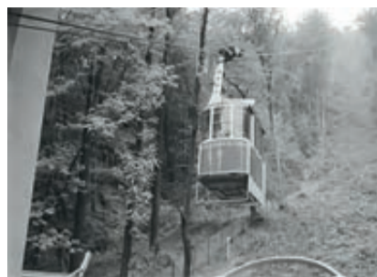
Ein frühes Foto der Seilbahn auf die Zinne.

Nur wenige wissen jedoch, dass die Seilbahn ohne den „Goldenen Hirsch“ aus Kronstadt nie gebaut worden wäre. Die Kreisparteileitung forderte den Bau einer Seilbahn seit 1967, aber das Geld wurde erst 4 Jahre später zugeteilt. Die Entscheidung wurde getroffen, damit das Land vor ausländischen Sängern gut dastehe, und gleichzeitig wurde beschlossen, auf dem Gipfel der Zinne ein Res-