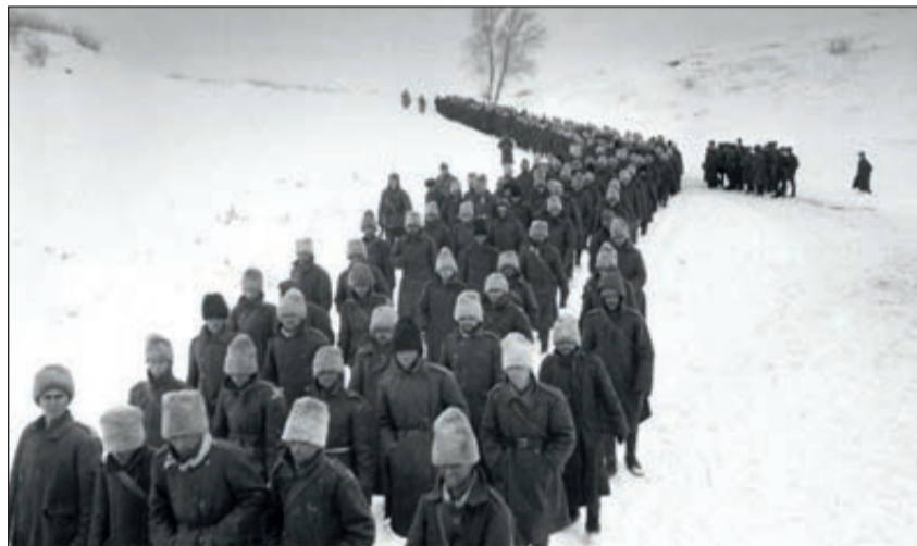
Rumänische Gefangene bei Stalingrad

Juden auch in ihrer Umgebung geworden war und welches Schicksal sie erwartete, handelte sie. In großer Eile (da jeder Tag die Deportation bedeuten konnte) richtete sie einen Raum im Keller des Hauses ein, der durch eine verschlossene Tür hinter einem Regal versteckt war. Danach brachte sie nach und nach notwendige Möbel, Faltbetten, Matratzen, De-