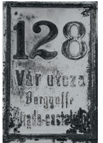
Nummernschild mit Straßennamen in den drei Landessprachen, seit 1890

nes Honterus. Durch dies Gässchen gelangen wir westwärts auf den früheren „Rosenanger“, heute George-Enescu-Platz, nach dem großen rumänischen Komponisten (1881-1955) benannt, der