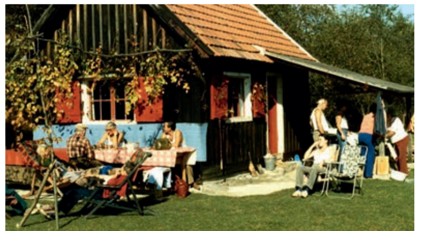
Winzerfest bei der Gartschintalhütte, 1984