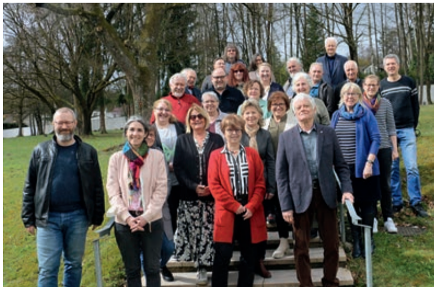
Die Teilnehmer des Presseseminars mit den Referenten.