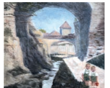
P. Nagy: Graft-Passage mit Grafttastei in Kronstadt (um 1940)

Aus: „KR/ADZ“, vom 16. März 2023, von Alfred M. Molter (Berlin)