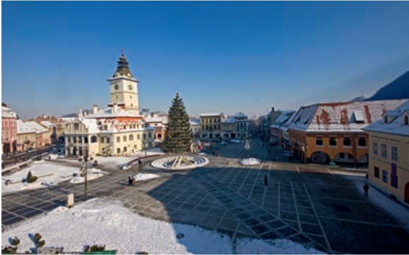
Blick auf den Marktplatz mit Rathaus und Kornzeile im Hintergrund.

(Fortsetzung von Seite 1) gens mit Rumänien. Neue Straßennamen gab es nach dem zweiten Weltkrieg und nach der Ausrufung der Republik (30. Dezember 1947) sowie in den sechziger Jahren.