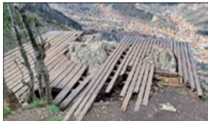
Ungesichert liegen die Holzlatten auf der Plattform.

Die Aussichtsplattformen auf der Zinne wurden vor mehreren Jahren von Studenten aus mehreren europäischen Staaten angebracht. Nun befinden sich die Holz-