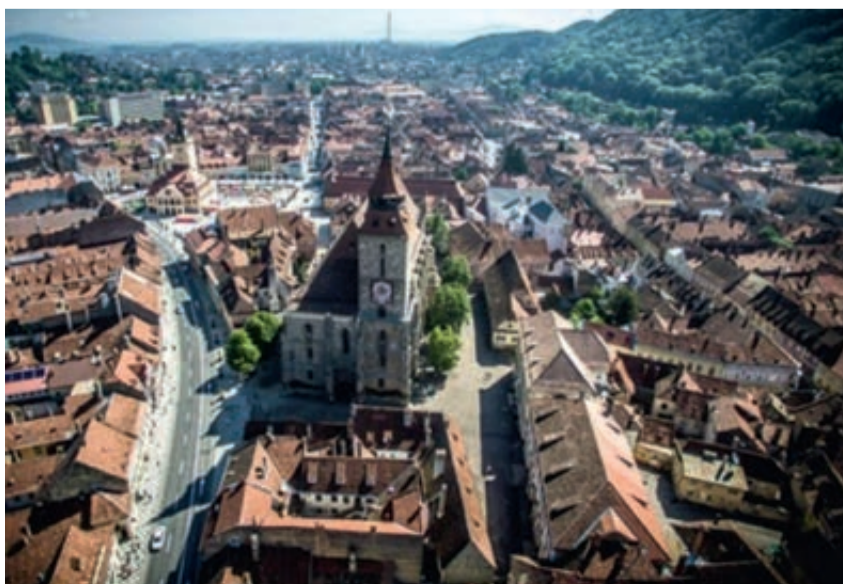
Ungewohnte Perspektive: Die Schwarze Kirche und die Innere Stadt aus der Vogelperspektive aufgenommen.