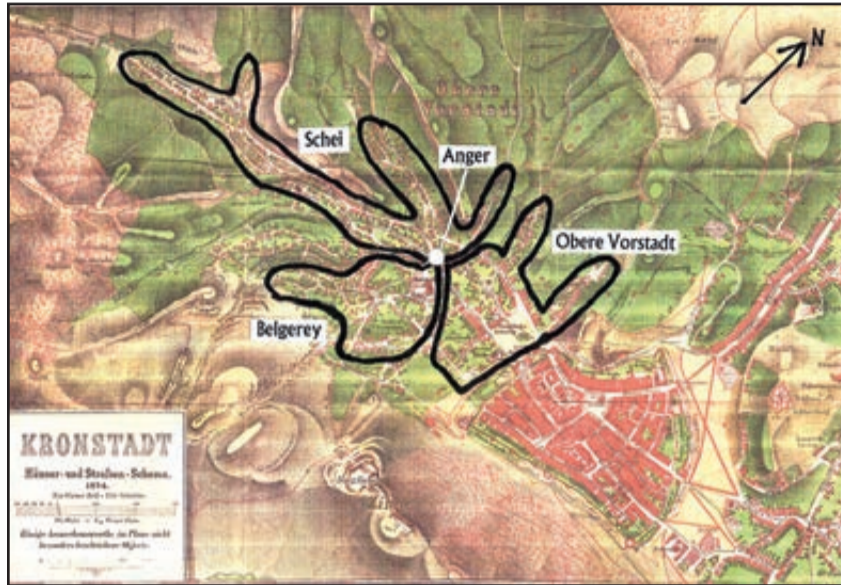
Der historische Stadtplan von 1874