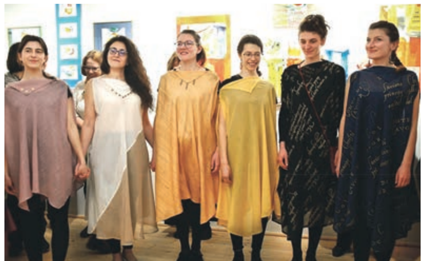
Models tragen die Frühlingskollektion.

Über 150 Kostüme hat sie bislang genäht. Keines gleicht dem anderen. Keines wurde nach Vorlagen gemacht, keines (Fortsetzung auf Seite 14)