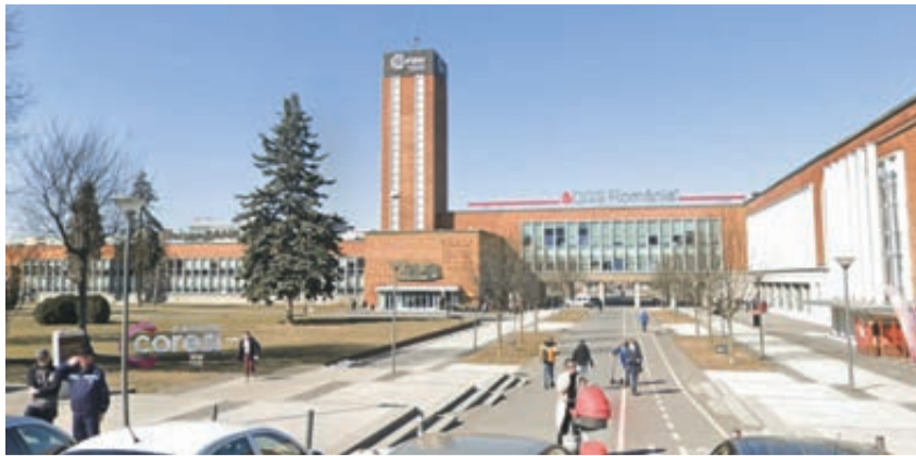
Der Turm, Symbol des ehemaligen Traktorenwerkes von Kronstadt, soll gesichert und ertüchtigt werden. Dafür sind 1,5 Millionen Euro eingeplant, der neue Name steht auch schon fest: Coresi Business Center

denen die verschiedenen Modelle der erzeugten Traktoren zu sehen sind, die mit 26 bis 180 Pferdestärken den Landwirtschaften in 57 Ländern zur Verfügung gestellt wurden. Der Film sollte weitere Interessenten auf das Produkt aus Kronstadt zum Kauf motivieren. Leider hat diese Werbung nicht den erwünschten Erfolg gebracht, es wurden allmählich immer weniger Traktoren gebaut. Viele Arbeiter verließen das Werk, meist kehrten sie in ihre alte Heimat zurück, ein großer Teil in die Moldau.