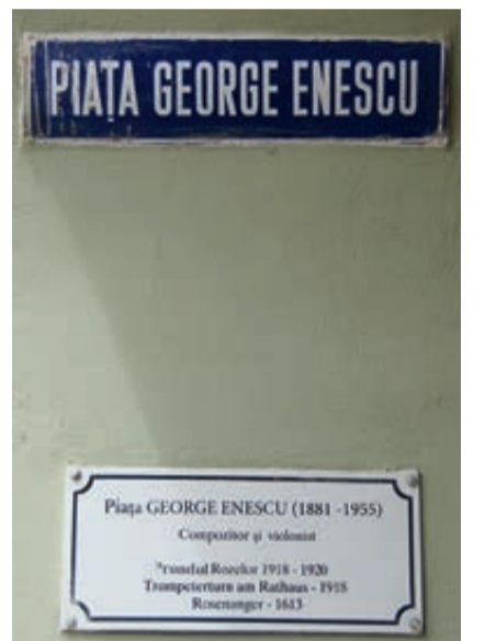
Die neuen Straßenschildern mit den früheren alten Namen.

nes Honterus. Durch dies Gässchen gelangen wir westwärts auf den früheren „Rosenanger“, heute George-Enescu-Platz, nach dem großen rumänischen Komponisten (1881-1955) benannt, der