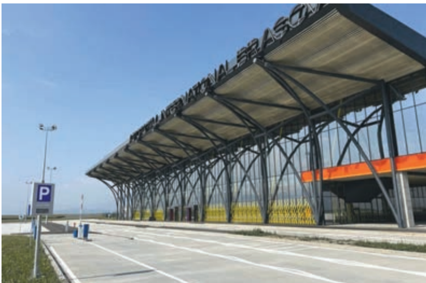
Flughafen Kronstadt-Weidenbach, der erste, der in den letzten 50 Jahren in Rumänien gebaut wurde.

Die Strecke war 20,643 km lang und umfasste 10 Bahnhöfe. Der Zug war gemischt und hatte nur 2 oder 3 gelbe Personenwagen mit jeweils 20-30 Sitzplätzen. Die Dampflokomotive wurde mit