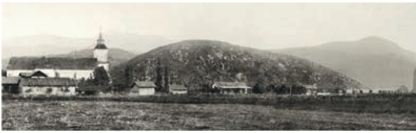
Der Bahnhof Bartholomä – ein Bild aus der Zeit um 1900, als der Bahnhof bloß aus dem Hauptgebäude bestand und einer Überdachung aus Holz mit Kletterpflanzen.

Vor 132 Jahren verließ der erste Zug den neuen Bahnhof Kronstadt nach Zernescht.