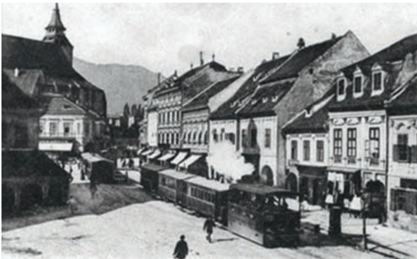
Am 7. März 1892 wurde die erste Vorortbahn Rumäniens, Bartholomä – Siebendorfer, eingeweiht. Der erste Zug verließ den Bahnhof am 5. Dezember 1891.

Die Bahnhöfe in Neustadt, Rosenau und Zernescht wurden erst am 24. Juni 1892 eingeweiht. Die Bahnstrecke wurde aus 1417 Holzschwellen pro Kilometer auf Bett aus Flusssteinen gebaut und mit Eisenklammern befestigt, ein Überbau, der eine Geschwindigkeit von 40 Kilometern pro Stunde erlaubte. Die Länge der Eisenbahn betrug 25,3 Kilo-