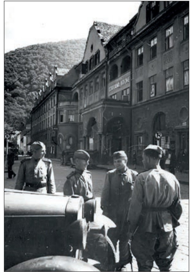
Soldaten der Sowjetunion in Kronstadt

Meine Großeltern gehörten beide der deutschen Minderheit an. Mein Großvater war noch an der Front und meine Großmutter mit ihren drei Kindern (6, 2, eins knapp älter als ein Jahr) in Kronstadt. Jede Nacht bedeutete Angst, jeder Tag nur einen Aufschub. Und dann eines Nachts standen die Soldaten vor der Tür, und sie musste den Koffer packen. Aber als sie die Soldaten sah, schickte sie ihr ungarisches Dienstmädchen zu ihren jüdischen Freunden, die sie gerettet hatte und die jetzt in Freiheit lebten. Nach kurzer Zeit kam ihr jüdischer Freund und sprach mit den rumänischen und sowjetischen Militärs. Er erzählte ihnen, wie meine Großmutter ihnen das Leben gerettet und sie über Jahre versorgt hatte. Wie er sie überzeugt hat, weiß nur er, aber es gelang ihm, meine Großmutter von der Liste zu streichen. Sie wurde nicht deportiert. Obwohl sie und ihre Familie in den folgenden Jahren alles durch