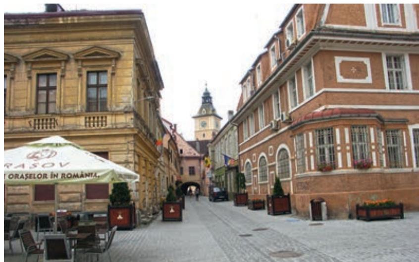
Durch den „Dunklen Gang“ kommt man vom Rosenanger auf den Marktplatz

führende ist die ehemalige Johannissgasse, Namen den sie heute wieder tragen darf nachdem sie in kommunistischen Zeiten nach dem sowjetischen Dichter Wladimir Majakowski (1894 - 1930) benannt war. Ihr Prunkstück ist die Johanniskirche, die noch Zierelemente des 16. Jahrhunderts zeigt und im 18. Jahrhundert barock ausgestaltet wurde. Die Gasse wurde auch Johanniss-Neugasse genannt, weil sie eine der später angelegten Gassen war, mit denen ur-