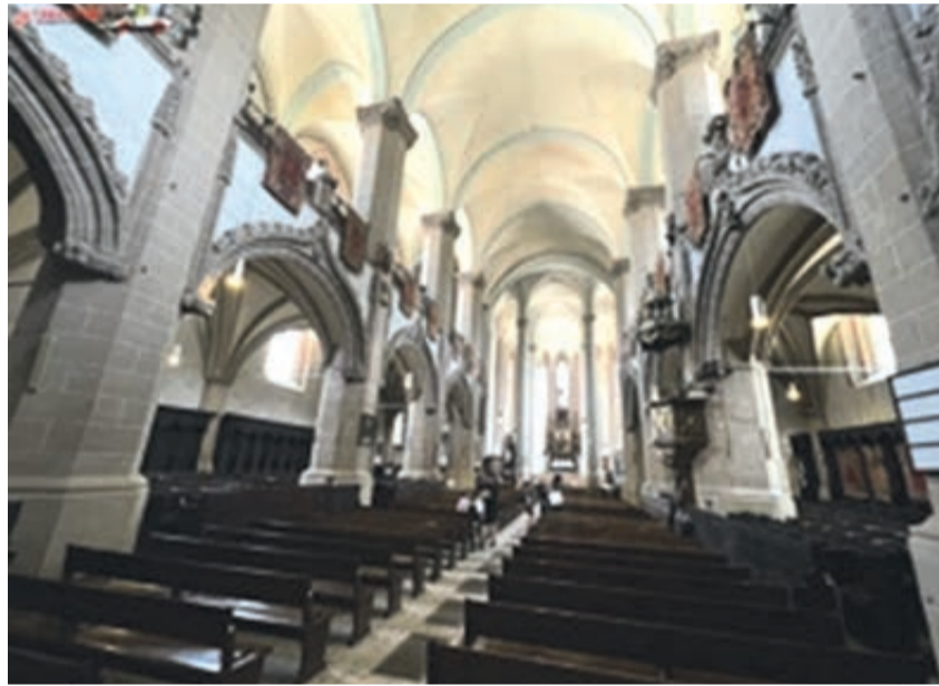
Schwarze Kirche innen: „Ihre Stadt soll zu Staub und Asche werden“

Aber die Gründe des Feuers sind im Geheimen geblieben. Es wird vermutet, dass es die habsburgischen Soldaten waren, die sich an den Lutheranern, aber auch an den Kronstädtern insgesamt rächen wollten, da ihnen ein Jahr zuvor der