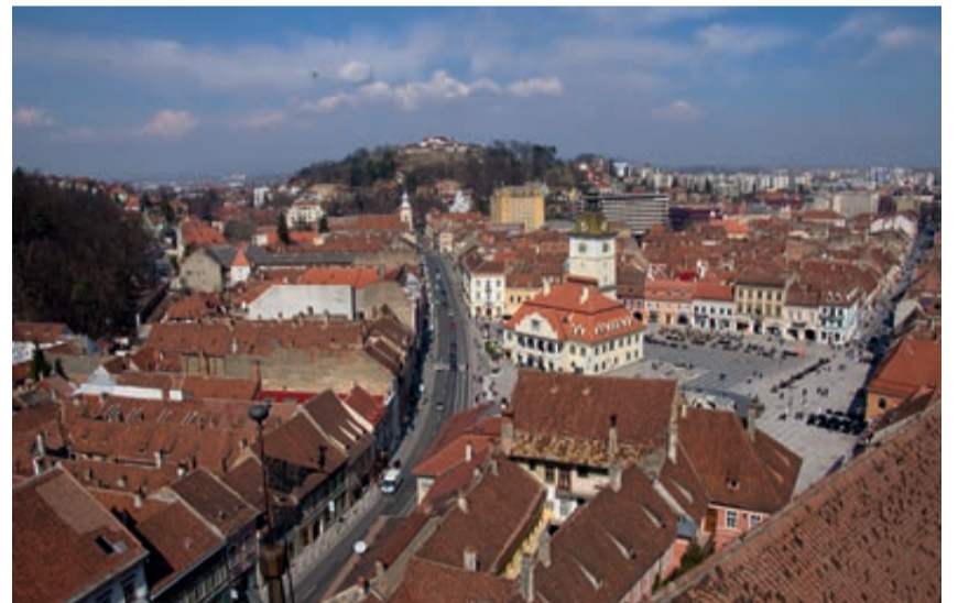
Die Klostersgasse vom Kirchturm gesehen

Die Innere Stadt von Kronstadt wurde in ihrer heutigen Anlage am Anfang des 13. Jahrhunderts von deutschen Ansiedlern gegründet, die sich im Tal unter der Zinne niederließen, unterhalb der älteren rumänischen Siedlung „Schei“, die später zur „Oberen Vorstadt“ von Kronstadt wurde. Im 14. Jahrhundert wurde