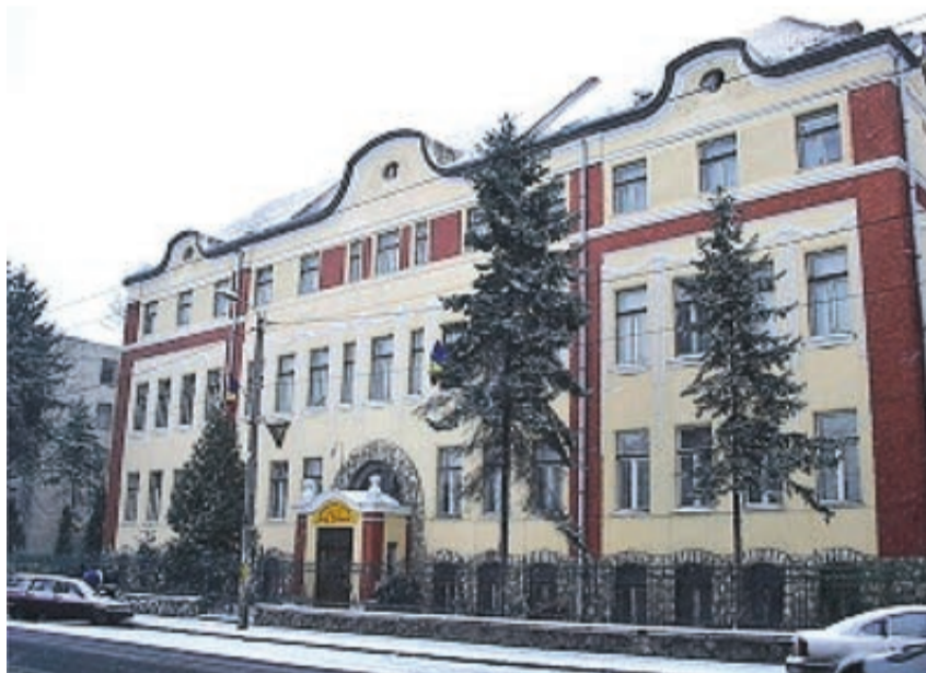
Die Berufsschule ist ein Gebäude in der ehemaligen Bahnstraße, heute Iuliu Maniu

Ein Gesetz zur Modernisierung des Handwerks, beziehungsweise der Handwerksbetriebe, von 1872, schaffte das