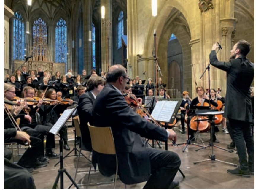
In gewohnt festlichem Rahmen präsentiert sich die Musikwoche Löwenstein.

Das Siebenbürgenlied wurde in diesem Konzert mit Unterstützung des Verbandes der Siebenbürger Sachsen Deutschland erstmals in einer Fassung für Chor und Orchester aufgenommen. Die Auf-