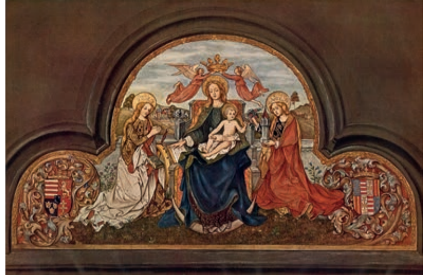
Marienbild in der Vorhalle der Schwarzen Kirche

Die türkischen Bedrohungen führten zur Unterbrechung der Arbeiten, da sich