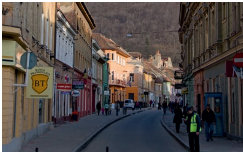
Blick in die Michael-Weiss-Gasse gesehen von der Klostersgasse

Von hier geht es westwärts durch ein kleines Gässchen – früher Bäckergasse genannt. Dann wurde die Gasse Strada Smărdan, nach der Ortschaft in Bulgarien, wo die rumänischen Truppen im Unabhängigkeitskrieg am 24. Januar 1878 einen großen Sieg über die türkischen Truppen errangen. Seit 1990 heißt sie Valentin-Wagner-Gasse, nach dem Mitarbeiter und Nachfolger von Johan-