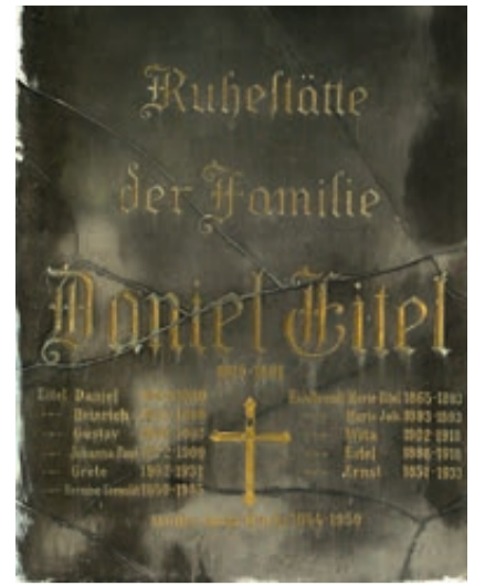
Gruft der Familie Eitel (C40) Friedhof der Inneren Stadt.

geschichte im Besonderen und vor allem über die Schwarze Kirche erbracht, die den Ausgangspunkt für spätere Forschungen bildeten und auch heute noch gültig und dokumentarisch wertvoll sind.