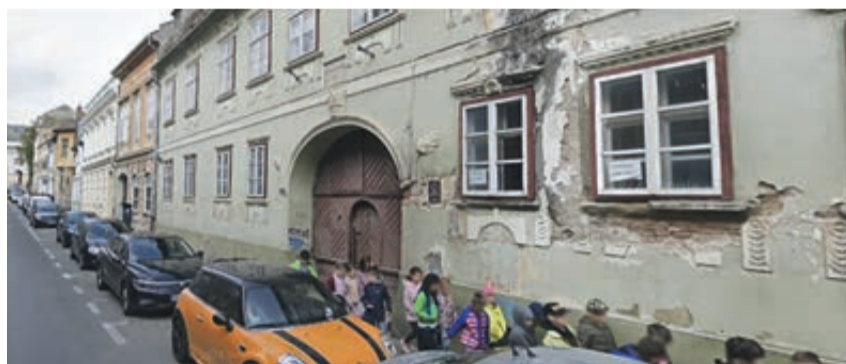
Das Haus in der Waisenhausgasse 14 wartet auf seine Sanierung.

Vorgesehen ist die Sanierung des Gebäudes seit Jahren. Es gehört zur Honteruschule, da als Gebäude E benannt. Als Objekt von historischer Bedeutung hat die Stadtverwaltung bereits im Jahre 2017 beschlossen, die Sanierung anzugehen. Die geschätzte Summe für die Erstellung der technischen Dokumentation belief sich auf 45 214 Lei. Die Arbeiten konnten nicht beginnen, die ersten Schätzungen galten inzwischen als überholt, sodass neue zu erstellen waren. Jetzt schwebt die Schätzung bei 129 800 Lei, aber es müssen noch weitere Genehmigungen und danach neue Angebote abge-