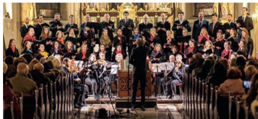
Der Bachchor sang das Weihnachtskonzert 2022 in der römisch-katholischen Kirche Sankt Peter und Paul.

Wie kann man die Leute motivieren, am Chor teilzunehmen?