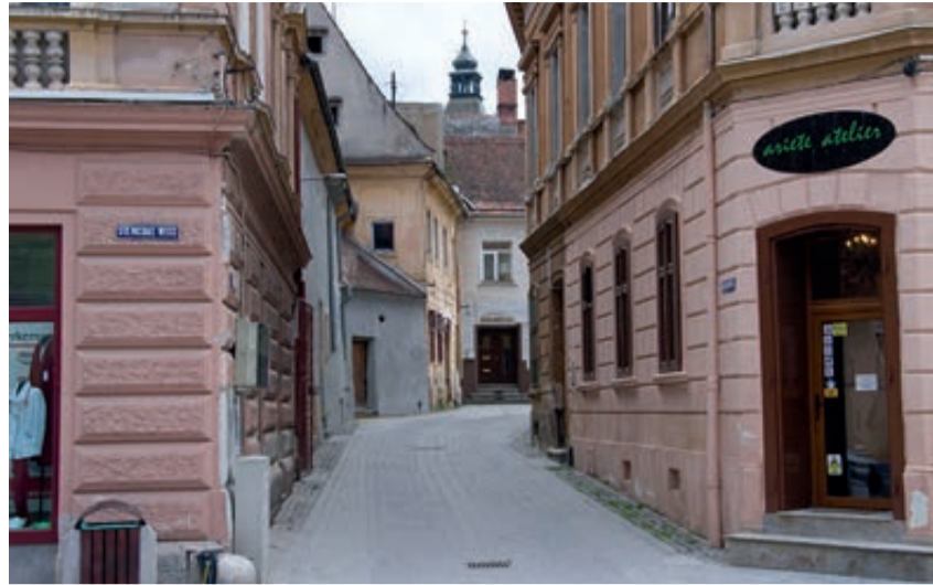
Das südliche Gässchen zum Rosenanger aus der Michael-Weiss-Gasse

bis zum Anfang des 20. Jahrhunderts wirkte. Im Jahre 1833 wurde sie von dem fortschrittlichen Buchdrucker Johann Gött (1810-1888) erworben, der im Jahre 1837 die ersten hiesigen Zeitungen herausbrachte, darunter das „Siebenbürger Wochenblatt“ – ab 1849 „Kronstädter Zeitung“ – und die „Blätter für Geist, Gemüth und Vaterlandskunde“.