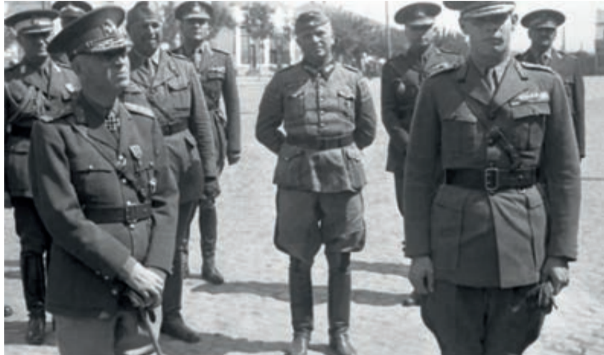
Marschall Antonescu und König Michael

Während des Zweiten Weltkriegs war Rumänien ursprünglich einer der Ver-