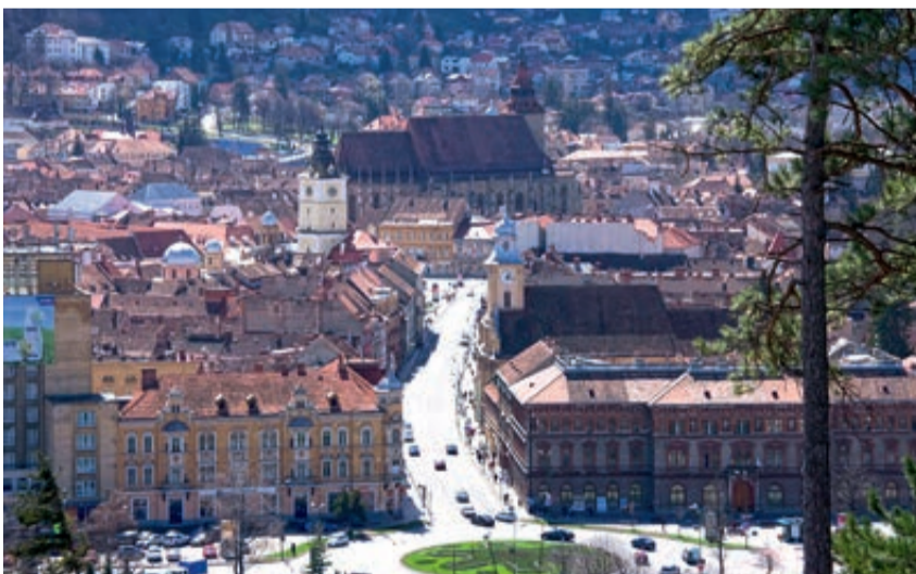
Die Klostersgasse gesehen vom Schlossberg mit der Schwarzen Kirche im Hintergrund

Wir möchten hier nicht auf alle Sehenswürdigkeiten in dieser Straße ein-