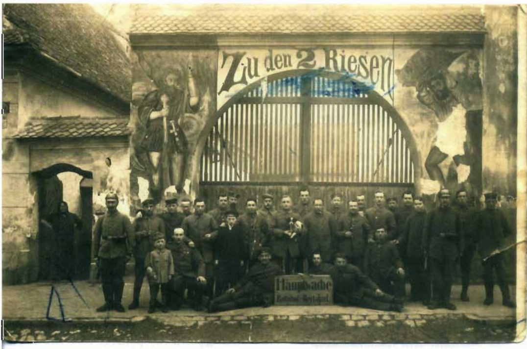
Gasthaus „Zu den 2 Riesen“ in der Langgasse 176

Vor mir liegt eine, leider beschädigte, Ansichtskarte aus der Zeit des Ersten Weltkrieges. Eine Gruppe Uniformierter von der Hauptwache Bahnhof-Bertalan posieren vor dem großen Einfahrtstor zum Gasthof „Zu den 2 Riesen“. Die Wirtin, mit in die Hüften gestemmt Armen, hat sich in das Eingangstürchen zurückgezogen. Es ist zu erkennen, dass schon vor fast hundert Jahren der Putz bröckelte und eine Renovierung der Fassade erforderlich gewesen wäre. Auf der Rückseite der Karte, folgender Text: „Zur steten Erinnerung an Ihren Freund Alois Obermeier München“. Der Alois muss wohl unter den Beteiligten gewesen sein und hat die Karte seiner von ihm verehrten Bartholomäerin (wer ist sie?) geschenkt.