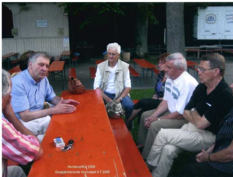
Besprechung in Pfaffenhofen

Dass diese anvisierten Ziele realistischerweise nicht nach klaren Zeitvorgaben umgesetzt werden können ist selbstredend. Auch wenn in Zukunft noch die eine oder andere Hürde zu nehmen sein wird oder viel Überzeugungsarbeit zu leisten ist, ist es die Absicht der Initiatoren, den eingeschlagenen Weg konsequent weiterzugehen. Es geht jetzt darum, die praktische Umsetzung mit kleinen Schritten zu beginnen, um kurzfristig auch einige Ergebnisse vorweisen zu können.