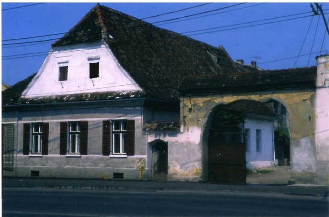
Haus Langgasse 176, ehemaliges Gasthaus, heute