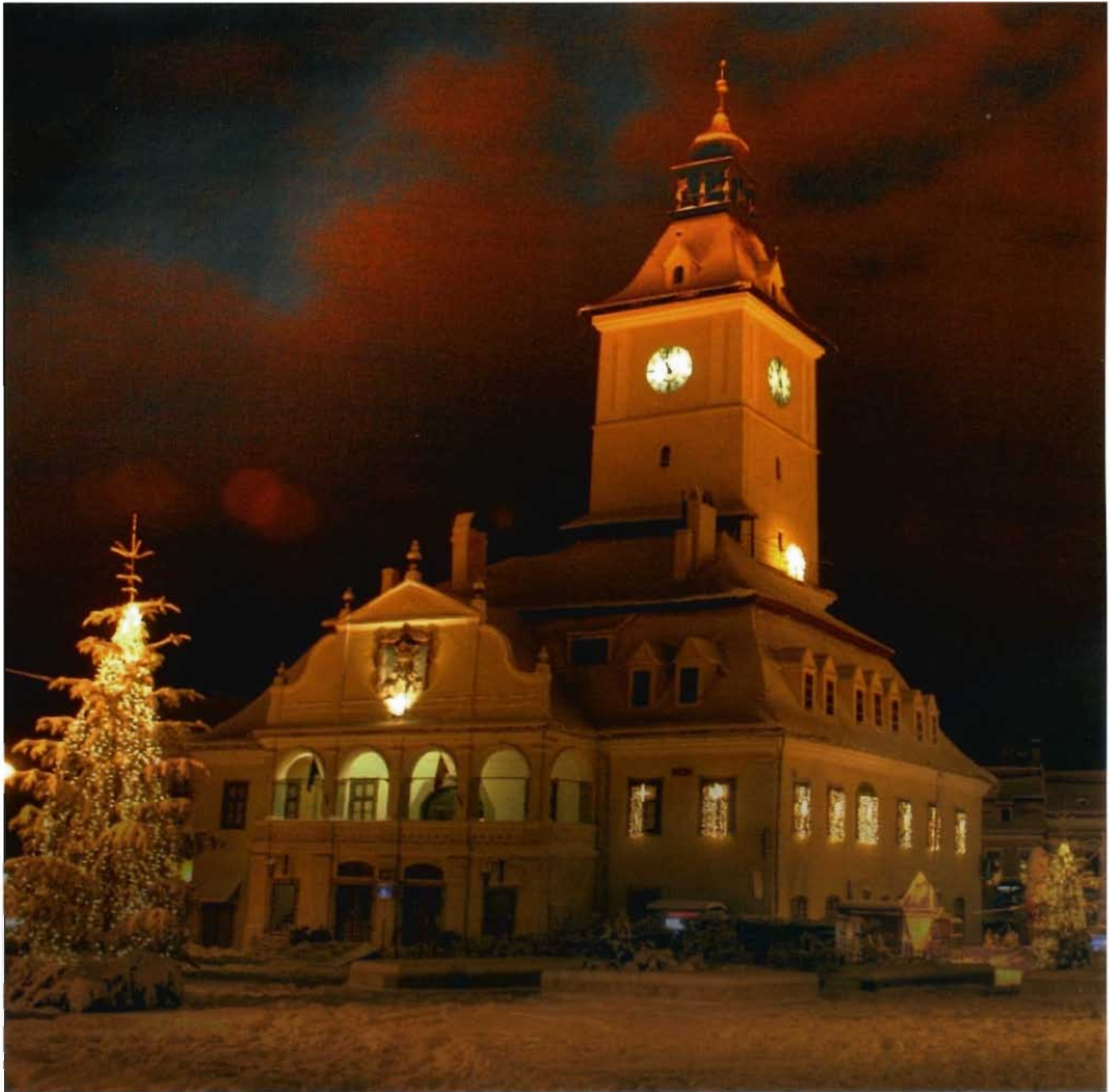
Der Kronstädter Rathausplatz im winterlichen Lichterglanz

Der Vorstand der HOG Bartholomae und das neu gewählte Presbyterium der Kir- chengemeinde Bartholomae wünscht allen Bartholomäern ein glück- liches Neues Jahr