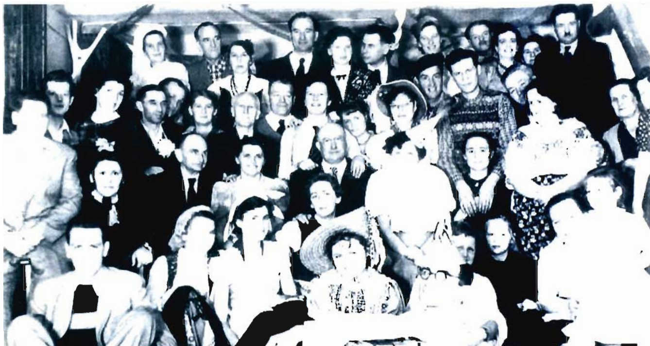
Der Bartholomäer Kirchenchor und Freunde beim Faschingsfest am 2. Februar 1957 in der Tischlerwerkstatt von Michael Cloos