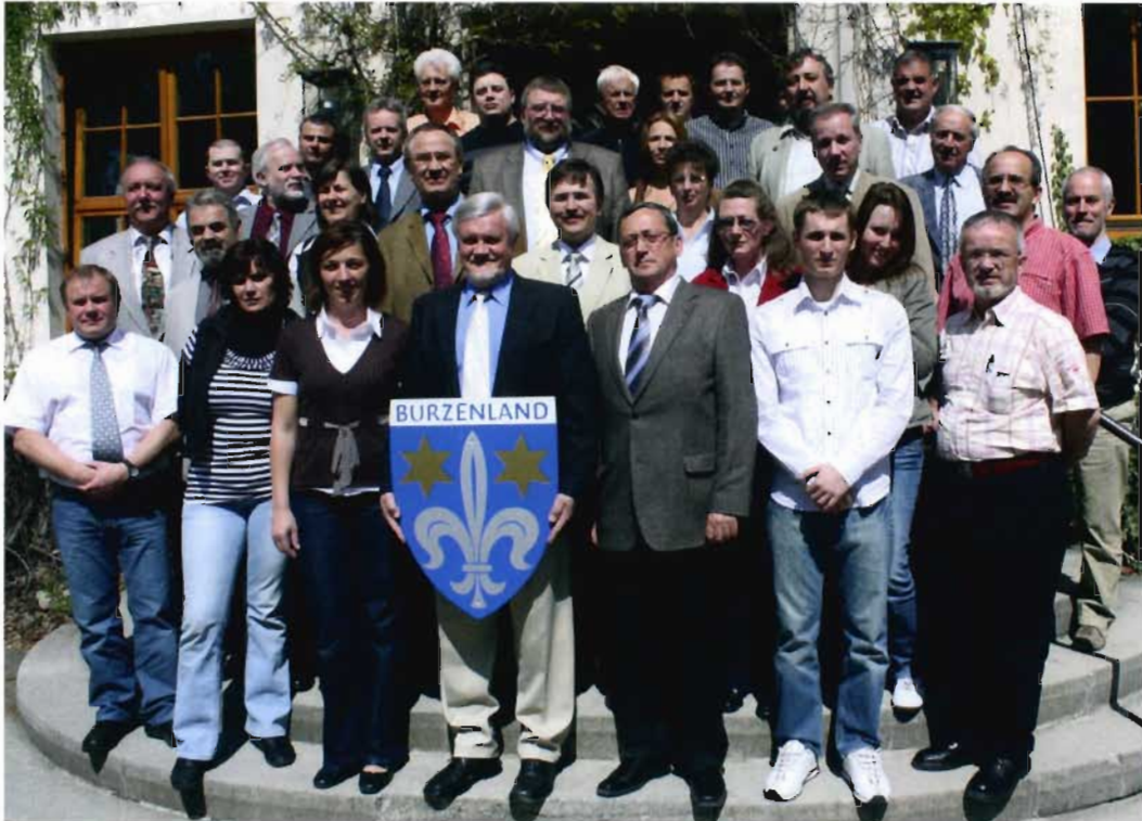
Teilnehmer der Tagung der Regionalgruppe Burzenland am 24 bis 26. April 2009 in Neuhaus.

Fachvortrag zum Thema Wappenrolle auf der 15. Tagung der siebenbürgisch-sächsischen Heimatortsgemeinschaften im Oktober 2009 in Bad Kissingen an.