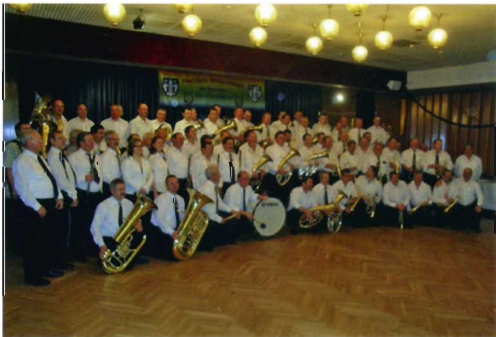
73 Burzenländer Musikanten gestalteten ein Konzert der besonderen Art.

Stark vertreten waren die Heldsdorfer, die fast aus eigener Kraft (mit einer einzigen Aushilfe) am Samstag spielten, nachdem sie am Freitag geprobt hatten. Sie bestachen durch junge talentierte Bläser und eine durch Moderation angekündigte Liedfolge und Solisten. Ihnen folgten die vereinigten Bläser der Zeidner und Tartlauer