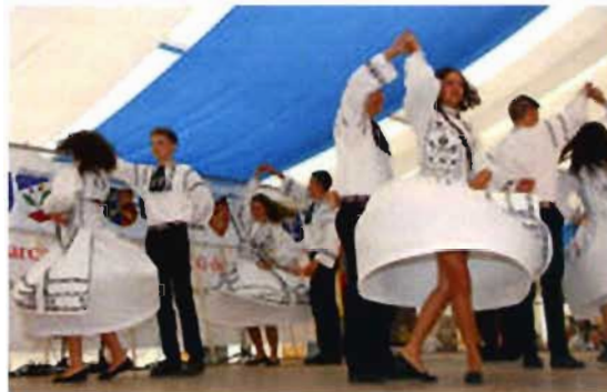
Auf der Bühne im Festzelt kamen sowohl die Tanzgruppen als auch ihre schönen Trachten voll zur Geltung.