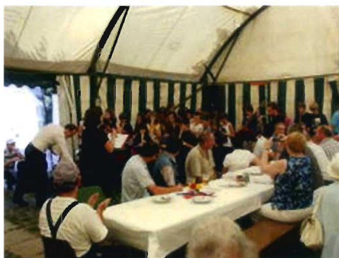
Das Canzonetta-Ensemble während des gemeinsamen Singens der Gäste im Festzelt.