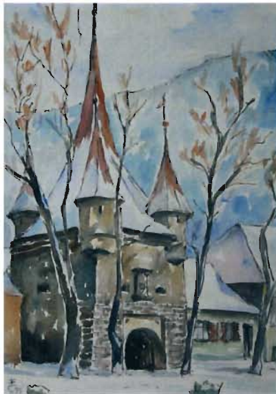
Erhard Wächter: Katharinentor, Aquarell, 1980, 30 x 42 cm.

Während all der Lehrjahre malte und zeichnete Erhard Wächter in jeder freien Stunde. Kronstadt und die Umgebung boten ihm dabei vorzugsweise die Motive: die alten historischen profanen und sakralen Architekturen der Stadt, die Wälder, Berge und Bäche der dort omnipräsenten Karpatennatur. Wächter verstand sich vor allem als Maler von Landschaften, mit denen er sich bei der Arbeit im Dialog wusste. Schon die frühen Arbeiten weisen ein Charakteristikum auf, das bis heute seine Aquarellmalerei bestimmt: der feinnervige Umgang mit der Wasserfarbe, das lyrische Gespür für die spezifische, dem Aquarell immanente Transparenz des Kolorits und für das Gesetz der Spontaneität, dem sich die Aquarellmalerei dank des zerfließenden Farbauftrags unterwirft. Dem Kenner zeigt sich in Wächters Arbeiten auch der – mittel- und unmittelbare – Einfluss des Meisters dieses Genres Heinrich Schunn, dessen Landschaftsaquarelle mit siebenbürgischer Thematik bis heute zum Besten ihrer Gattung zählen.