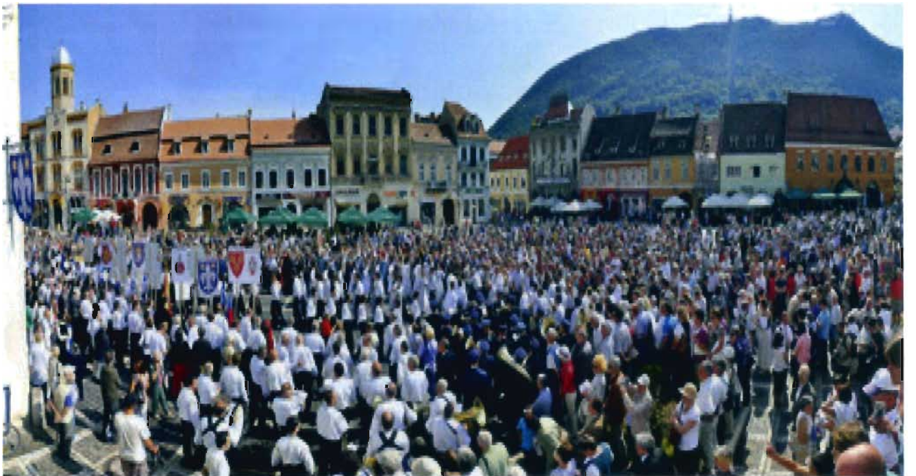
Dreitausend Teilnehmer versammelten sich auf dem Marktplatz, um das 21. Sachsentreffen in Kronstadt zu feiern.