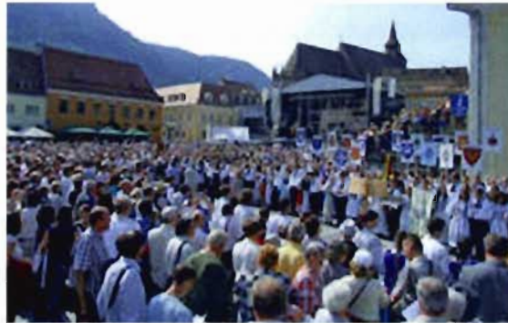
Eine der Höhepunkte des Sachsentreffens war der Aufmarsch der Tanzgruppen am Alten Marktplatz.