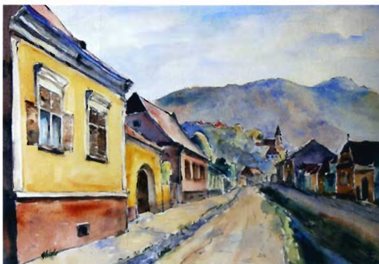
Erhard Wächter: Mittelgasse in Kronstadt mit Martinsberger Kirche und Zinne. Vorne links das Haus des Künstlers. Aquarell, 1975, 30 x 42 cm.