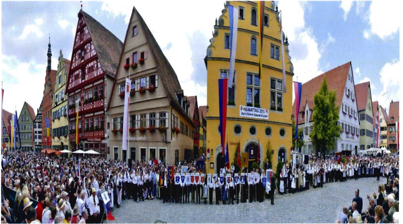
Heimattreffen 2011 in Dinkelsbühl