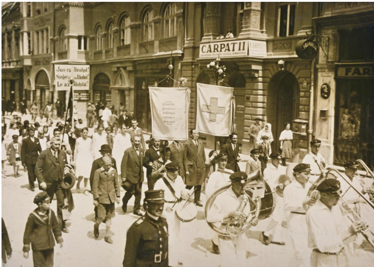
„Jos cu alcool“