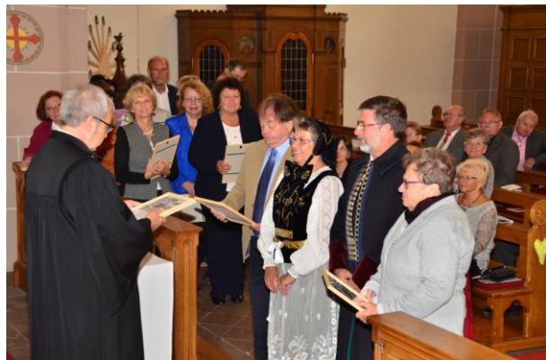
Bericht und Fotos Horst Müller