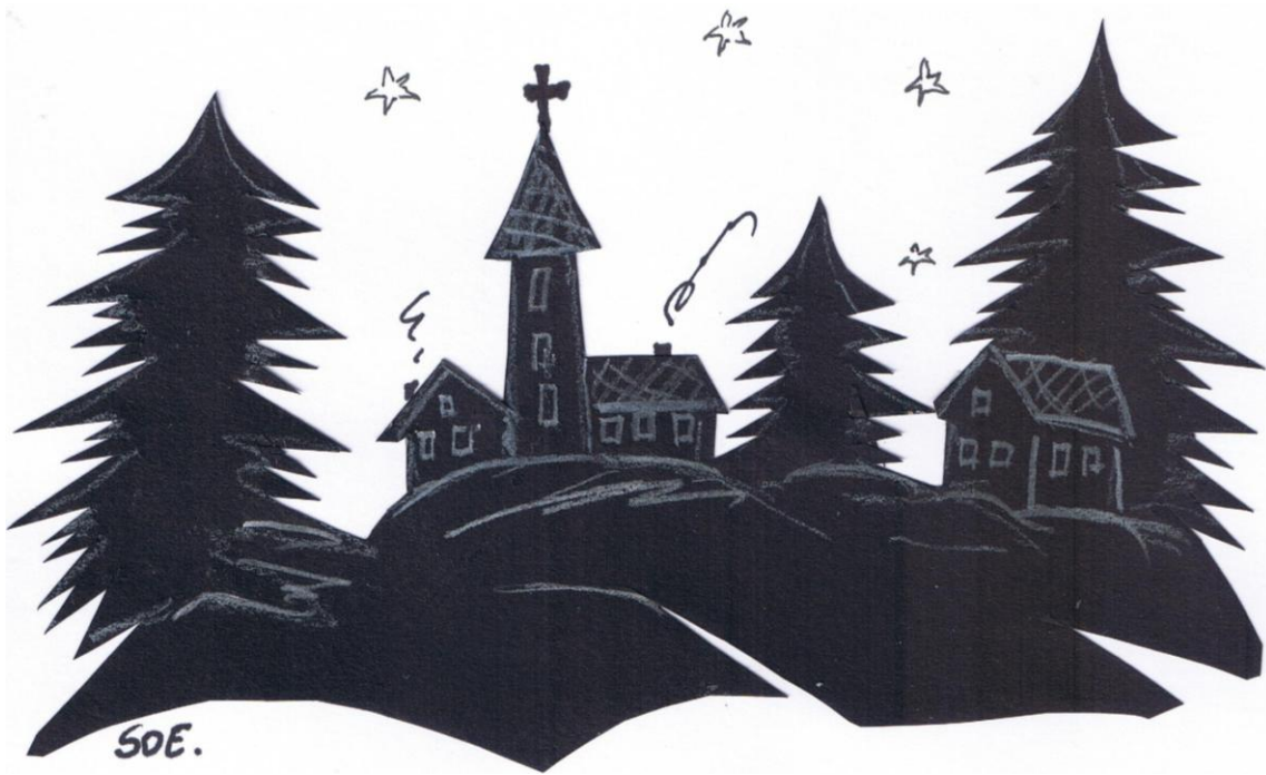
Scherenschnitt von Erika Sooss