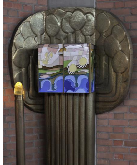
Tabernakel / 1985, 3-teiliger Zellenschmelz - Katholische