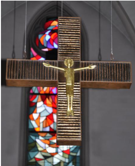
Hängekreuz / 1970, Messing montiert - Katholische Kirche in Dessau-Roßlau