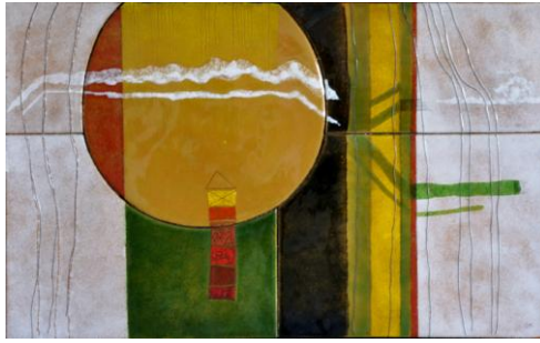
Elemente / 1990 – 50x83 cm Email